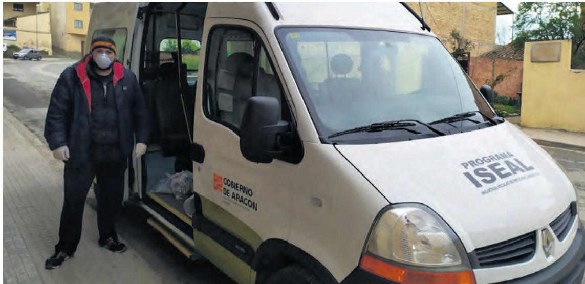
La entidad comarcal reparte el material entre los ayuntamientos y los centros de salud del territorio. NDM

Por otra parte, el Gobierno de Aragón envió material a la Comarca con el fin de que fuese repartido por los diferentes pueblos. "Los municipios habían hecho un listado con la gente