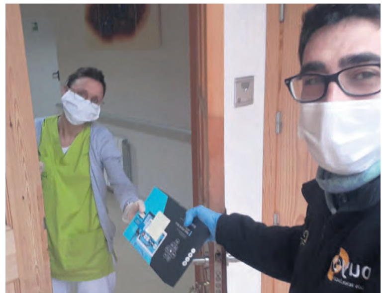
La empresa ha repartido tablets en diferentes instalaciones del territorio. NDM

El objetivo de esta cesión es facilitar la conexión entre los residentes, especialmente