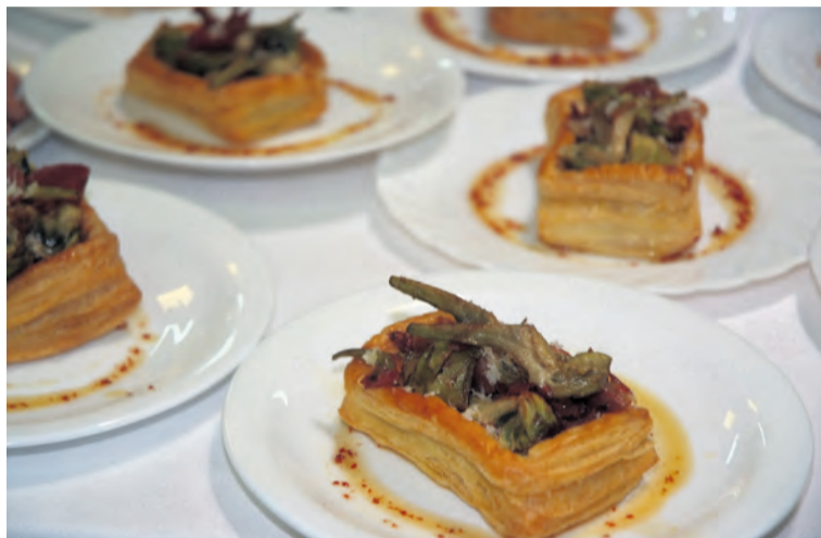
'La cassola del Matarranya' pretende dar valor a los productos de la zona. NDM

Por este motivo, y porque hay una gran preocupación en todos los sectores económicos del territorio, se ha decidido lanzar varias iniciativas a través de la constitución de una mesa de trabajo, a la que se ha denominado PEC (Plan Estratégico de Crisis), la formación de la cual pretende aunar esfuerzos para afrontar la situación que vive el 'destino Matarraña' . Un grupo que está formado por la Asociación de Empresarios del Matarraña, varios empresarios turísticos no asociados y el Departamento de Turismo de la Co-