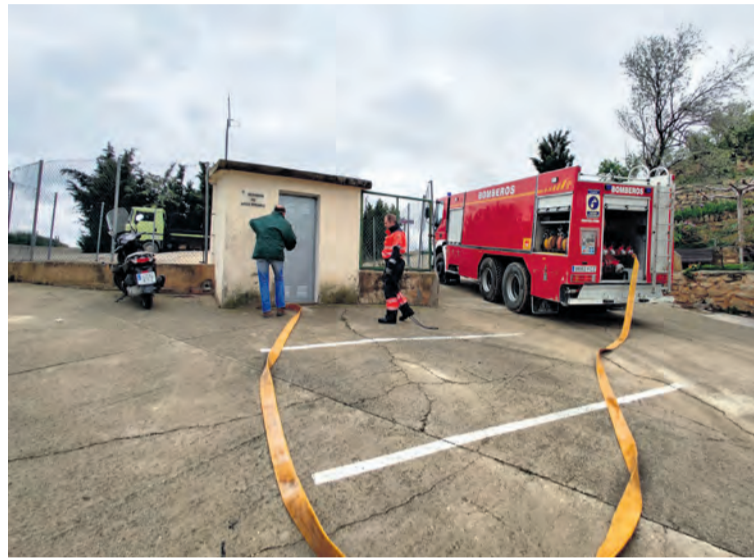
Los bomberos tuvieron que suministrar agua a la red de La Fresneda.

Por suerte, el pasado 14 de abril el suministro de agua volvió a la normalidad. "Los últimos resultados han dado valores de concentración de nitratos de 41,20mg/l en la captación y 36,8 mg/l en el depósito, de manera que el