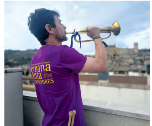
Tambores y cornetas sonaron en los balcones. M. Bel

En cuanto a Fuentespalda , en los pregones del pueblo se emitió un fragmento de la Rompida. Asimismo, el sábado siguiente, después del aplauso los vecinos encendieron unas velas en sus balcones con la intención de crear una señal para simbolizar la Semana Santa .