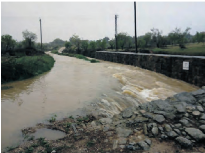
Las obras pretenden que el agua pase por encima en lugar de por debajo.