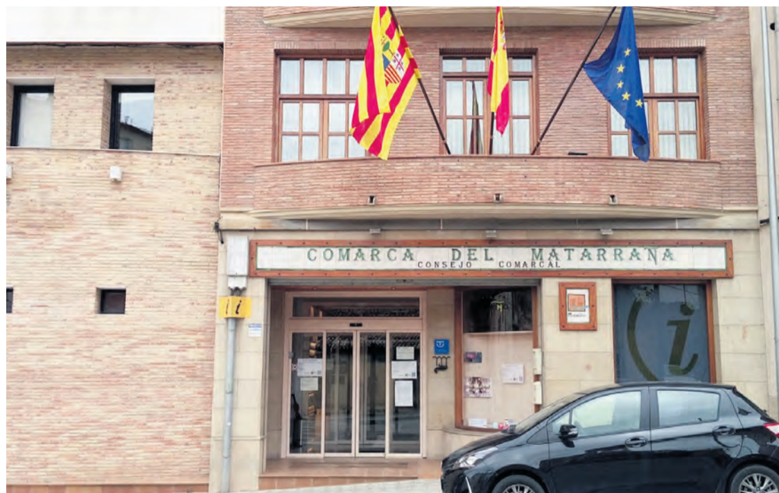
Los servicios sociales de la Comarca del Matarraña están trabajando al máximo durante esta situación de confinamiento. NDM

Los trabajadores de Servicios Sociales de la Comarca han estado en comunicación constante con las residencias de ancianos, los centros de salud y con todos los que pudiesen requerirlo. En este sentido, siguen trabajando en ayuda a domicilio y dependencia, activando todos los protocolos de intervención familiar, asesoramiento psicológico, entre otros. Para disponer de los servicios de trabajadoras sociales, educadora social o psicóloga se puede contactar