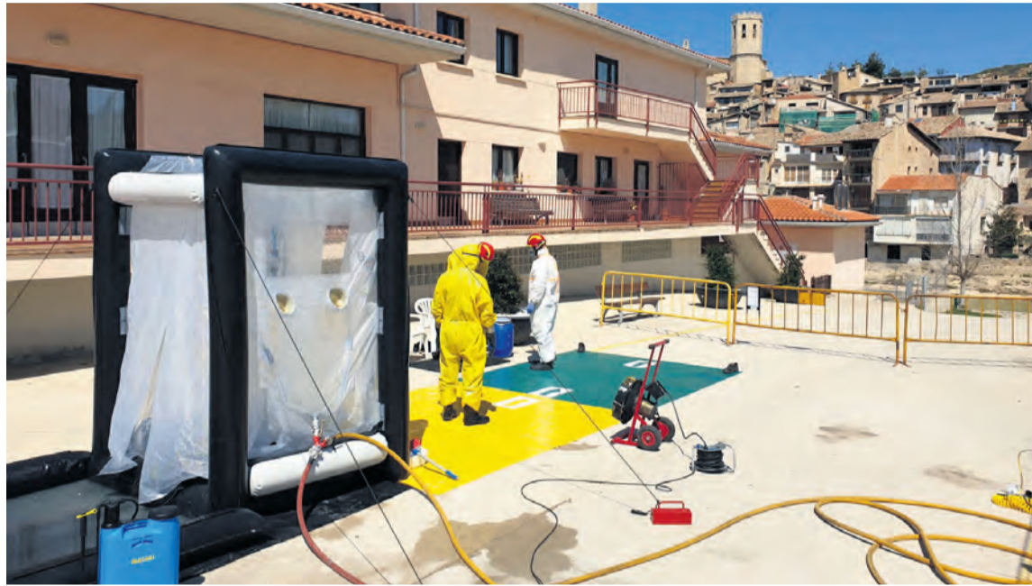
La desinfección se realiza pulverizando una solución de lejía diluida en todos los espacios. NDM

Los trabajos consisten en la desinfección de las instalaciones para la que colocan una estación de desinfección por la que pasan antes y después los efectivos de bomberos , y acometen la limpieza de las habitaciones, espacios comunes y consultas, así como en las zonas exteriores. Para la desinfección se han establecido