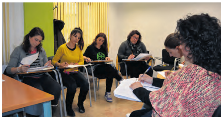
Las clases iniciaron en febrero y se encontraban en la parte teórica. M/G

Hasta ahora el taller se encontraba en su fase teórica y ha podido reestructurarse, ya que hasta junio no in-