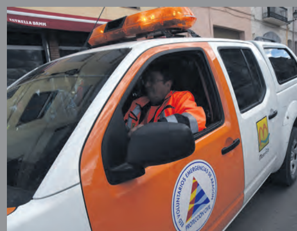
La UCO del Matarraña está plenamente operativa. NDM

Una vez constituida, los diferentes representantes acordaron estar en permanente contacto, a la vez que se decidió llevar a cabo una reunión semanal. Al mismo tiempo, aunque la Unidad se ha formado para hacer frente al COVID-19, la intención es que se alargue en el tiempo y que permita resolver futuras urgencias o necesidades en los diferentes sectores económicos y sociales de la Comarca del Matarraña.