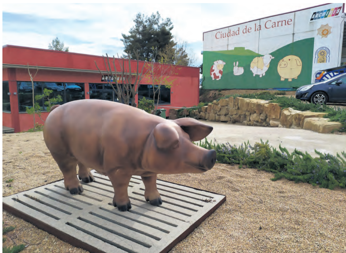
GUCO sigue destinando sus fondos de promoción y obra social a iniciativas que contribuyen a la lucha contra el COVID-19. NDM

La empresa matriz del Grupo de Empresas Arcoiris, GUCO, cuenta con unos fondos anua-