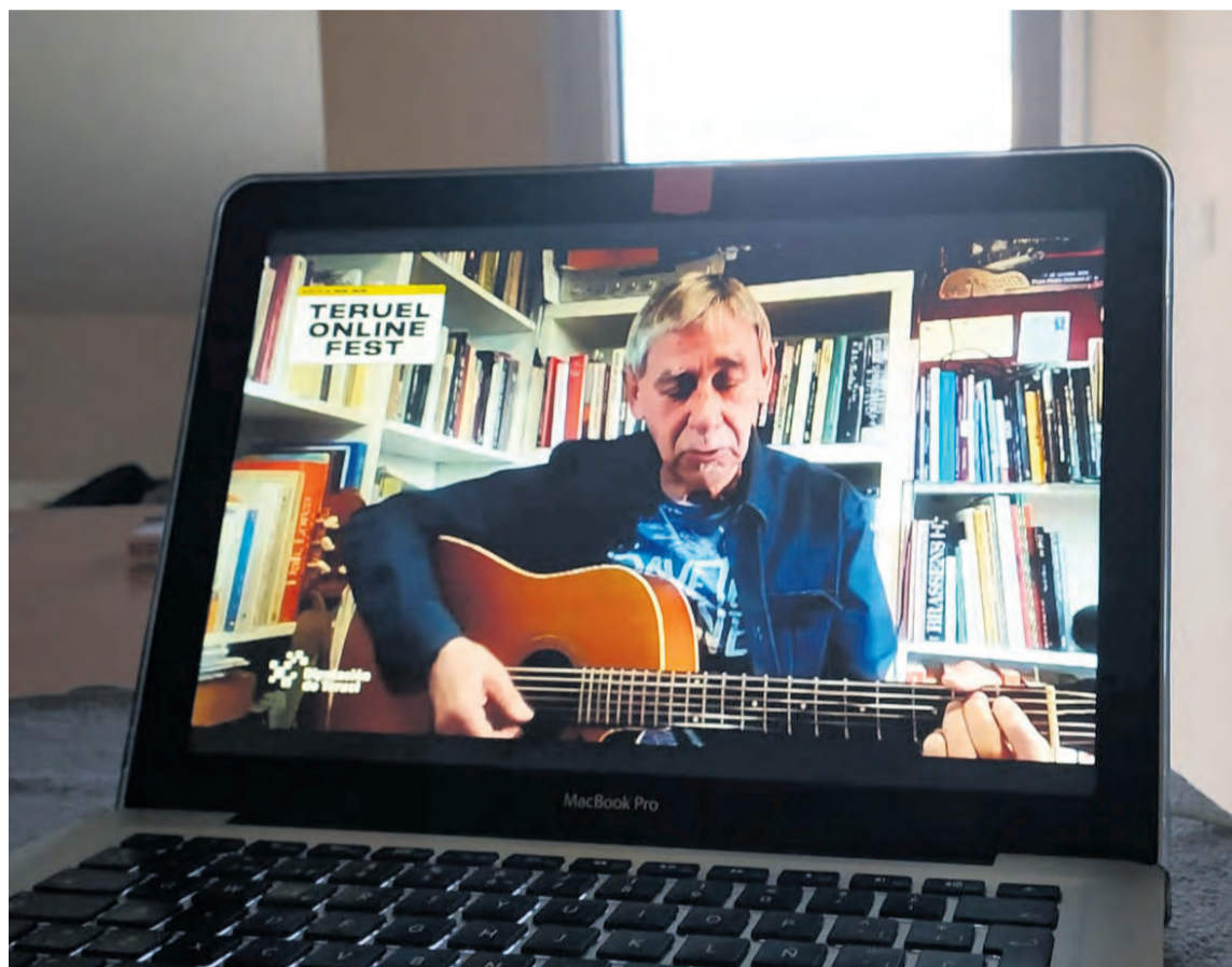
El canal de YouTube de la Diputación acumuló más de 11.000 visitas durante la emisión del Teruel Online Fest. NDM

Los resultados del certamen fueron muy positivos , tal y