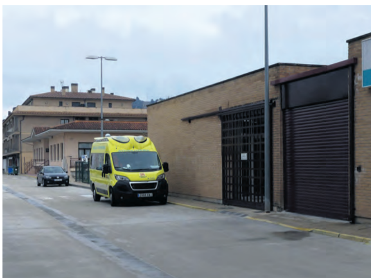
Valderrobres es el pueblo más afectado de la Comarca del Matarraña. NDM

Mientras, desde el Gobierno de Aragón se alertaba de la compra de test, incidiendo en