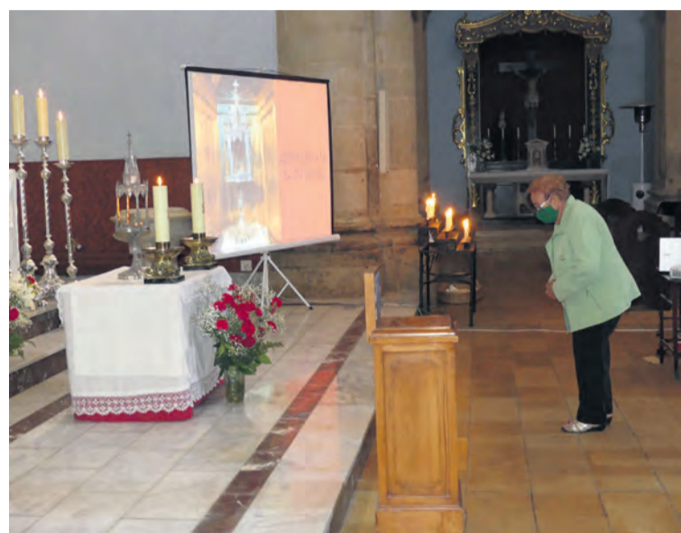
Los fieles adoraron la reliquia con una reverencia. JP