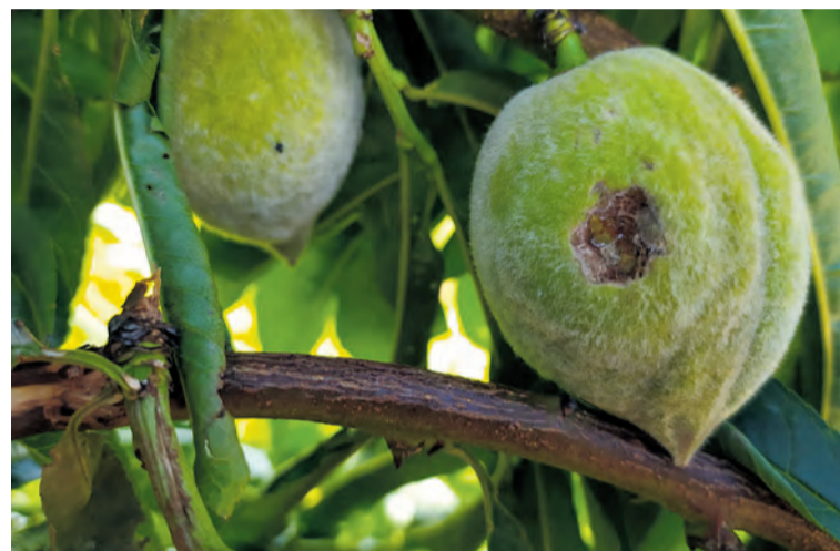
Aún los frutos menos dañados no servirán para su comercialización. NDM

de la fruta quedó picada; otra, directamente fue arrasada por la tormenta.