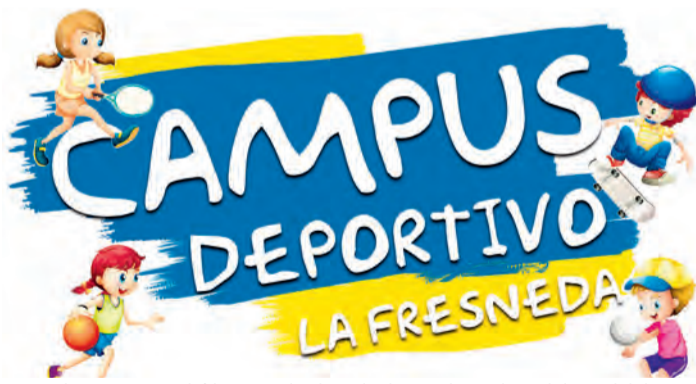
El campus tendrá lugar en las instalaciones deportivas del municipio. NDM

El equipo de gobierno liderado por Frederic Fontanet busca "volver a la normalidad después de tantos meses en casa". La propuesta deportiva está dirigida a dos grupos de edad. Por una parte, los más pequeños, nacidos entre 2014 y 2017, realizarán ejercicios de psicomotricidad. Por otro lado, el grupo de edad del campus deportivo comprenderá las edades de entre 6 y 14 años y se centrarán en todo tipo de deportes desde bádminton hasta fútbol. En total, hasta 20 niños podrán