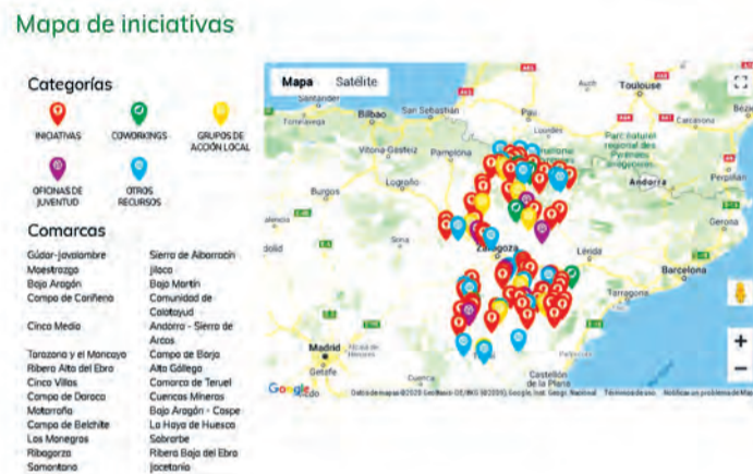
En el mapa se encuentran todos los emprendedores registrados por zonas. NDM

Entre las diferentes cosas que aporta "La Era", permite crear un espacio online para cada emprendedor , para que así pueda presentar el proyecto. Además, 'La Era' coloca, literalmente, en el mapa a los emprendedores a través de un plano interactivo de Aragón en el cual se encuentran todos los jóvenes clasificados por zonas. Además, mediante el foro de la plataforma se pueden conocer otros proyectos y personas, "a veces te sientes muy solo cuando emprendes", aseguró Omella. La Era Rural también ofrece formaciones online, becas y talleres.