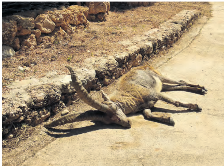
Un ejemplar infectado por sarna buscó refugio en el municipio de Peñarroya. NDM

Como medidas para frenar el contagio se intentó un tratamiento mediante pienso con paramectina , un antiparásito. No obstante, tal y como explicó el presidente de los cazadores, "No puedes controlar lo que va a comer un animal salvaje. Ni las autoridades competentes lo han respaldado, ni nosotros tampoco".