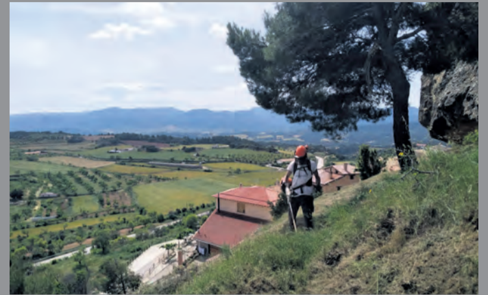
Los cuatro operarios han trabajado ya casi en todos los pueblos. NDM

Además, desde las agrupaciones de cazadores reclaman que así no tiene sentido mantener las tasas de los cotos . Hasta ahora, los propietarios ceden los terrenos y la sociedad de cazadores es la que gestiona y da una prestación económica a cada propietario en función de las hectáreas que aporta.