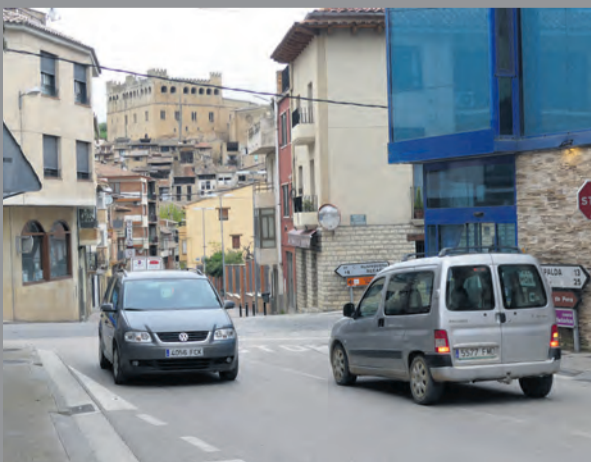
Los aragoneses ya pueden viajar entre las tres provincias. JP

Así pues, las medidas se han flexibilizado y a partir de ahora las competencias de regula-