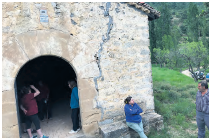
Las masías vecinas a la ermita se reunieron para analizar los desperfectos. JBL

El 21 de junio Peñarroya tenían prevista la celebración de San Lamberto, que finalmente ha sido cancelada.