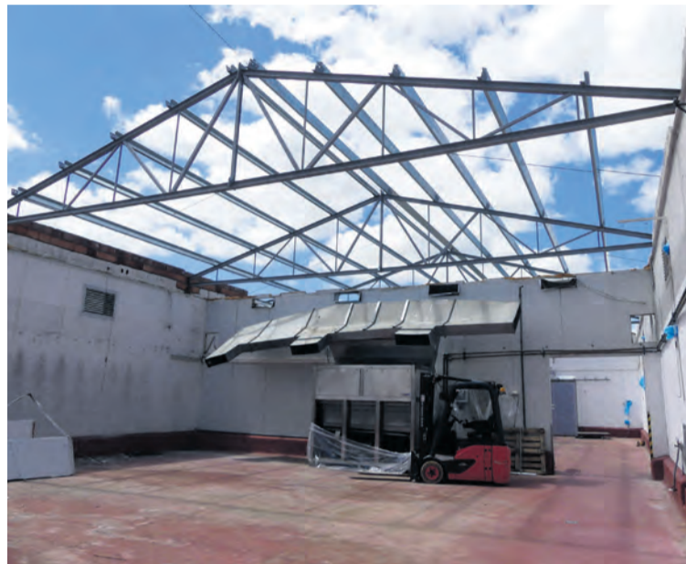
Zona de secado de la planta de Virgen de la Fuente. NDM