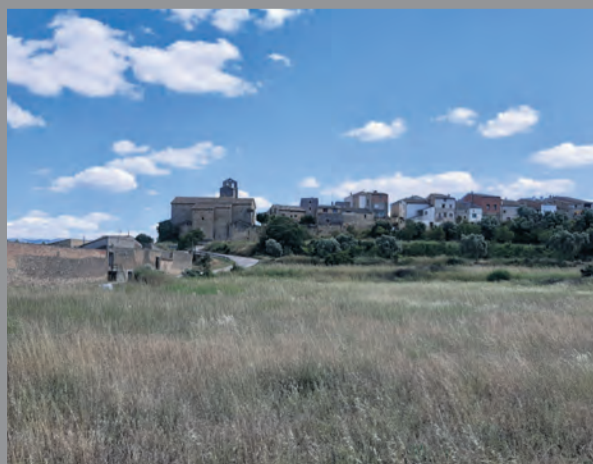
Arens visto desde la zona donde irá la piscina municipal. NDM

La piscina se situará en unos bancales que son propiedad del ayuntamiento y que se encuentran cerca de la iglesia. Aprovechando los elementos naturales del emplazamiento y los recursos de la tierra, se planteará una piscina recreativa con di-