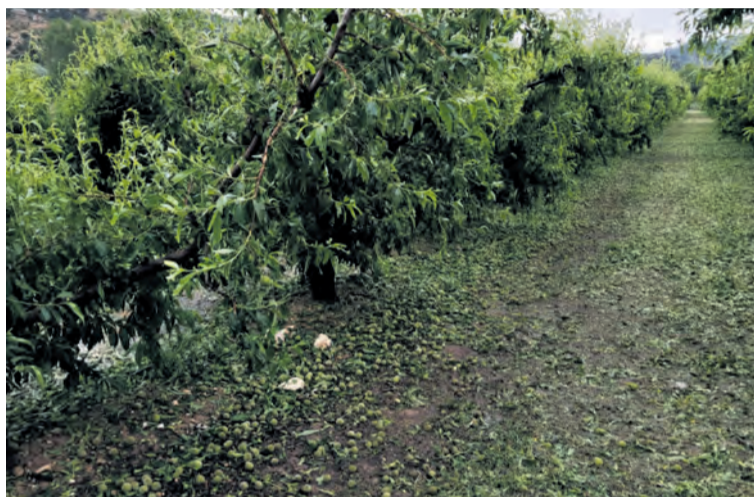
En algunas zonas la tormenta tiró al suelo gran parte de los frutos. NDM

En tan solo unas horas se registraron ráfagas de viento de hasta 116 km/h en puntos del norte del Matarraña como en Mazaleón, donde las cosechas han sido la principal pérdida para la huerta de la localidad. La economía de este municipio, que acumuló en apenas minutos 14.6 mm de agua en forma de lluvia y granizo, subsiste en gran parte gracias a las cosechas estivas del melocotón. Una cosecha que daba comienzo este mes de junio y que este año ha quedado mermada casi por completo. La precipitación en forma de granizo dejó a su paso decenas de frutos inaprovechables. Gran parte