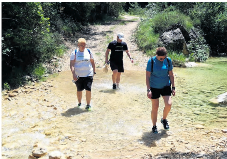
Los monitores deportivos recorren y mejoran la señalización de las rutas. NDM

El objetivo es que los senderos estén en un óptimo estado de cara a los próximos meses de verano en los que se espera una máxima afluencia de visitantes en los núcleos rurales alejados