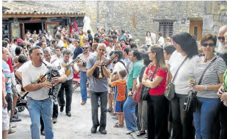
Lledó deberá esperar un año para ver en directo a la Ronda de Boltaña. NDM

Una jornada que se preveía de convivencia y con gran afluencia de público en el municipio, para la que se había