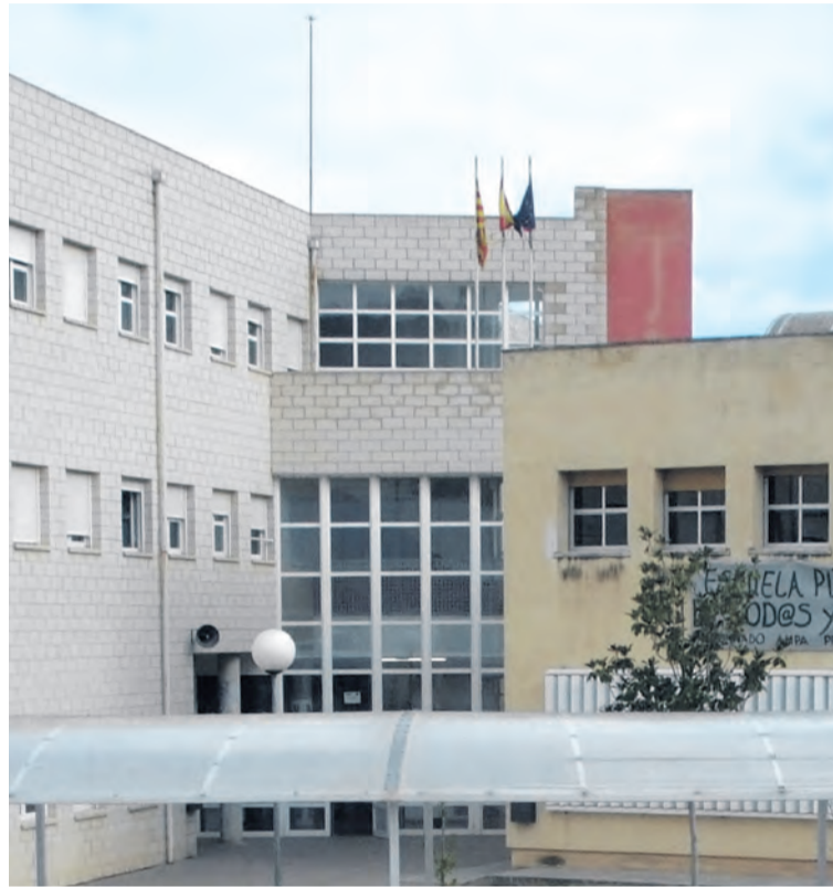
Algunos alumnos han podido acceder de nuevo a las instalaciones. NDM

El centro informó a los alumnos y familiares de la disponibilidad de docentes y personal para que puedan acudir con todas las