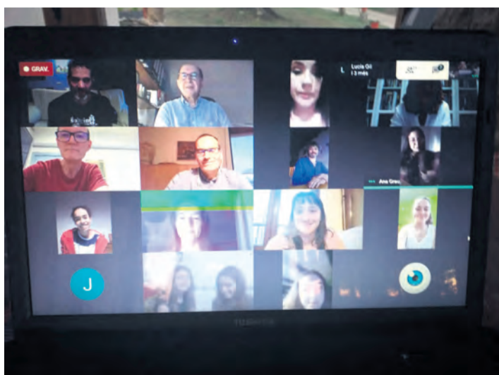
En la presentación de las obras participaron escritores y músicos. NDM

En el acto, los estudiantes presentaron sus creaciones, donde también par-