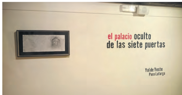
El museo Juan Cabré ha abierto con 'El palacio oculto de las siete puertas'. NDM

Después de la reciente la reapertura, se puede