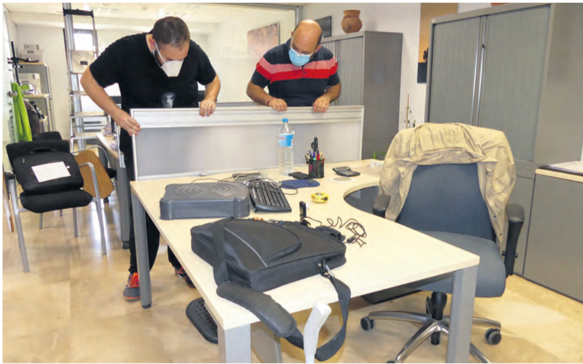
Siguiendo la normativa se han instalado mamparas de separación entre los diferentes puestos de trabajo. JP

Será necesario solicitar cita previa con antelación para poder acceder a los servicios y al centro comarcal