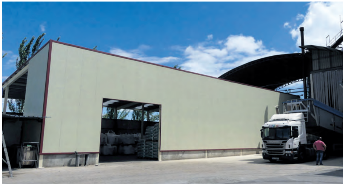
La reconstrucción del hangar de la fábrica de piensos de GUCO está prácticamente finalizada. NDM

El hangar de la fábrica de piensos de GUCO y parte del tejado de la planta de Virgen de la Fuente de Valderrobres fueron las infraestructuras que sufrieron daños más importantes durante el temporal