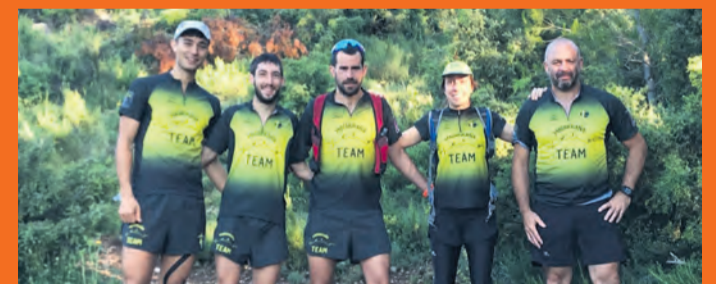
A pesar de la difícil situación, la agrupación sigue activa. NDM