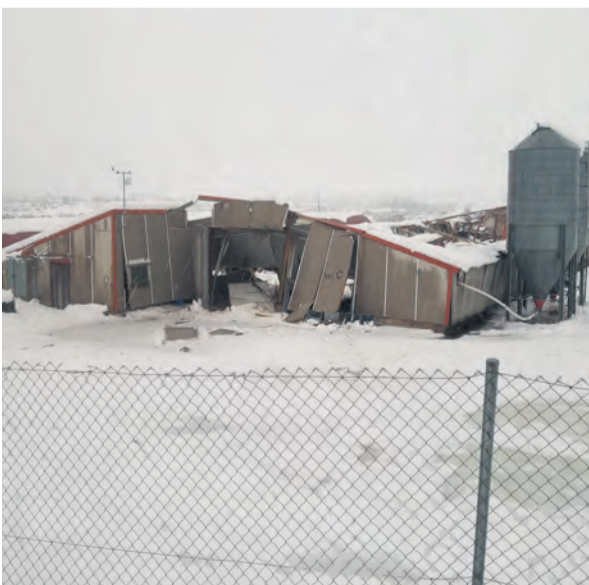
Los afectados pueden solicitar ayudas para paliar los daños. NDM

Finalmente, el pasado 26 de mayo el Ministerio de Agricultura, Pesca y Alimentación abrió el plazo de presentación de solicitudes a las subvenciones a explotaciones agrícolas y ganaderas afectadas por el temporal Gloria. Estas ayudas están catalogadas como medidas urgentes adoptadas por el Gobierno de España para paliar los daños causados por el temporal que la Comarca del Matarraña solicitó declararse como zona catastrófica.