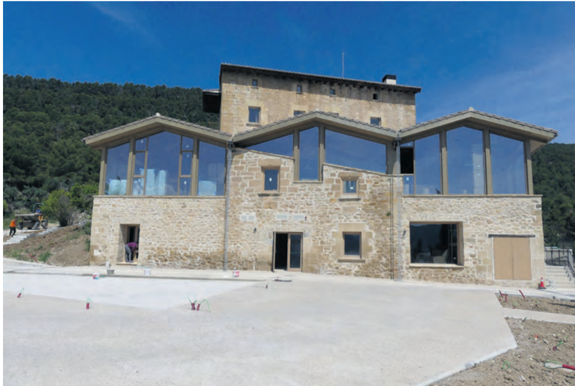
El establecimiento está trabajando en los últimos retoques para poder recibir en breve a sus primeros clientes.