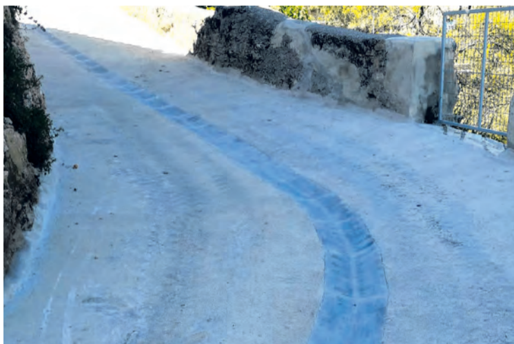
En la vía se ha mejorado el pavimento y se ha cambiado la instalación del agua. NDM

En concreto, la calle que se ha arreglado es una de las afueras, la Canterías . Unas obras que se han visto condicionadas por las últimas lluvias pero que ya se han podido finalizar. Las mejoras no sólo han rehecho el pavimento, sino que se