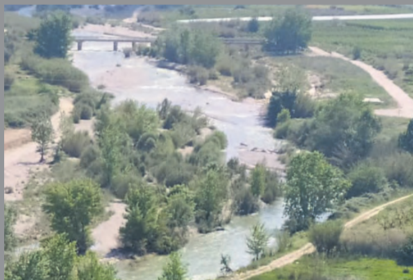
La lluvia ha hecho que los ríos tengan un gran caudal. NDM

En este sentido, el embalse de Pena se encuentra al 95% de su capacidad total , superando de esta manera con creces la media de los últimos 10 años, situada en un 70% de la capacidad. Solo durante el pasado 4 de junio los pluviómetros de esta estación meteorológica recogieron más de 50 l/m2, la cifra más alta después de la tormenta Gloria que superó los