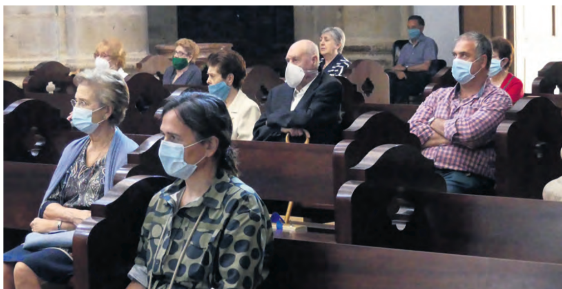
Durante la celebración se siguieron estrictamente todas las medidas de seguridad exigidas por las autoridades. JP