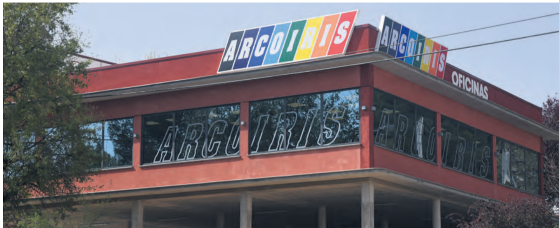
El Grupo Arcoiris es uno de los impulsores de las 'Becas Jóvenes Universitarios Teruel'. JP

Además, estas becas se complementarán con la posibilidad de realizar prácti-