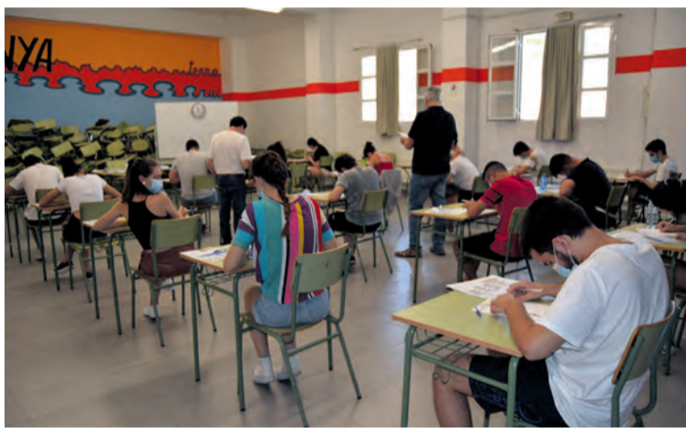
Los alumnos hicieron los exámenes con sus respectivas mascarillas.

Aunque un mes más tarde de lo habitual, las pruebas de acceso a la universidad han llegado para los alumnos del IES Matarranya. Durante los días 7, 8 y 9 de julio los estudiantes de segundo de bachillerato del centro educativo llevaron a cabo una de las pruebas más importantes de su trayectoria académica y que este año, por primera vez, se realizaron en el centro de Valderrobres y no hubieron de desplazarse hasta Alcañiz.