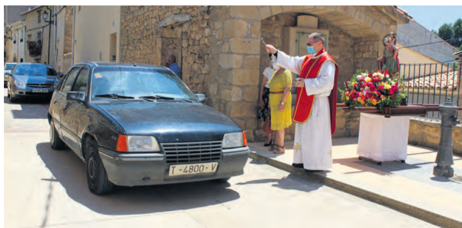
La imagen del santo presidió la bendición de vehículos en Valdeltormo.