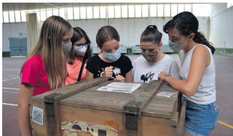
Un grupo de jóvenes disfrutó de una tarde diferente jugando a un escape room. MJG

también diferentes actividades, como una ruta senderista con yincana en Valjunquera o una excursión al pantano de Pena complementada con kayak.