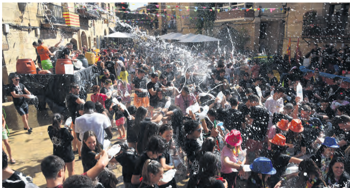
Las fiestas mayores de La Fresneda se han suspendido debido a la emergencia sanitaria generada por el COVID-19.

El total monetario ha sufrido ya varias readaptaciones y remodelaciones. De hecho, “las partidas de gasto de mantenimiento municipal han subido debido al temporal gloria y a la adaptación con productos de protección contra el COVID-19” , aseguró Fontanet. Por el contrario,