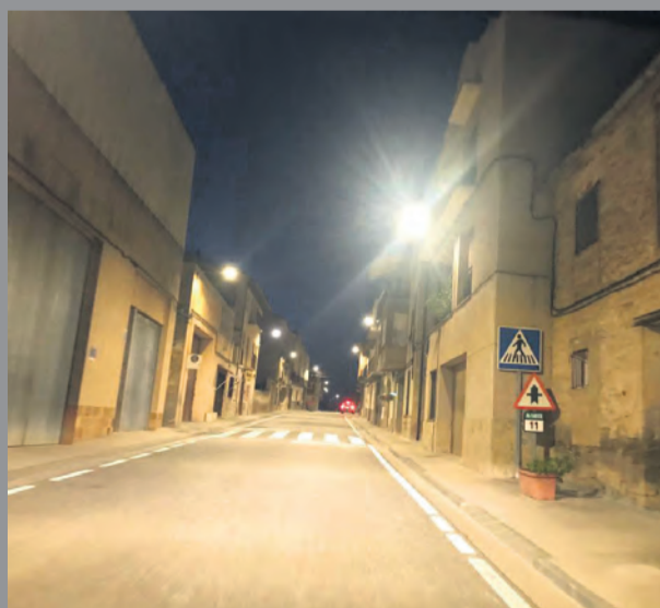
Los trabajos de mejora durarán unos 15 días. NDM

una cuarta parte de lo que consumen las lámparas tradicionales.