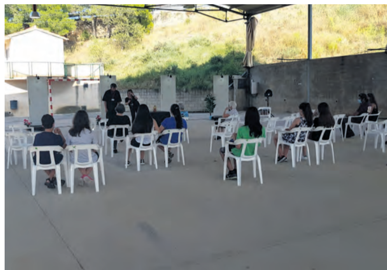
El primer acto se desarrolló en el polideportivo de Arens de Lledó.

'De puertas para adentro' es un proyecto creativo y didáctico que invita a la reflexión personal basada en la experiencia. Es una actividad promovida por el Proyecto Caravana y Marta Enguix, e inicia con una exposición de Enguix