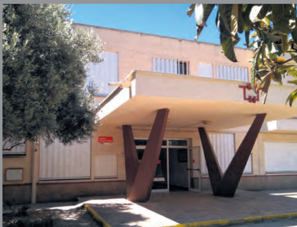
La enseñanza se desarrolla en el edificio Cardenal Ram. NDM

Hasta ahora en toda la comunidad el nivel más alto para cursar el catalán era el C1. Una formación que también se imparte en el centro de Alcañiz y que además cuenta con una gran demanda, ya que en el pasado curso 2019-2020 tenía todas las plazas completas . Tal como explicó la directora: "tenemos muchos alumnos que ya conocen