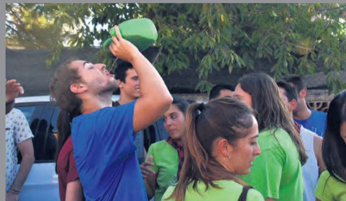
Este año no tendrá lugar el tradicional y divertido 'Barralet'. NDM

Aunque los hechos ocurrieron a principio de julio y el Ayuntamiento prefirió que el asunto no trascendiese para no alarmar a la población, ahora la corporación ha decidido denunciar socialmente el suceso. "Lo más lógico sería que se reconociesen los hechos ante el Ayuntamiento. Nuestro objetivo no es que nadie vaya a prisión".