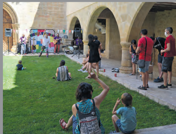
Los más pequeños disfrutaron de una actuación musical. NDM