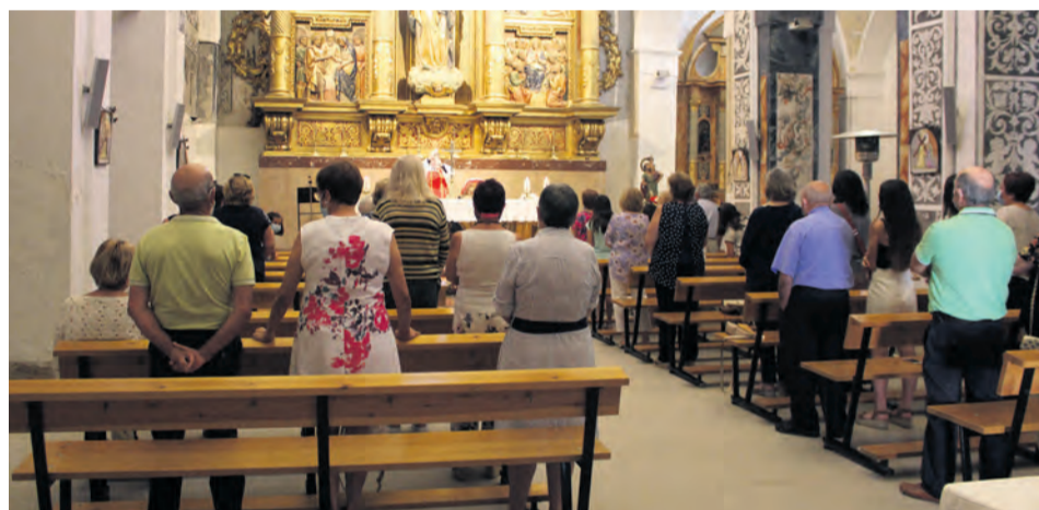
Las eucaristías se celebraron siguiendo todas las medidas de seguridad. PVS