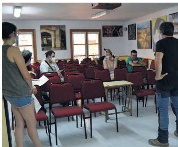
El Ayuntamiento hizo una reunión con los interesados. MJG

En estos momentos, la localidad cuenta con un buen número de recién nacidos y niños que no disponen de servicio de guardería. Una recuperación de la demografía de la localidad después de un periodo de baja natalidad. "Hacia muchos años que no había tantos niños de estas edades. Se han quedado jóvenes en el pueblo y también ha venido gente