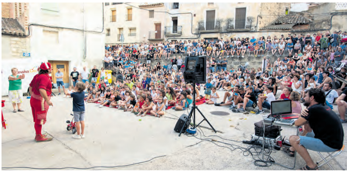
Las calles de Mazaleón tendrán que esperar un año para volver a ser el escenario de los espectáculos de 'La Nit en Blanc'. NDM

La crisis del COVID hizo que la organización decidiera hace unas semanas que este año no se haría ningún tipo de acto