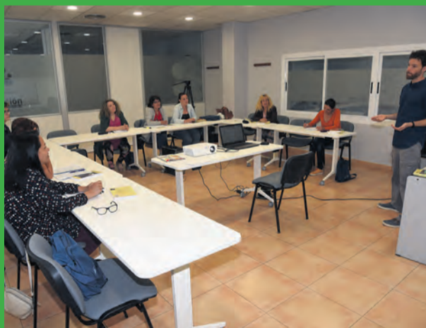
Arcoiris recuperará en breve los cursos de formación. NDM

La formación, siguiendo la programación del curso anterior que ya se impartió desde la empresa, se compondrá de módulos teóricos y prácticos que albergan también las visitas a empresas alimentarias de la zona. En la primera edición del curso, los alumnos visitaron empresas dedicadas a la producción de frutos secos y otras materias primas de la zona. Además, los alumnos dedicarán al menos 40 horas al desa-