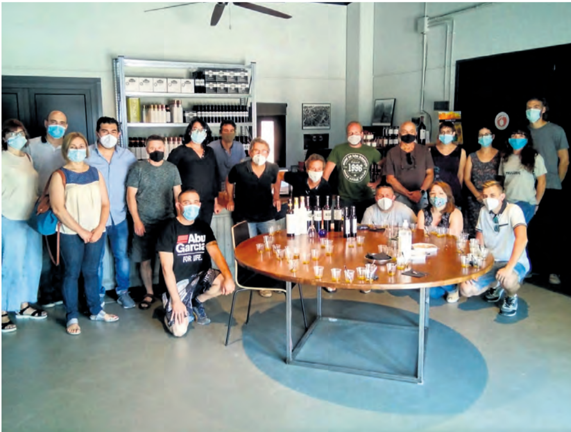
El pasado 30 de junio se realizó un encuentro en el que los promotores explicaron las bases del proyecto. NDM

El proyecto ofrecerá catas y degustaciones a través de empresas de turismo activo y pretende aumentar la variedad del producto en las cartas de restauración en el Matarraña