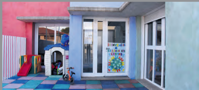
Los interesados ya pueden inscribirse para el curso 2020-2021.