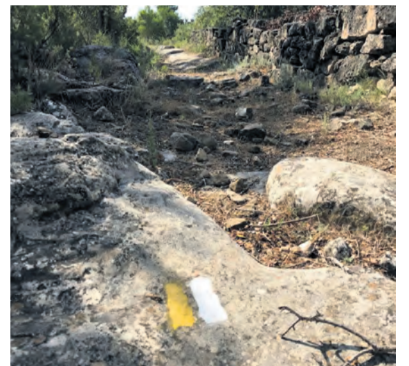
Es fácil seguir el recorrido a través de las marcas. NDM

ara més que mai disfruta del territori en responsabilitat