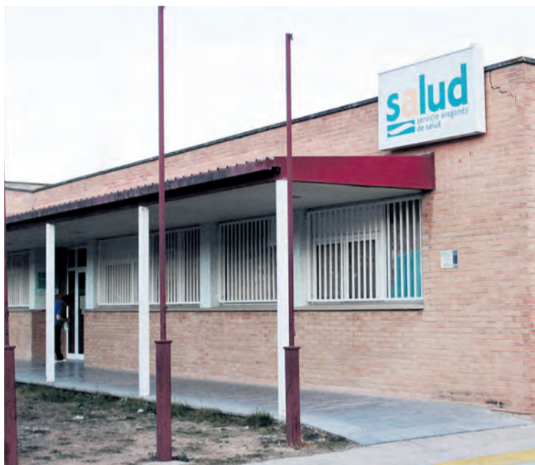
Fuentespalda y Valderrobres serían los municipios más afectados. NDM

seguridad, "tenemos que ser conscientes que entre el blanco y el negro hay una escala de grises, por la seguridad nuestra, de nuestras familias y amigos tenemos que intentar respetar estas medidas de prevención de la mejor forma posible para evitar rebrotes", explicó Ferrer. Por ello, algunas localidades como Fuentespalda o Ráfales desde el pasado sábado 11 de julio se adelantaron a la medida autonómica y a través de un decreto de alcaldía hicieron la mascarilla de uso obligatorio en las localidades. La ordenanza en ambos municipios clama: "La detección de varios brotes y el incremento de nuevos casos correspondientes a personas asintomáticas obliga a reforzar