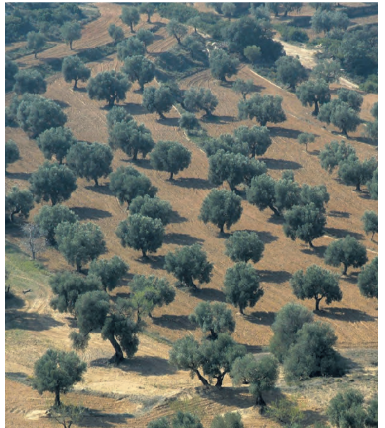
Los olivos forman parte la belleza paisajística del Matarraña. NDM