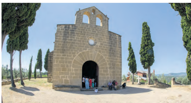
La pista se construirá en la zona de la ermita de San Juan. NDM

La respuesta fue positiva. Los vecinos de Torre del Compte aceptaron la propuesta del Ayuntamiento, que en breves comenzará con la construcción y adaptación de la pista . "Forma parte de un proyecto mayor que se está llevando a cabo a pesar de la falta de apoyo económico y que habilitará un espacio de gimnasia para