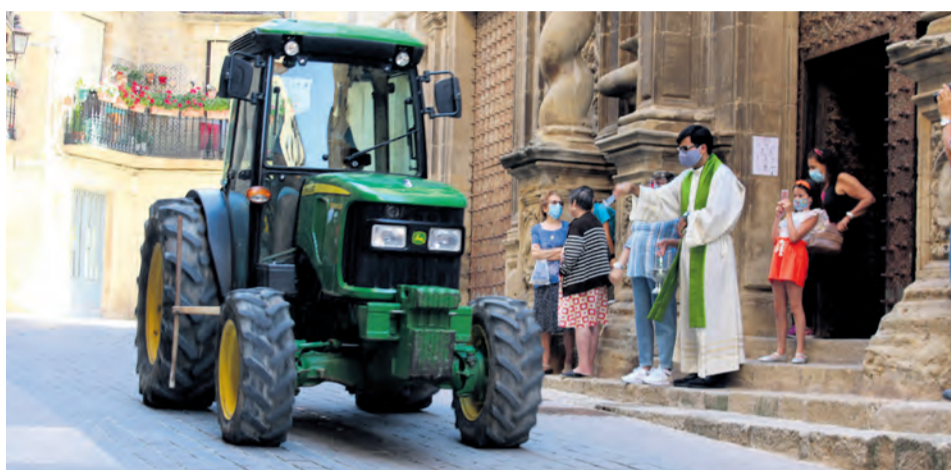
Los conductores no faltaron a la bendición de vehículos que se celebró en Calaceite. PVS