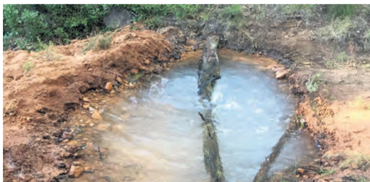
Por el agujero de la tubería manaba una gran cantidad de agua.