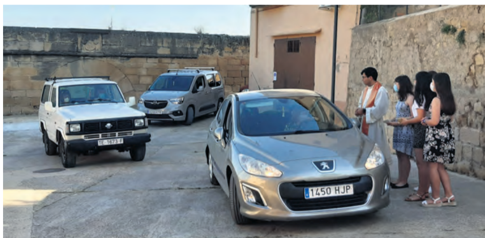
En Arens de Lledó también tuvo lugar la tradicional bendición de vehículos. NDM