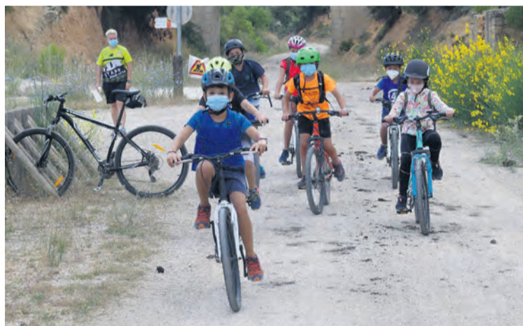
Diez niños y niñas recorrieron la vía verde desde Cretas a Horta de Sant Joan. JP

Para las dos últimas semanas de julio han programado