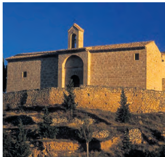
La ermita de Sant Pol es el final de la ruta.

Finalmente se debe ir equipado con abundante agua puesto que no hay ninguna fuente en todo el tramo que vamos a realizar.