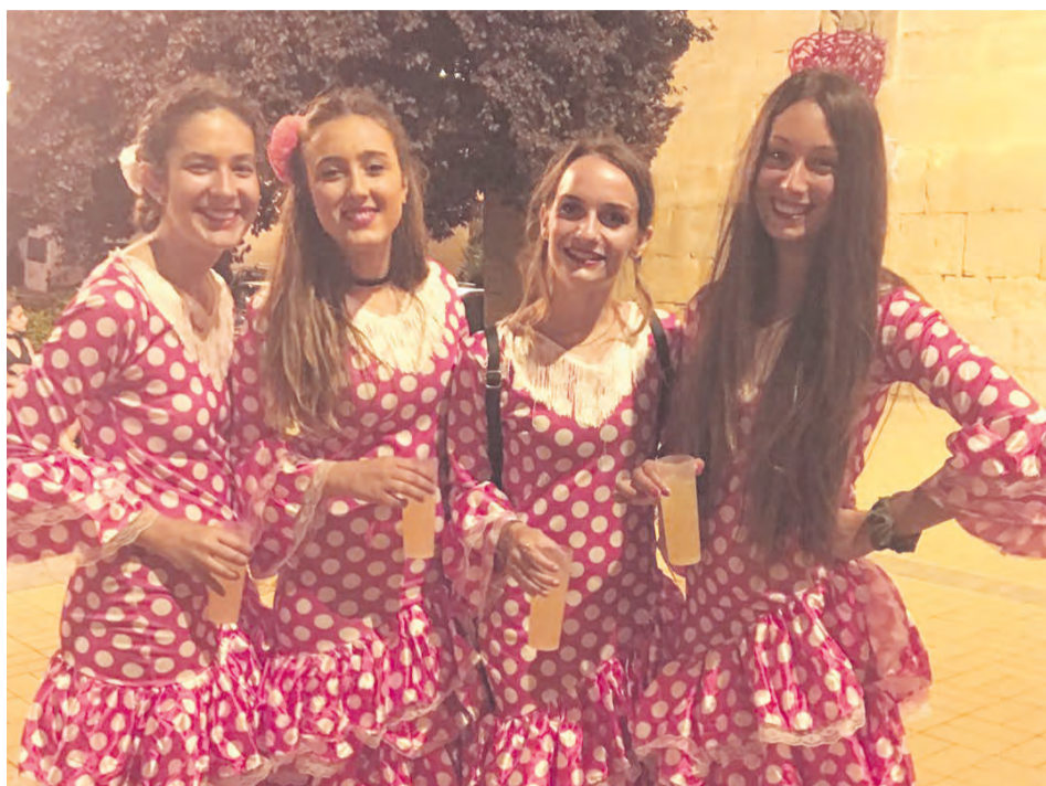
Las peñas son las protagonistas de la reactivación de la Asociación Cultural de La Portellada.