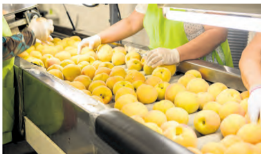
Esta campaña está siendo complicada. NDM

Un 50% de la cosecha se calcula que se perdió el pasado 3 de junio cuando una gran granizada registró en partes del término municipal de Mazaleón ráfagas de viento de hasta 116 km/h. "Se ha notado la falta de kilos de fruta", aseguró la gerente, "algunos agricultores creían no haber sido afectados, pero se han dado cuenta de que sí que les afectará". Un 20% de la fruta recogida durante esta campaña se ha destinado al destrío, que restado al 50% de pérdidas por la precipitación, ha producido tan solo un 30%