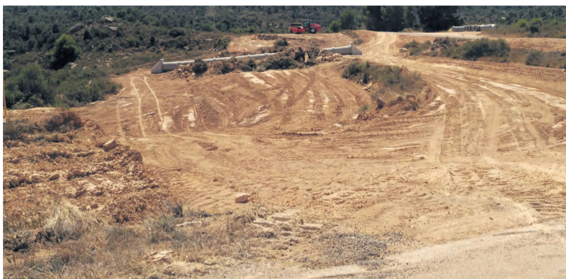
Las obras de la A-1412 avanzan muy rápidamente y se espera que la vía esté finalizada en tan sólo unos meses. NDM

El tramo ya se ha cerrado al tráfico quedando solamente abierto al paso para viajes por causas justificadas