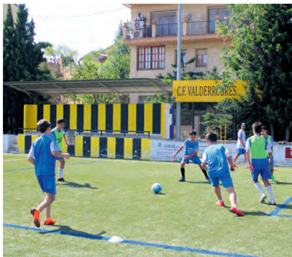
Los jugadores sólo podrán entrenar durante esta temporada. NDM

La escuela afirmó que con la decisión pretende no poner en riesgo a los integrantes de los equipos ni a sus círculos familiares ni amistosos. "Tras tomar esta difícil decisión, creemos que ahora mismo es lo mejor para no poner en riesgo a ningún jugador, así