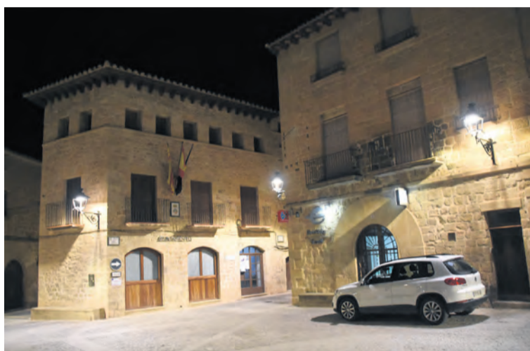
La plaza de Cretas ya se ilumina con las nuevas luminarias LED. NDM

Las nuevas luminarias no afectarán estéticamente al centro histórico del municipio gracias a la conservación de lámparas de forja a las que se les han retirado las mamparas de cristal para ofrecer una mayor calidad. En otras zonas de la localidad, como en el tramo de la A-1413 que une Calaceite con Valderrobres se ha optado por farolas. En total, el cambio ha supuesto una inversión de casi 250.000 euros, de los que la