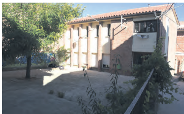
En Ráfales las clases se dan en el ayuntamiento. JP

Los desperfectos se arreglarán a partir de las próximas semanas. "Ya que hemos tenido tanto tiempo des-