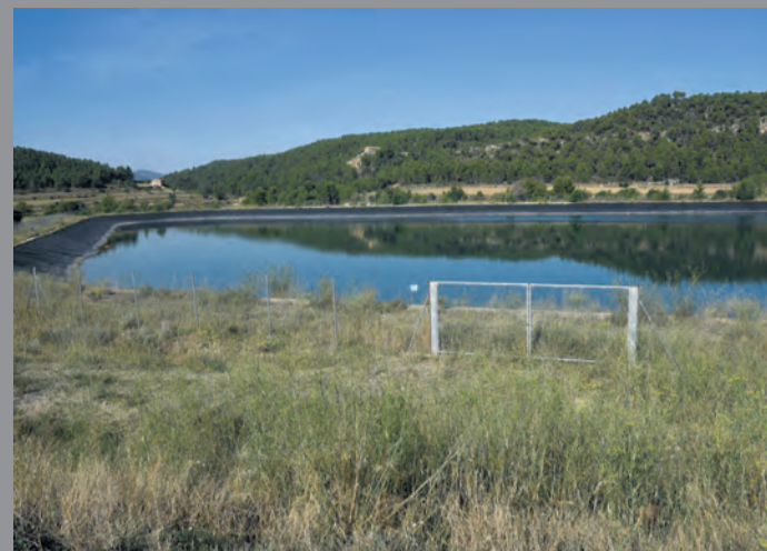
En el plan se están georreferenciando las balsas antiincendios.