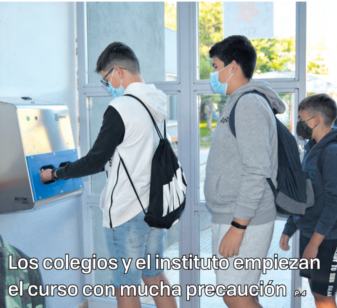
Los colegios y el instituto empiezan el curso con mucha precaución P.4

Todos los centros educativos están aplicando de forma muy estricta las medidas establecidas. MJG