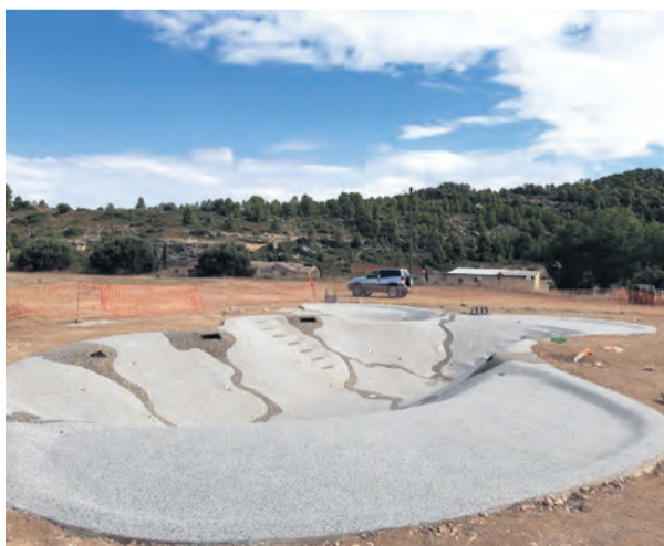
Las obras de la piscina avanzan rápidamente.

Después de varios meses de ejecución de obras, ya han finalizado los primeros trabajos de impermeabilización y creación del vaso de la piscina, para lo que se han utilizado los materiales del terreno. Además, la piscina contará con una zona de hidroterapia y posteriormente