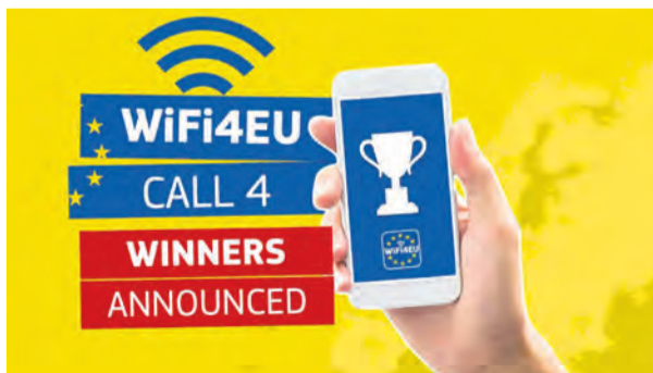
La UE subvencionará esta iniciativa en 3 municipios de la zona.