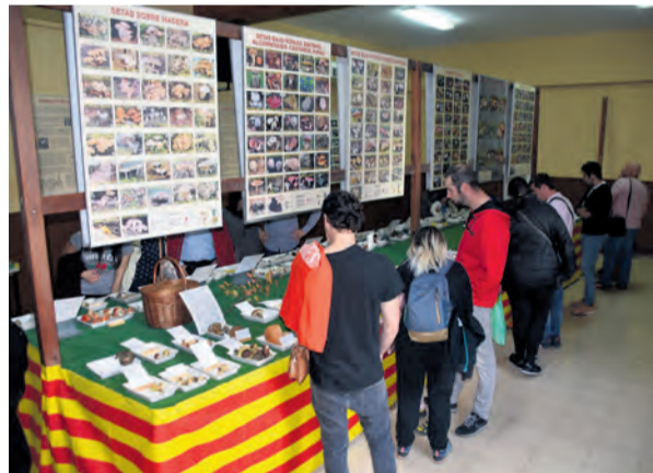
Este año no se podrá disfrutar de las setas en Beceite. NDM

Beceite y su feria se unen así a la larga lista de actividades y eventos cancelados como consecuencia de la pandemia de la COVID-19, que ha obligado a los organizadores a suspender una de