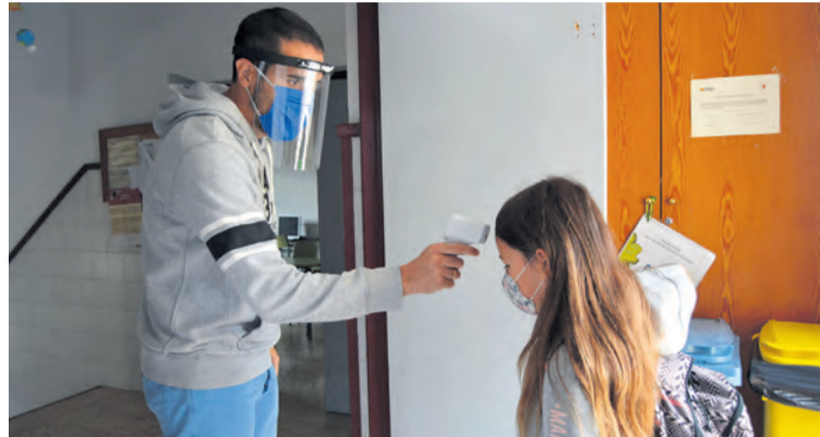
Los alumnos siguen unas medidas de seguridad extremas. MJG

Para el nuevo curso los centros han tenido que adaptar el proyecto educativo a la nueva realidad, teniendo en cuenta que el curso pasado quedó truncado por la pandemia y que parte de los contenidos no se pudieron dar. "Ahora no recuperaremos lo que no se dio, pero sí intentaremos que se lleguen a unos mínimos. En Primaria los contenidos son muy repetitivos y se amplían a cada