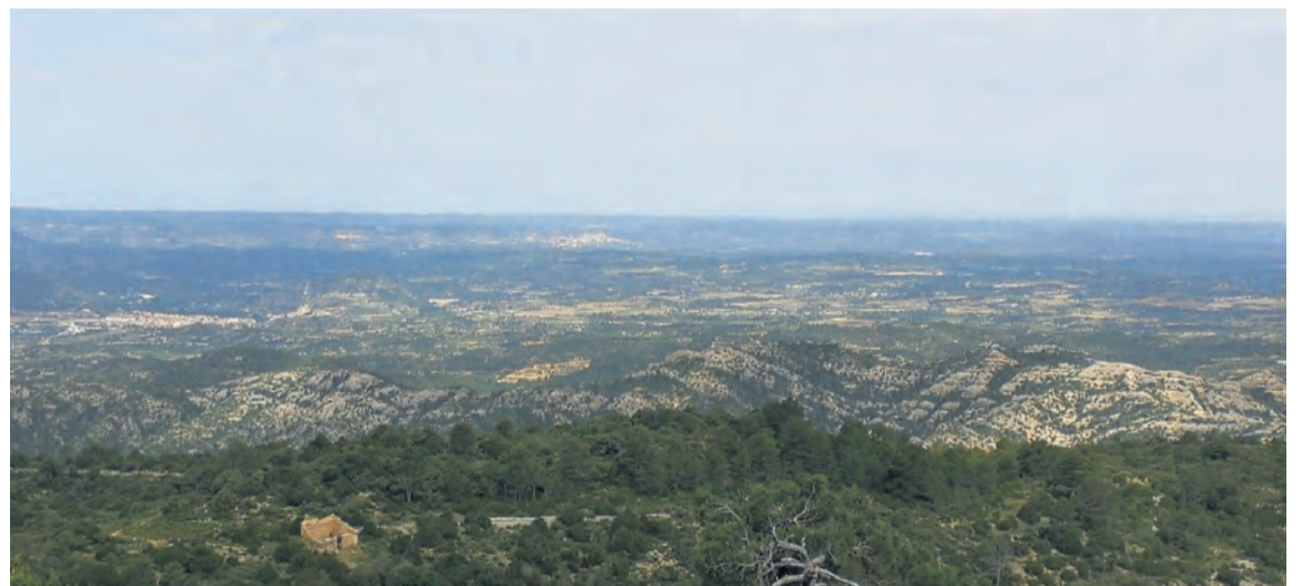
La ruta permite disfrutar de unas monumentales vistas de los paisajes de la comarca del Matarranya. NDM

Para desarrollar esta ruta es importante ir bien equipado, tener una buena forma física y llevar agua suficiente, no es una excursión apta para hacer en familia o para aquellos nada experimentados . Además, se debe tener mucha precaución y asegurarse que la meteorología será la adecuada para disfrutar de la ruta.