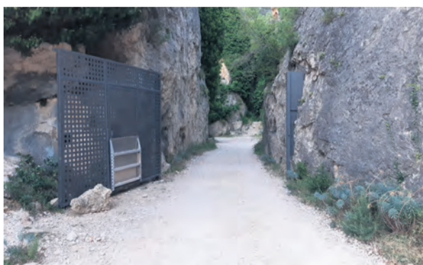
La polémica puerta del Parrizal ya ha sido retirada. NDM

El Área de Control del Dominio Público Hidráulico redactó a 19 de junio un informe técnico de carácter desfavorable entendiendo que la puerta