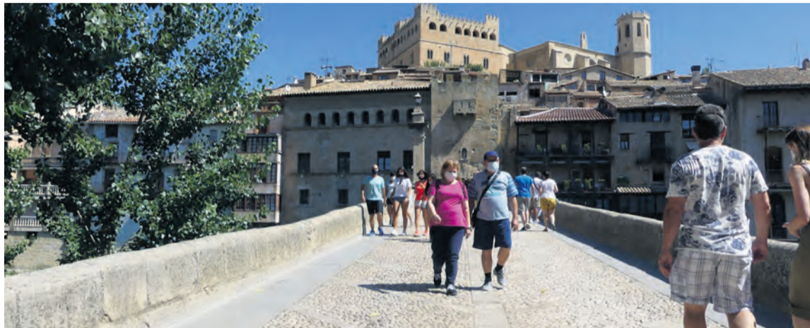
El verano ha sido mucho mejor de lo que se esperaba tanto en ocupación como en número de visitantes. JP

En contra de todo pronóstico, "el balance ha sido positivo, mucho más de lo que nos espe-