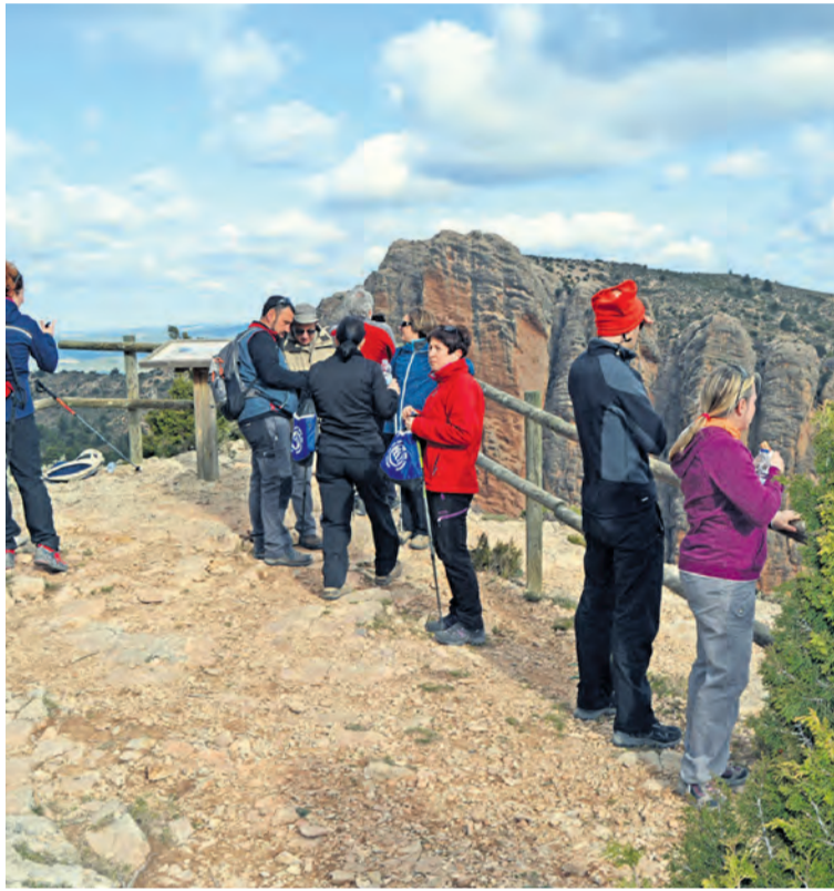
Peñarroya acogerá una salida senderista el próximo 20 de septiembre. NDM

Otras tres localidades acogerán dos torneos por parejas de tenis y frontenis.