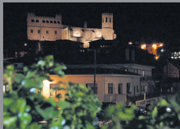
En breve las luminarias de Valderrobres serán de tecnología LED. NDM