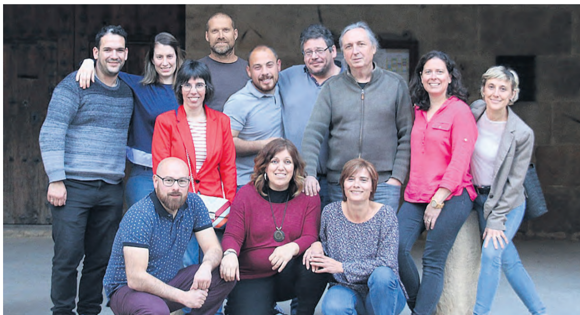
Los 4 concejales socialistas han decidido dimitir de sus responsabilidades de gobierno en el Ayuntamiento de Calaceite. NDM

"Desde un inicio dijimos que no queríamos seguir el camino que había sido habitual durante las últimas legislaturas, tapan-