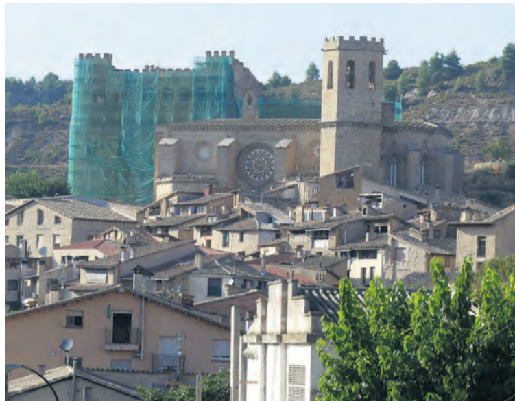
Los andamios aún ocupan gran parte de la fachada del Castillo. JP

Por otra parte, se ha podido concretar el emplazamiento de la 'Sala Dorada' , tal y como aparece mencionada en la documentación. Se trataría de una sala noble que también