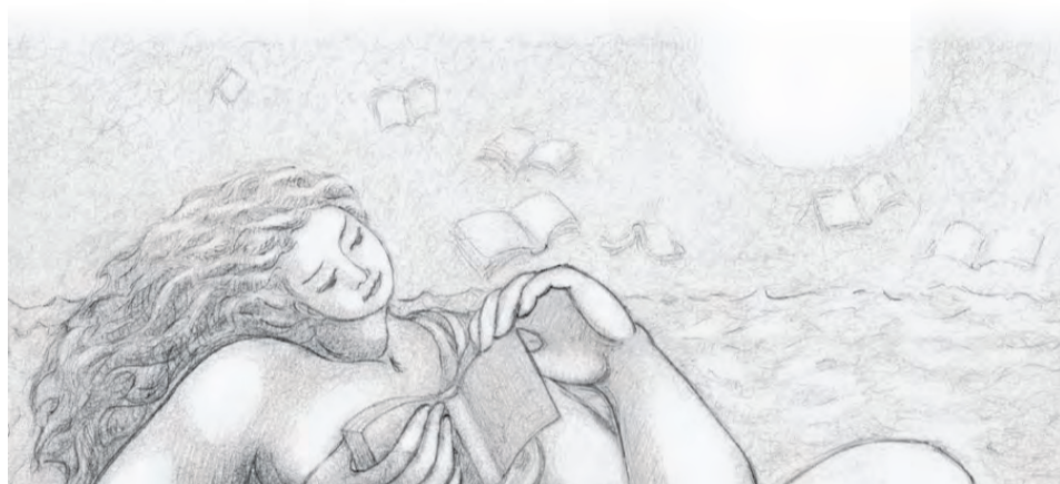
La nueva publicación recoge 30 poemas del autor de Peñarroya ordenados cronológicamente.