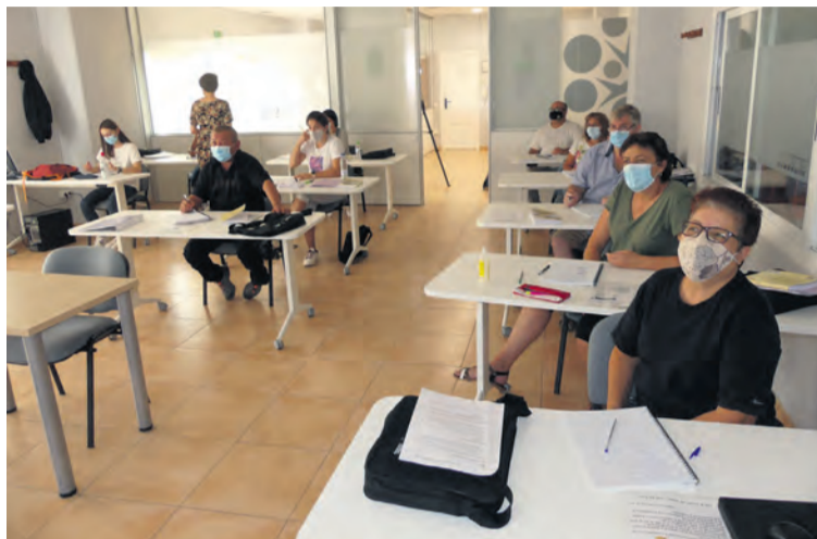
Los alumnos están desarrollando su formación de forma presencial. JP

El desarrollo del curso se realizará hasta finales de noviembre con una formación teórico-práctica que habrá de completarse posteriormente con las prácticas profesionales no laborables en cualquier