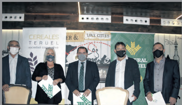
Representantes de todas las entidades presentaron la Beca. NDM