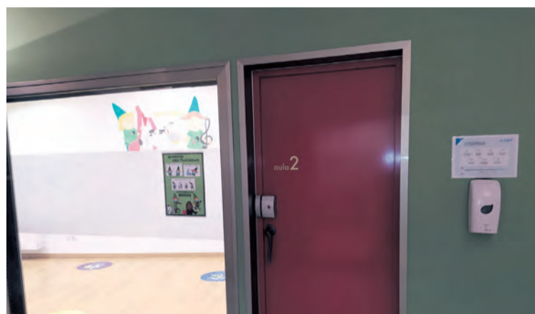
Las escuelas han implantado todas las medidas de seguridad.