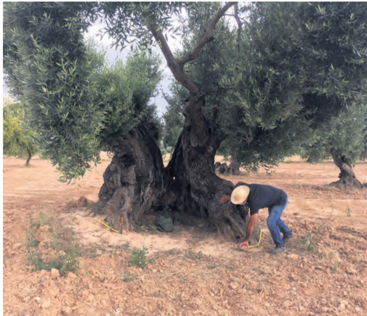
Los trabajos de identificación se han desarrollado en diversas fases. NDM

Para la catalogación, ha sido indispensable la aportación de vecinos que conocían la ubicación de estos árboles singulares y que finalmente han podido ca-