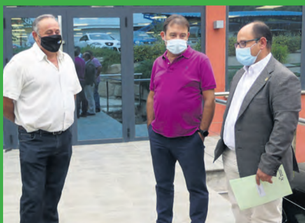
Izquierdo conoció las instalaciones de primera mano. JP

El vicepresidente aprovechó la oportunidad para destacar el papel fundamental del Grupo Arcoiris para la comarca del Matarraña al que definió como “un gran proyecto territorial, un ejemplo a seguir en el sector agroalimentario”