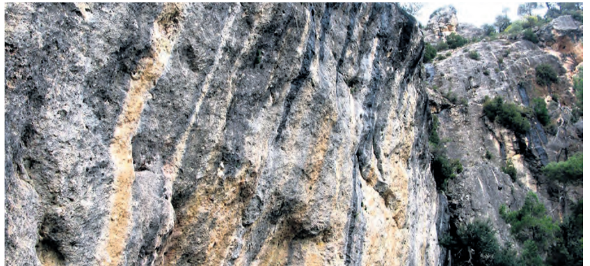
Grandes paredes de roca rodean al camino al recorrer la zona de los 'Estrets' de Ráfales. NDM

Cabe destacar que se debe ir bien equipado y con reservas de agua, puesto que la única fuente del recorrido se encuentra en el municipio de Ráfales.