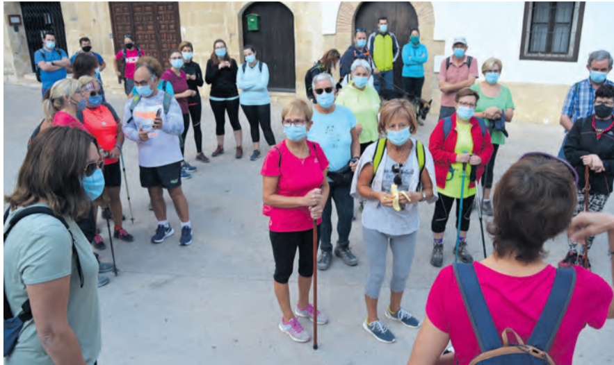
Los senderistas salieron de la plaza de Peñarroya de Tastavins. MJG