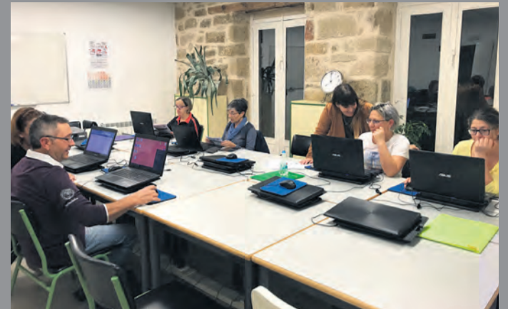
DPT quiere ayudar al mantenimiento de este tipo de centros.