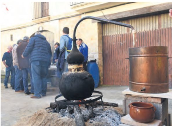
Ni Ráfales ni Monroyo celebrarán sus respectivas ferias. NDM

Ráfales, después de que Beceite lo hiciese las pasadas semanas, ya ha confirmado la cancelación del evento. La histórica Feria de Ráfales, que celebraba este año su XXVI edición, se ha suspendido definitivamente como prevención ante la pandemia. La feria celebró hasta su 25 aniversario de forma ininterrumpida de manera anual y este año será la primera vez que no se celebre.