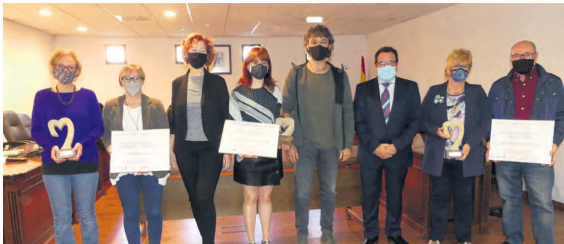
El acto se cerró con una fotografía de grupo con los premiados y los organizadores del evento. JP

ron sorteados en Ràdio Matarraña (107.7 fm) los 78 regalos aportados por las empresas participantes en esta campaña. La lista de los premios se puede encontrar en la página