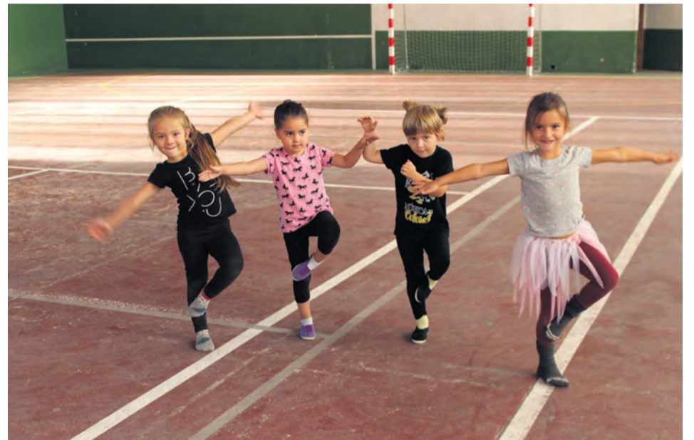
Unos 322 niños y niñas y un total de 339 adultos se han inscrito en las actividades. NDM