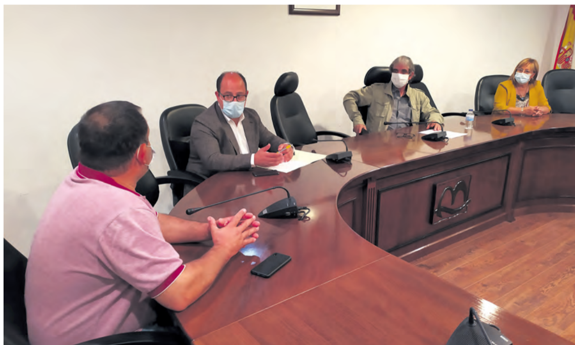
El vicepresidente de la Diputación Provincial de Teruel mostró su apoyo a las alegaciones interpuestas por la Comarca.