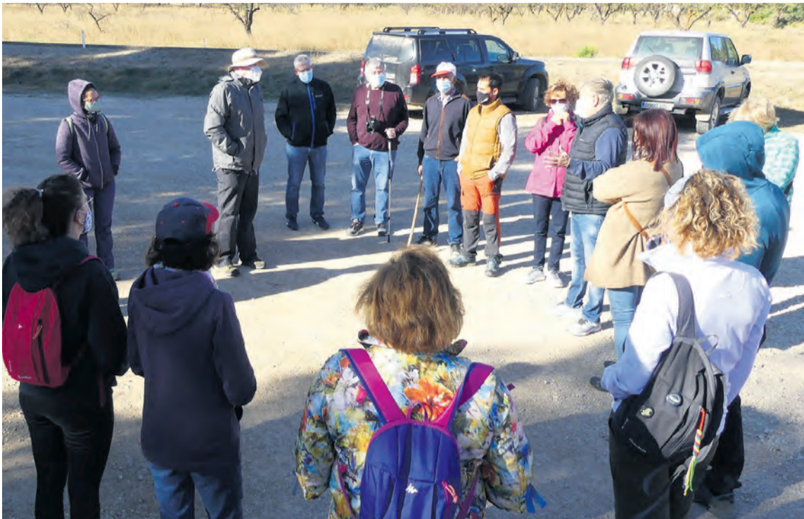
Los alcaldes de Cretas, Arens de Lledó y Lledó participaron en la actividad enmarcada en la campaña ¡Iberízate!. JP