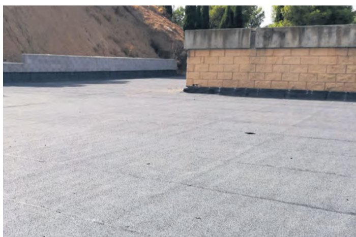
La inversión en la rehabilitación ha sido de un total de 13.000 euros. NDM

Entre las actuaciones causadas por esta borrasca está la del depósito municipal de agua de Calaceite que se vio dañado en la cubierta. El depósito sufría filtraciones debido a los desprendimientos de una ladera contigua y a la antigüedad de los materiales que se usaron durante su construcción hace varios años. En consecuencia, el Ayuntamiento ha instalado ahora una nueva impermeabilización con nuevos materiales