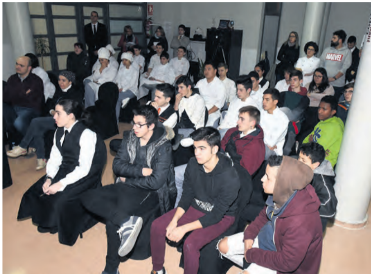
Este año habrá alumnos que ya trabajan en establecimientos de la zona. NDM

Como novedad, los alumnos, que son empresarios o trabajadores de la zona, acudirán a clases específicas y magistrales que generen in-