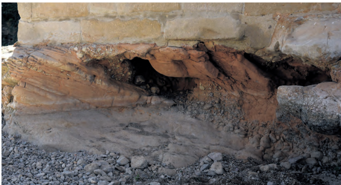
Hace un año se descubrió un importante agujero en la base del puente de piedra. NDM

El Consistorio llegó a un acuerdo con la Confederación Hidrográfica del Ebro