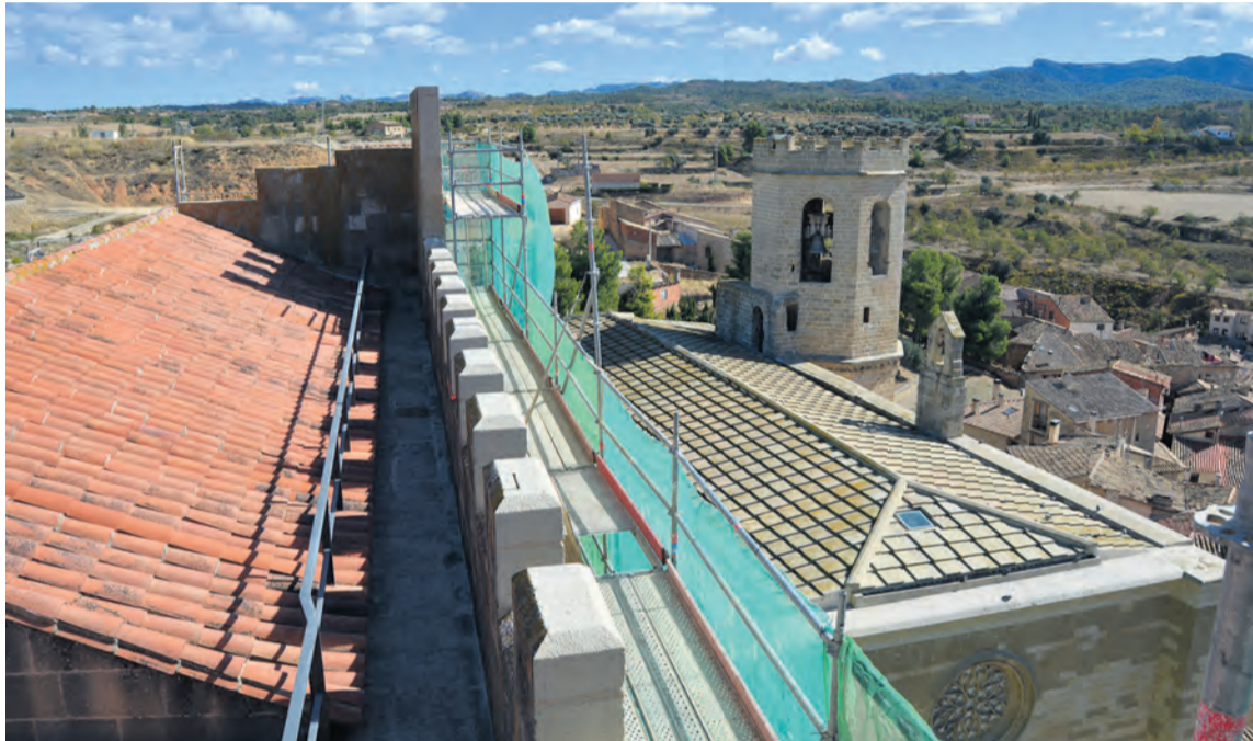
En el proceso de restauración se está trabajando en diferentes espacios del castillo de forma simultánea. MJG

El proceso de restauración actual está actuando en varios espacios de manera simultánea. Además de en las fachadas, se está realizando la instalación eléctrica y la recuperación de las partes derruidas del edificio. Estas actuaciones se enmarcan en la última fase de mejoras en la restauración contemplada en el Plan Director. En este último