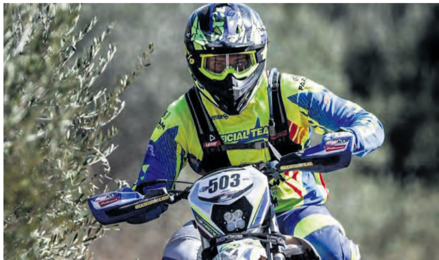
Guimerá sigue cosechando buenos resultados en el mundo del Enduro. NDM