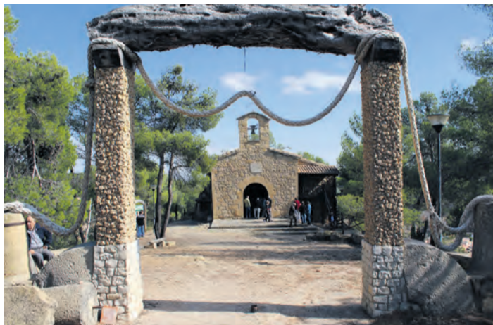
La Portellada quiere descubrir fotográficamente sus lugares ocultos. PVS

Entre las primeras propuestas de la nueva junta estuvo la de crear un Concurso Fotográfico de La Portellada que ya se ha presentado oficialmente. Un mes de plazo de presentación tendrán los interesados en capturar lugares ocultos o poco conocidos de la localidad, la temática escogida para este año, y que podrán formalizar hasta el próximo 25 de octubre . "La Portellada es mucho más que El Salt y queremos que se refleje el patrimonio desconocido",