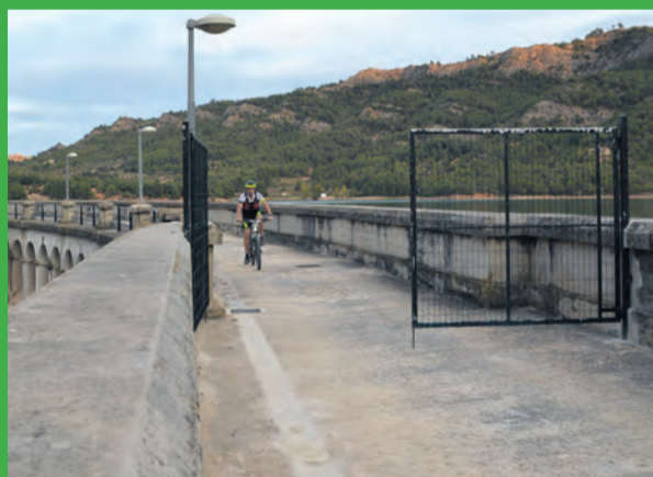
La presa del Pantano de Pena ya es transitable. JBL

Finalmente, el primer fin de semana de octubre la CHE decidió abrir la segunda de las puertas, permitiendo de este modo cruzar de lado a lado de la presa de forma directa . Tal y como han explicado desde la propia organización a este medio, la decisión de la apertura se debe a las peticiones de diferentes usuarios para que hubiera continuidad en el recorrido y