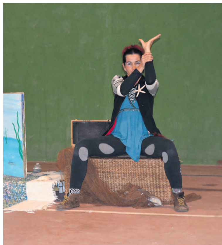
El acto terminó con una actuación infantil a cargo de Poika Teatral. MJG