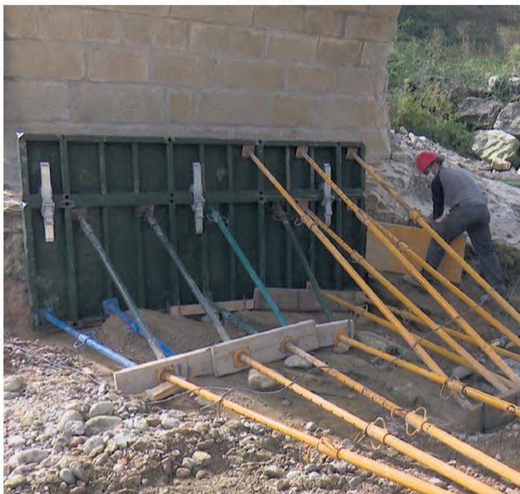
Los trabajos de rehabilitación han durado poco más de una semana. NDM

Los trabajos finalizarán cubriendo de nuevo la zanja que