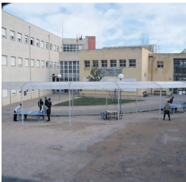
Los 21 alumnos de 2º estarán todos los días en el centro. NDM

Hasta el momento los grupos de este nivel acudían al centro de manera alternada, separando a los alumnos en dos modalidades, online y presencial, que alternaban