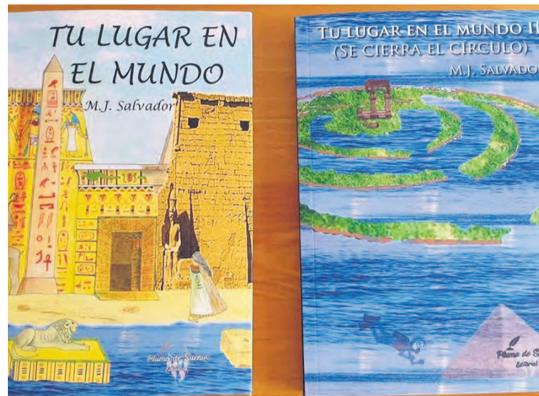
La vida, la muerte, el amor y el dolor se dan la mano en esta bilogía.

'Tu lugar en el mundo' es la historia de una joven española que cumple su sueño de viajar a Egipto. Bajo el nombre de Sara Sagui, la protagonista descubre que ella misma no es la persona que pensaba y no solo eso, sino que en un momento determinado de la novela la protagonista se transporta al Antiguo Egipto. Una tierra en la que le ocurren