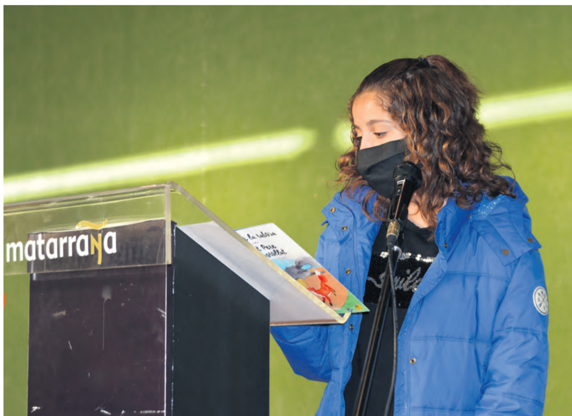
Los cuentos publicados fueron escogidos de entre los ganadores del concurso "Qüento va, Qüento vingue". MJG