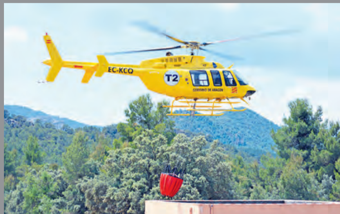
Este verano no se ha producido ningún incendio de envergadura. NDM