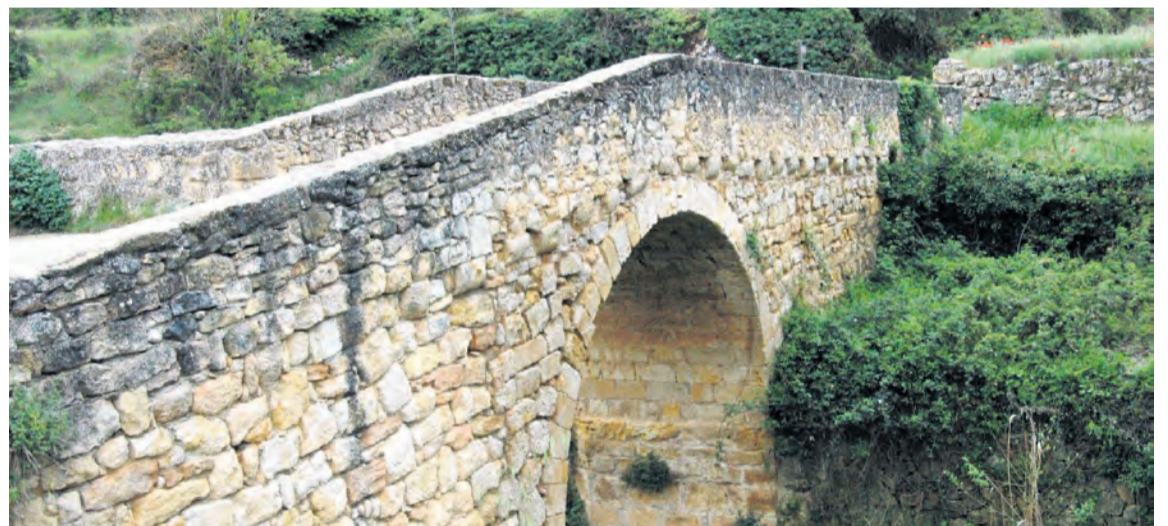
Además del paisaje, durante la ruta se descubrirán elementos patrimoniales como este puente medieval. NDM

Al ser una ruta bastante larga es recomendable asegurarse de que tendremos buena meteorología, ir bien equipado y llevar una buena cantidad de agua y algo de comida para recuperar las fuerzas durante el recorrido.