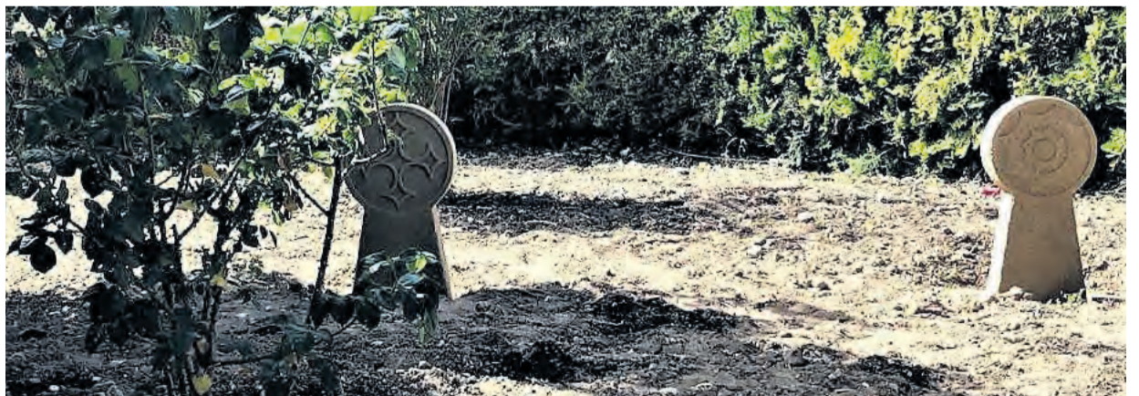
Los visitantes pueden descubrir cómo eran las antiguas estelas funerarias que se encontraban en el municipio. Juan Luis Camps

Parte de las piezas son originales, aunque con ayuda de informes, estudios y archivos fotográficos