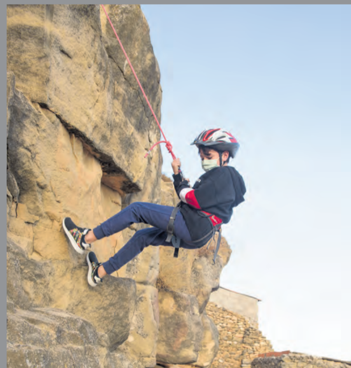
El CSA l'Argilaga organizó el martes 13 de octubre en Mazaleón un taller de iniciación al rapel para niños y niñas de diferentes edades. MMB