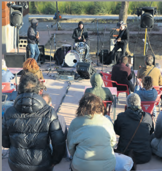
El público disfrutó del rock y el funk en directo. JBL

Fórnoles y Calaceite serán las próximas sedes de espectáculos teatrales con público reducido.