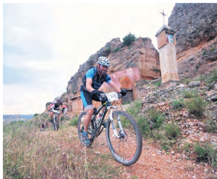
Los amantes de la BTT podrán recorrer todo el territorio del Matarraña.

Para este proyecto se aprovecharán algunas rutas ya existentes y se crearán otras alternativas para construir la red. En la actualidad el Matarraña cuenta con más de 500 km de rutas. Por el momento se desconoce el total de los kilómetros al finalizar el proyecto, aunque se estima que unos 100 kilómetros habrán de realizarse nuevos. La mayor parte de los trabajos consisten en la homologación y señalización