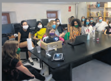
El Matarranya tiene su propia categoría. NDM

El objetivo del concurso es impulsar la creación literaria y el trabajo en equipo de los estudiantes de Secundaria y Bachillerato con inquietudes literarias y culturales. AMIC-Ficcions quiere continuar creciendo y consolidarse como el concurso de creación en lengua catalana de referencia para los jó-