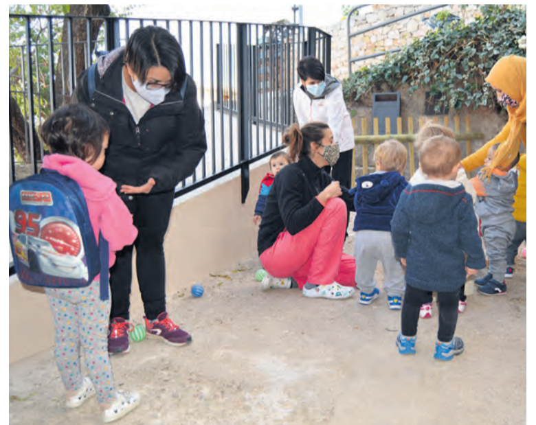
En Peñarroya han abierto el aula con un total de 8 niños y niñas. MJG

Casi dos meses después del inicio del curso de la Escuela Infantil Sagalets de la Comarca del Matarranya, esta semana se ha abierto una nueva aula en Peñarroya de Tastavins. Un retraso marcado por las obras de