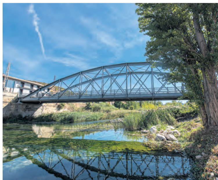
La mejora de este puente es una reivindicación histórica. NDM

A pesar de que habrá que esperar para conocer las características de la obra, la actuación podría estar lista dentro de un año.