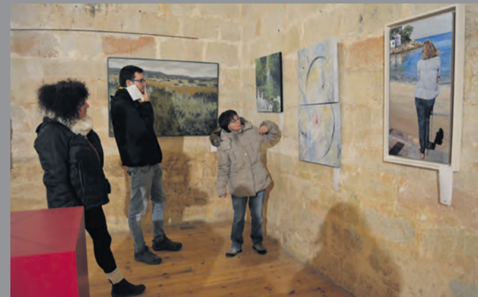
Este año se apuesta por realizar una preselección digital.

En cuanto al catalán, es una lengua compartida con amplios territorios de otras comunidades autónomas vecinas y su situación jurídica es análoga, en nuestra Comunidad, a la del aragonés. Sus dominios geográficos apenas han sufrido variaciones a lo largo de los últimos siglos, siendo hablado en una banda o "franja" oriental que se extiende desde la Ribagorza hasta el Matarraña. El número de hablantes cotidianos de catalán de Aragón es de unas 55.000 personas y los que lo entienden llegarían hasta los 90.000.