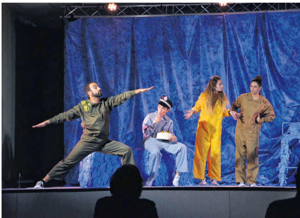
La obra 'El Show del Nuevo Mundo' tuvo una buena acogida tanto en Peñarroya como en Valjunquera. JBL