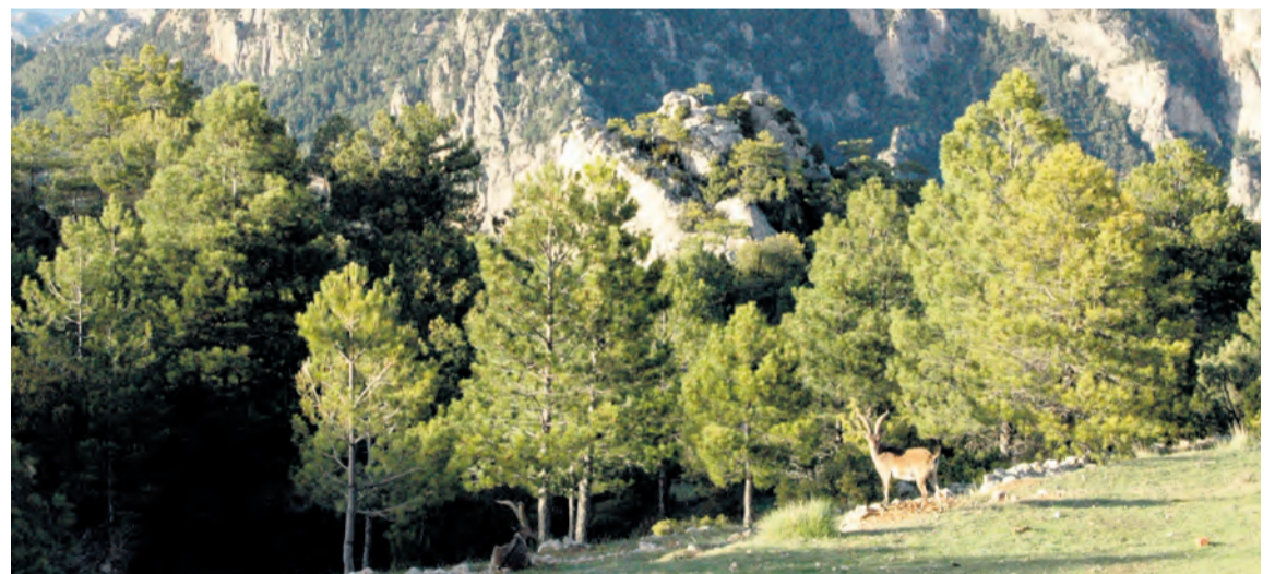
Los paisajes típicos de los Puertos nos acompañarán durante toda la ruta de ascensión a la 'Mola del Lino'. NDM

Recuerda que se debe ir adecuadamente equipado según la meteorología y llevar agua suficiente ya que no encontraremos ninguna fuente en todo el recorrido.