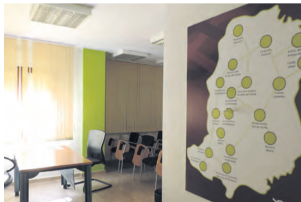
El espacio se encuentra en la sede comarcal de Valderrobres. NDM

La sala, ubicada en la sede comarcal, puede servir a los emprendedores para realizar cualquier tipo de reunión con clientes o incluso un espacio de reunión e interconexión entre los emprendedores rurales. De ahí el nombre del proyecto, Matarraña en Red , que estrena ahora su nueva cuenta de Instagram desde la que se pretende difundir el trabajo de los emprendedores.