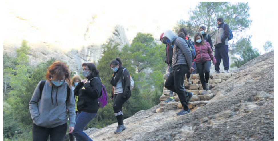
Unas 70 personas de diferentes municipios participaron en la iniciativa comarcal. MJG