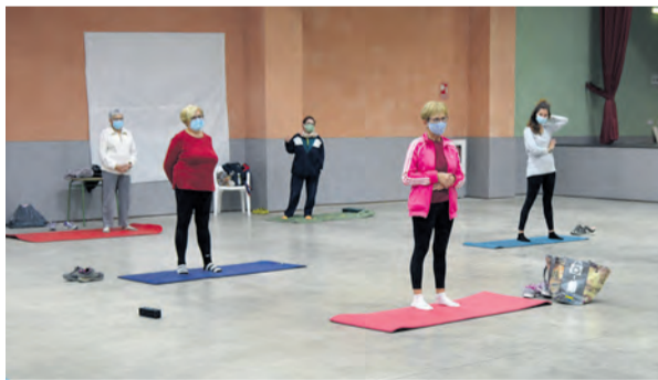
Las actividades cumplen todas las normas vigentes. NDM

La situación de la comunidad y el constante aumento de positivos por COVID-19 en el Matarraña y en todo Aragón han establecido nuevos protocolos deportivos . En este sentido, el ejecutivo aragonés aprobó la nueva normativa que limita las activi-