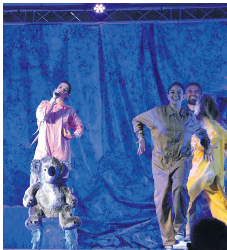
El espectáculo aborda diferentes temas de actualidad. JBL