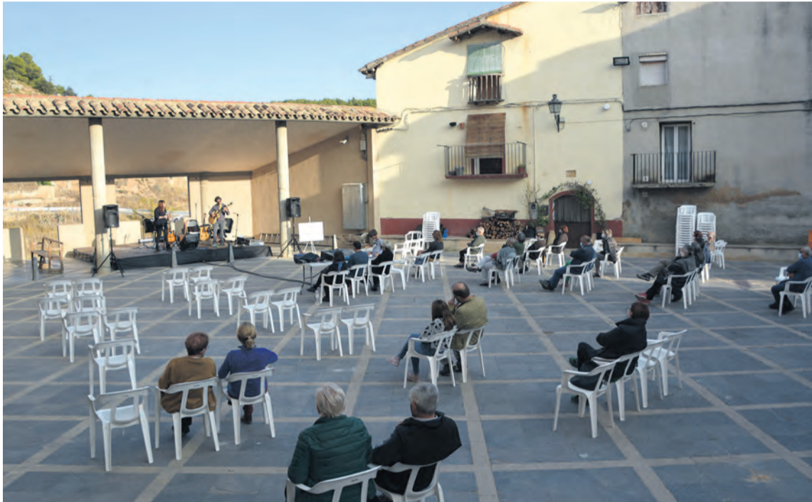
La actividad se desarrolló siguiendo todas las medidas de seguridad vigentes debido a la COVID-19. JBL

El concierto de 'Entre tres' combinó a tres artistas del territorio en tres formaciones diferentes