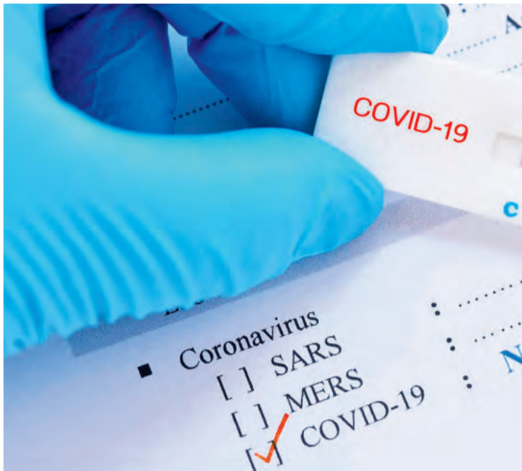
La segunda ola está afectando más a las zonas de salud del Matarraña. NDM

Los casos notificados en Valjunquera se asocian al área sanitaria de Alcañiz y, por lo