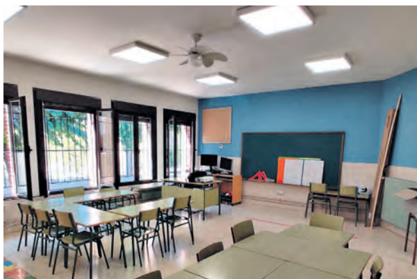
La mejora ha supuesto una inversión de unos 6.000 euros. NDM

Este año, se han reparado los desconchones y grietas tanto de las fachadas como del interior, se han eliminado las humedades y goteras de la