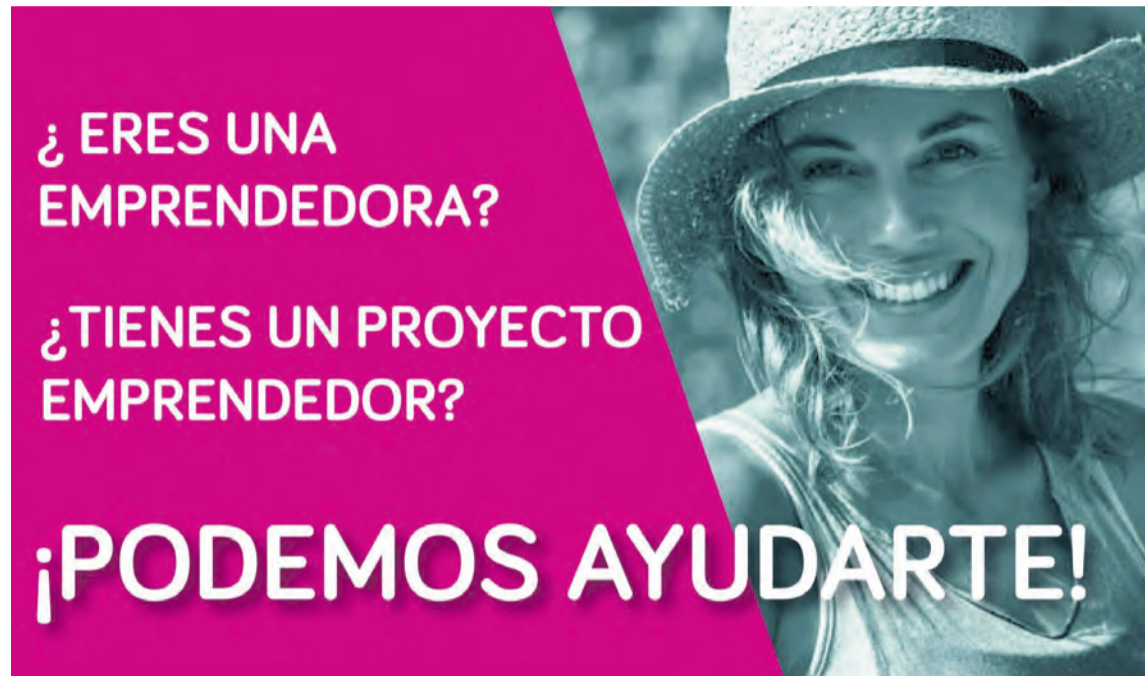
El proyecto desarrollará su actividad a través de un método de acompañamiento basado en el asesoramiento. NDM

Su actividad está dirigida tanto a aquellas mujeres que quieran formarse en las herramientas y competencias para el desarrollo de proyectos emprendedores, mujeres en situación de desempleo que tengan una idea emprendedora y quieran desarrollarla diseñando su Plan de Viabilidad individuali-