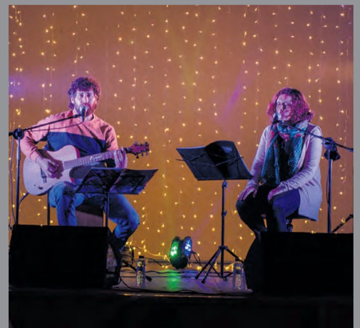
Unas 30 personas disfrutaron del concierto de 'Miriam i Rafel' organizado por el CSA l'Argilaga en el salón municipal de Mazaleón.

La participación es similar a todas las categorías del concurso. Las que cuentan con mayor éxito son la de arquitectura popular y paisajes. La categoría de oficios disminuye, previsiblemente a la falta de celebración de ferias, donde se recrean estas tradiciones. El concurso de fauna también se mantiene. Y los premios especiales, en esta edición están centrados en ermitas y el agua en ríos y barrancos, también han aumentado en participación.