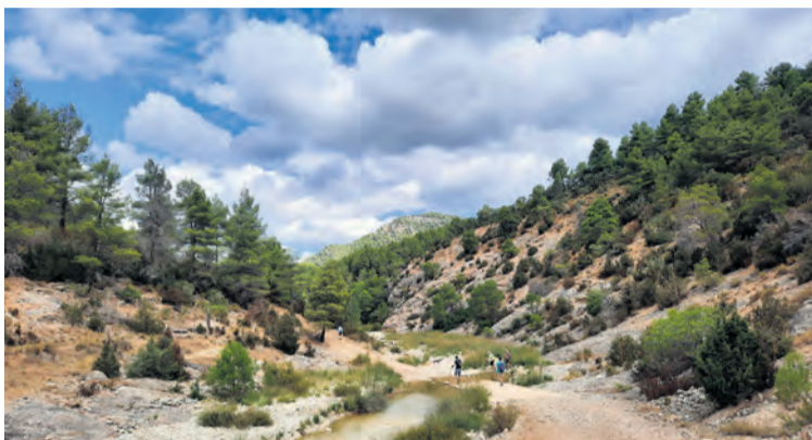
Las actividades en contacto con la naturaleza son un gran atractivo. NDM

En cuanto a afluencia, un puente de récord. Visitas turísticas, espacios naturales y localidades enteras se colapsaron por completo. Desde las oficinas de turismo de la zona aseguran que "un día con tantos visitantes como el pasado sábado no lo hemos tenido en todo el mes de agosto" . Una comparación que no ven fácil. "Es cierto que el turismo durante el verano