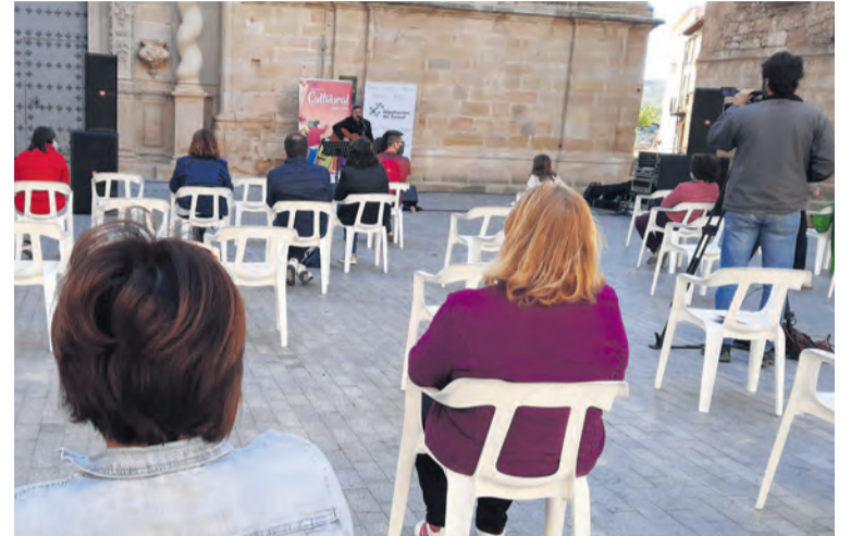
La participación no fue muy alta pero los asistentes disfrutaron del evento.