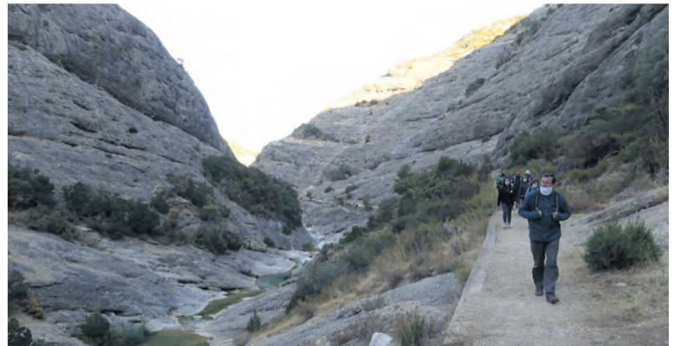
Los participantes en la actividad disfrutaron del recorrido por 'Els Estrets' de Arnes.