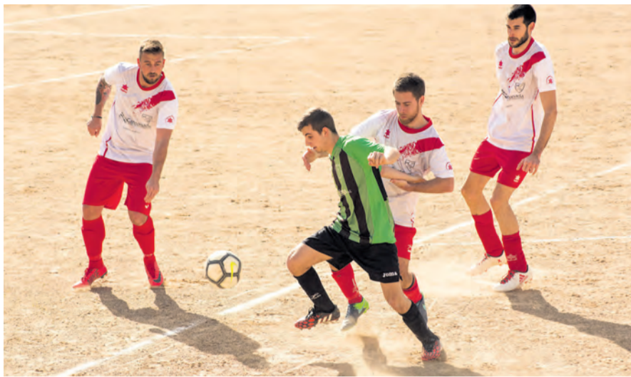
Esta temporada no se podrá ver fútbol regional en ningún municipio del Matarraña. NDM