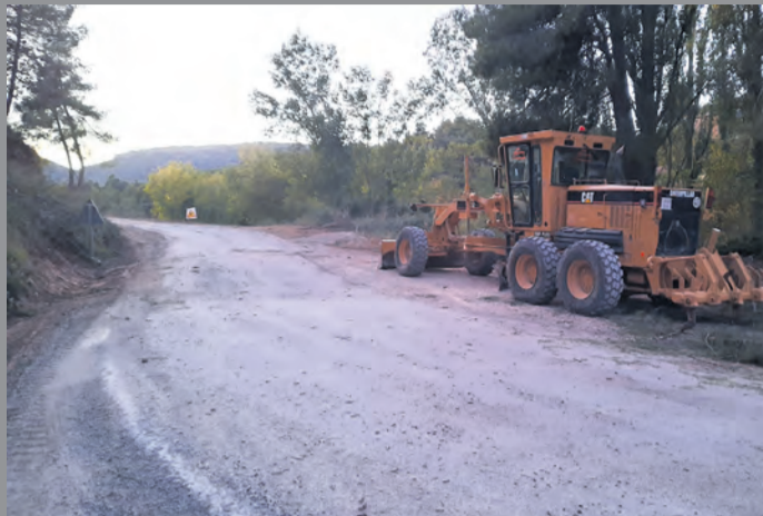
Los trabajos obligaron a cortar la vía durante varios días. MJG