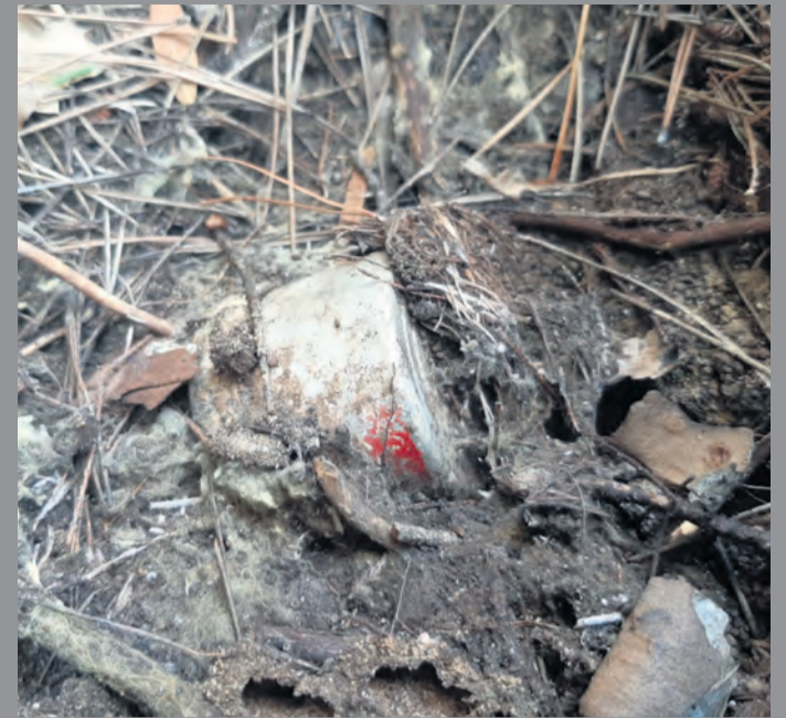
Un vecino fotografió unos objetos que resultaron ser granadas. NDM

En la zona existen más yacimientos íberos por excavar al igual que necrópolis y túmulos funerarios y según apuntaba Melguizo "sería necesario incorporarlos a la red de Rutas Íberas del Bajó Aragón para poder darlas a conocer próximamente a nivel turístico".