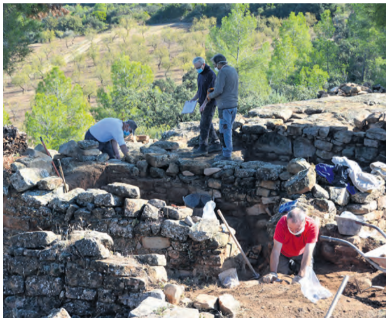
Los operarios están trabajando en el poblado 'Els Castellans' de Cretas. M/J

Según el experto es por la parte noroeste por la que se accede mejor al poblado ibérico y donde se pueden apreciar elementos que muestran que en el poblado se ejercía una