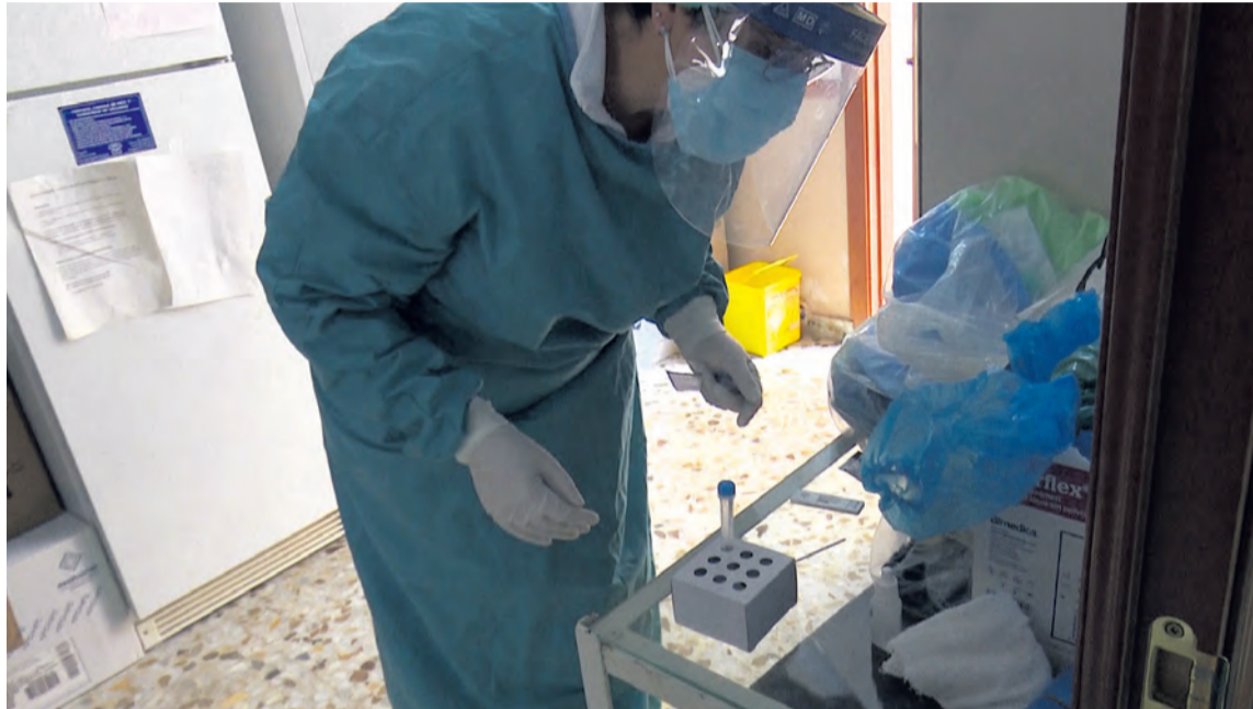
Los pueblos del Matarranya siguen sumando positivos por COVID-19 durante este mes de noviembre. MJG

A lo largo de la semana el número ha ido descendiendo pese a registrar igualmente un gran número de contagios en comparación a meses anteriores. El miércoles 4 dejó