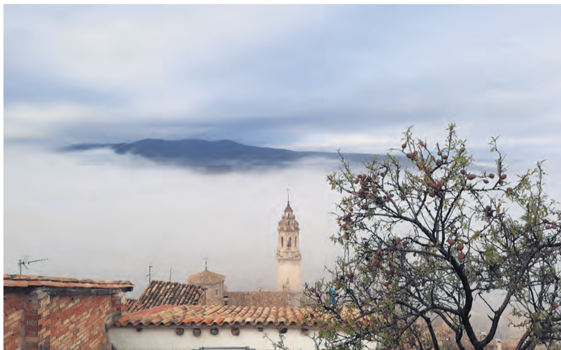
A parte de la lluvia, la niebla también fue protagonista durante el pasado temporal. M.J.G

El martes de la semana pasada cambió el tiempo en el Matarraña, los cielos se cubrieron de nubes y llegaron las nieblas y no desaparecieron hasta el domingo. En diferentes oleadas el temporal fue acumulando agua, que en la mayoría del territorio superó los 75 litros por metro cuadrado. El día más lluvioso fue el jueves 5, donde por ejemplo la estación meteorológica de la Confederación Hidrográfica del Ebro recogió en el embalse de Pena 34 litros por metro cuadrado y 49 el situado en Michavilla , a 1345 metros de altitud en las