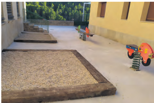
El patio se ha remodelado casi por completo. NDM

Otra de las grandes novedades con las que cuenta el patio del colegio de Valdeltormo son los dos nuevos areneros que han sido construidos para que los niños y niñas puedan jugar durante el recreo . Uno de los areneros cuenta con piedras pequeñas y el otro con arena fina. Además, el suelo de piedras antiguo ha sido sustituido por cemento. Un