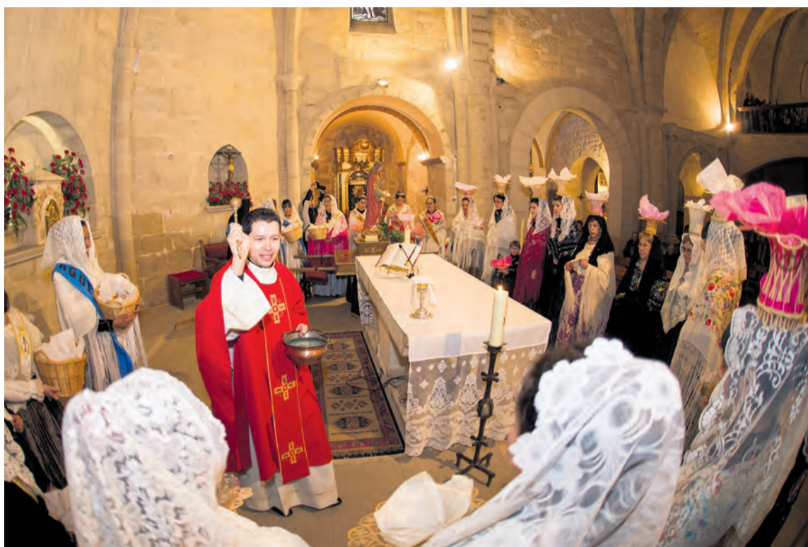
Dentro de la iglesia las mujeres suben al altar con los 'panistres' para que el cura bendiga el tradicional 'pa beneit'. NDM