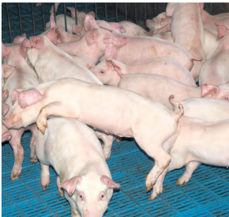
La inseminación artificial mejora el control sanitario de los animales. NDM

La inseminación artificial, según explica Llorente, tiene claras ventajas, como un intenso control sanitario, una rápida difusión del progreso genético o una disminución de los costos económicos de las granjas. Por su parte, los ganaderos españoles de porcino mejorarán su productividad y, por tanto, su rentabilidad.