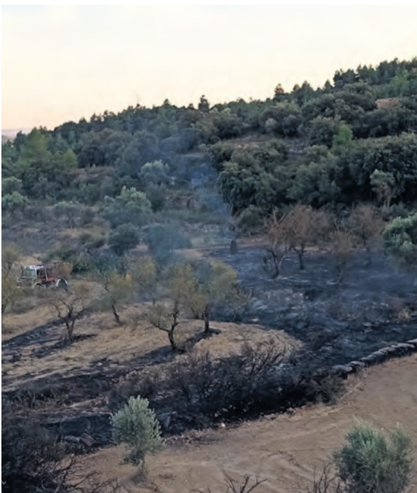
En Valjunquera se produjo un pequeño conato.

Desde los agentes de protección y foresta-