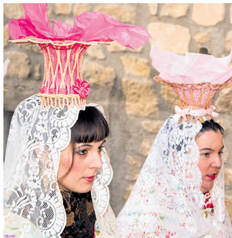
Los 'panistres' son verdaderas obras de arte hechas a mano. NDM