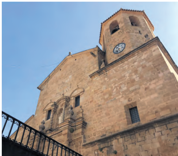
La retirada se ha realizado dos años después de la solicitud. NDM

El partido político Compromís lleva adelante desde el año 2017 una campaña para la retirada de símbolos franquistas que la Ley de 2007 los declara ilegales en los espacios públicos, aunque no existen medidas, plazos ni sanciones para quienes no cumplan con la retirada de dichos símbolos. Según apuntaba el propio Carles Mulet, senador de Compromís "en España hay centenares de calles o pla-