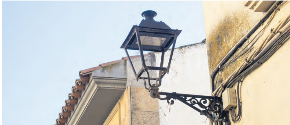
Las nuevas farolas led suponen un gran ahorro energético para los ayuntamientos. NDM

Gracias a la subvención provincial del FIMS de aproximadamente unos 40.000 euros, Calaceite ha iniciado los trabajos para cambiar el alumbrado público a led. En esta ocasión, se están renovando las farolas de la zona de la carretera, el polígono industrial y la carretera nue-