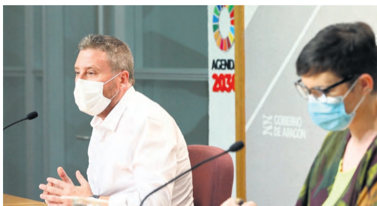
José Luis Soro presentó esta nueva línea de ayudas al alquiler. NDM

Se trata de unas ayudas complementarias a otras que se están poniendo en marcha , como son las ayudas generales al alquiler, las ayudas al alquiler derivadas del COVID o los alquileres que se prestan a través de la Bolsa de Alquiler Social. Tal y como ha explicado el consejero de Vertebración del Territorio, Movilidad y Vivienda, "muchas veces se pone el foco en los desahucios y las soluciones habitacionales que damos a los casos que provienen del Convenio con el Consejo General del Poder Judicial y la FAMCP, pero igual de importante es ofrecer ayudas para el pago del alquiler, desarrollar políticas preventivas y en definitiva, evitar que las familias que tienen una voluntad clara de abonar el alquiler pero se ven en una situación complicada, se