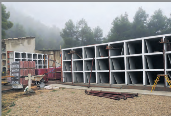
La localidad está ampliando el cementerio municipal. NDM