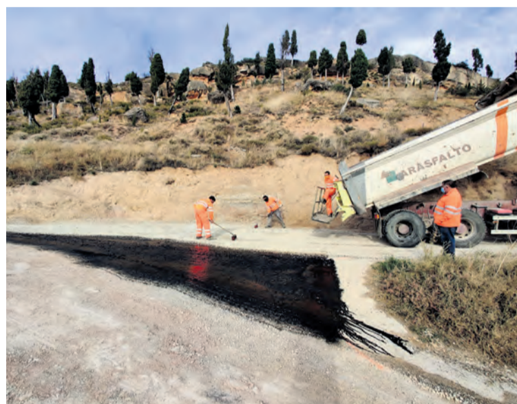
La Fresneda ha mejorado diferentes vías del municipio. NDM

En Cretas las actuaciones se han financiado con recursos propios del consistorio, en concreto con una partida de casi 35.000 euros , y en colaboración de la Diputación que ha hecho posible la adecuación de unos 4.000 metros cuadrados