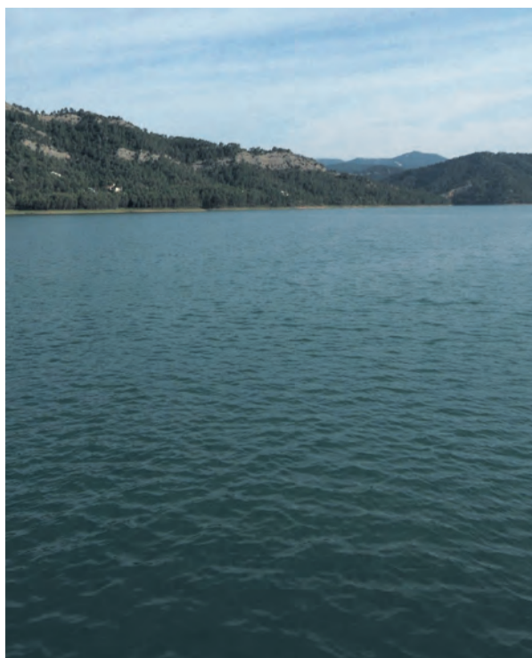
El túnel es clave para garantizar las reservas de agua en Pena.

Las obras tienen como principal objetivo restaurar la infraestructura afectada por acumulación de material de arrastre, por desprendimientos, fisuras y humedades. El proyecto ya ha sido adjudicado recientemente a la empresa Obras y Servicios Públicos S.A. con un presupuesto de 434.408 euros .