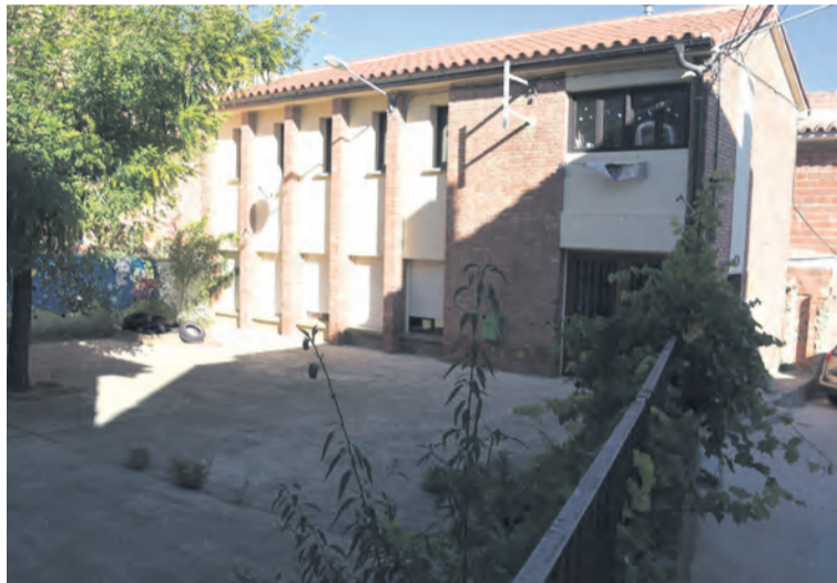
Ráfales ha sido uno de los pueblos que ha mejorado su colegio.