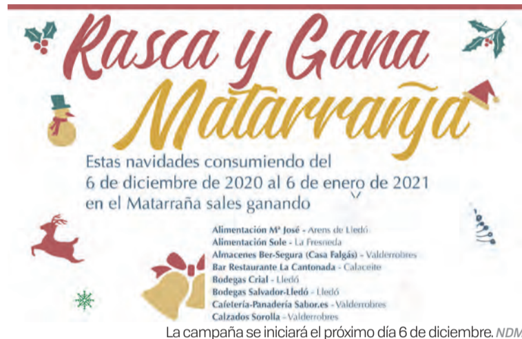
La campaña se iniciará el próximo día 6 de diciembre. NDM

Esta es una acción de promoción del comercio local y los servicios del Matarraña, con el objetivo de fidelizar a los clientes e incentivar el consumo local y de proximidad a través de la entrega de tarjetas RASCA Y GANA, permitiendo así a los