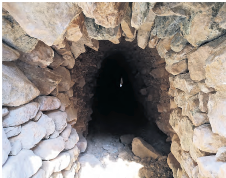
Cada foto premiada acompañará a un mes del calendario. A.C. El Portillo

El único requisito exigido para concursar era que las imágenes fueran de La Portellada intentando huir de los lugares más típicos como 'El Salt' o 'Sant Miquel' para mostrar también los lugares más desconocidos.