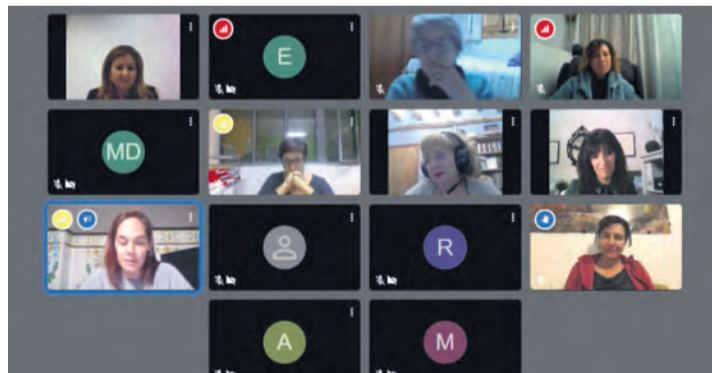
El taller 'Empoderarnos para emprender' se hizo de manera virtual.

La conciliación, buscar un buen asesoramiento, di-