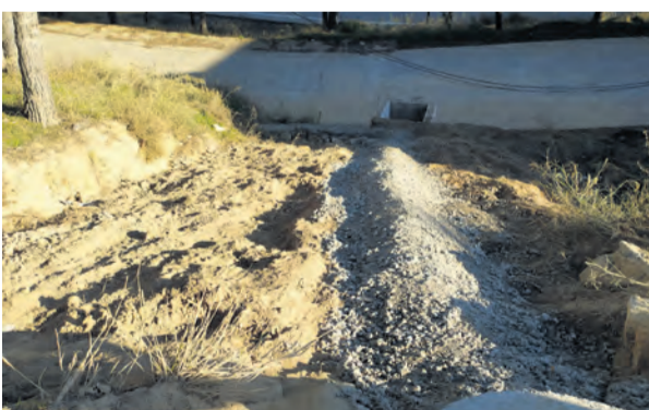
Se han retirado los árboles y se ha creado una canalización. NDM

Recientemente se ha trabajado en la retirada de árboles y limpieza en la calle del cementerio donde el agua produjo desprendimientos. Además, con el