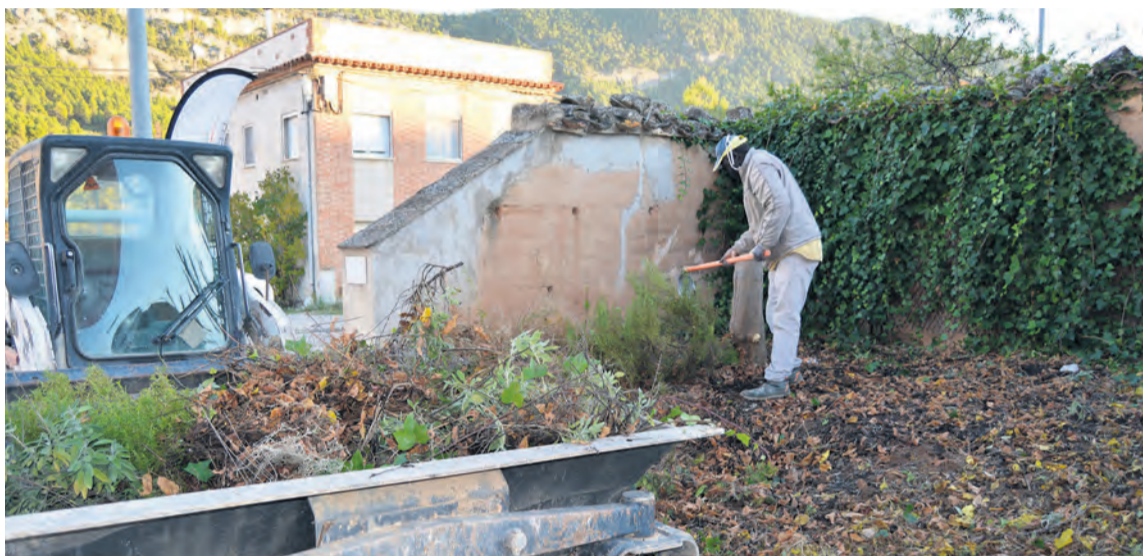
El punto de recarga para coches eléctricos de Fuentespalda se ubicará junto al edificio del Cubic.