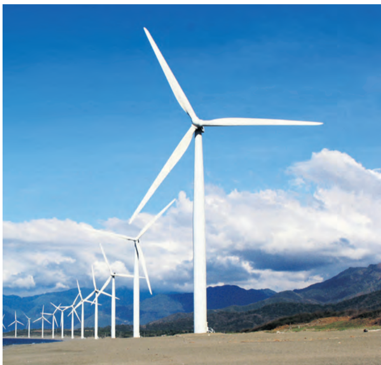
La proyección de aerogeneradores genera polémica en el territorio. NDM

El acuerdo adoptado por el Ayuntamiento de La Fresneda no únicamente pide la retirada del proyecto eólico, sino que va más allá y pide al Ministerio de Transición Energética que no lo declare de Utilidad Pública y en palabras del edil de La Fresneda "creemos que ahora corresponde a los vecinos y vecinas de la comarca del Matarraña y a los miembros de los Ayuntamientos decidir qué modelo queremos para nuestra comarca. No podemos permitir que desde arriba nos impongan como tenemos que vivir y mucho menos privarnos de la libertad de decidir".