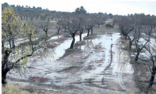
Noviembre ha sido un mes muy lluvioso en el Matarranya. NDM

La estación meteorológica de la Confederación Hidrográfica del Ebro en el embalse de Pena registró una acumulación entre el 27 y 28 del mes pasado de 74,91/m 2 . En la parte sur de la comarca se registraron también datos destacados, 45,51/