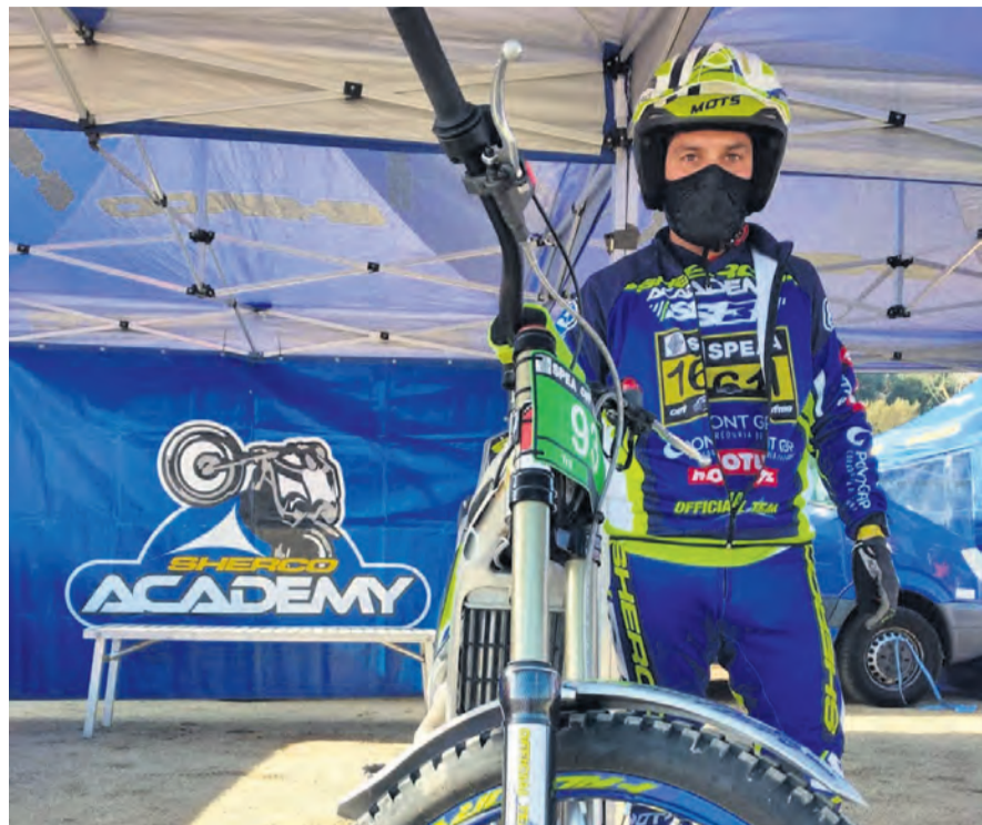
Puyo se queda 'con buen sabor de boca' en una temporada marcada por la COVID-19. NDM