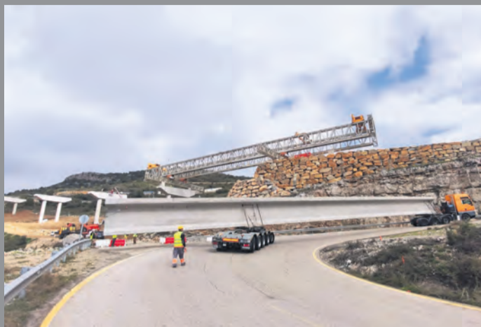
El tramo del 'Pont de la Bota' reabre este próximo viernes. NDM