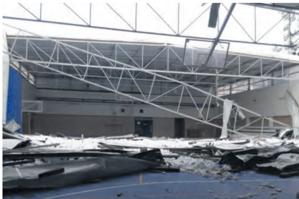
Las obras se prevé que empiecen el próximo mes de enero. NDM

La espera de estas ayudas ya no es una opción y