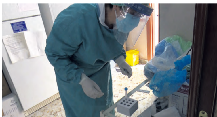
Las cifras de la segunda ola han sido mayores que las registradas en primavera. MJG

La tercera semana de noviembre, la correspondiente al 16-22 de noviembre dejó 9