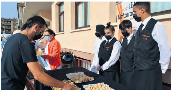
Los alumnos repartieron dulces entre el personal sanitario. MJG

Los actos tuvieron lugar el martes 1 de diciembre en las puertas de la Residencia de Valderrobres y el jueves 26 de noviembre en la entrada del Hospital de Alcañiz. Los lotes de pastas estaban compuestos por 'plum cake' de frutas escarchadas y 'casquetas' rellenas de membrillo ecológico,