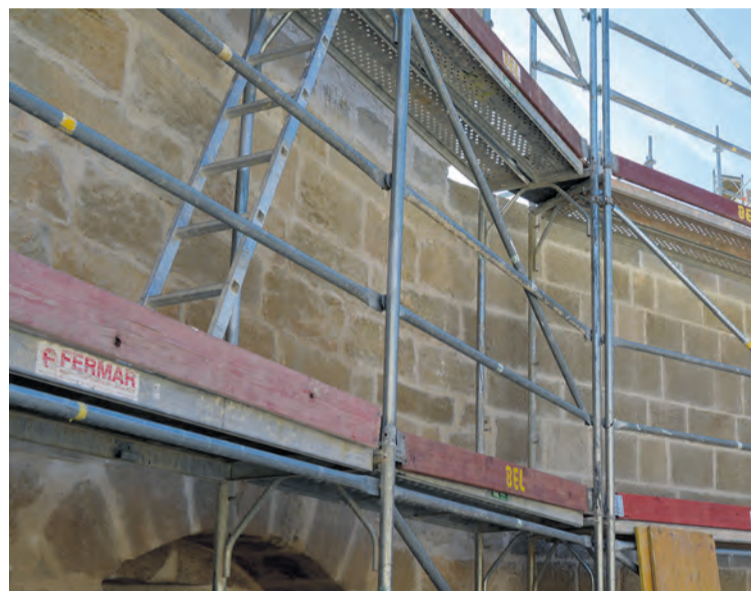
Los trabajos de rehabilitación continúan en el Castillo de Valderrobres.