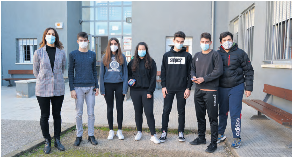
Los alumnos de la asignatura Ciencias de la Tierra y del Medio Ambiente desarrollaron el proyecto de investigación.