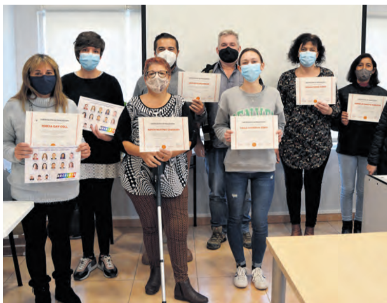
Los alumnos obtuvieron un Certificado en operaciones auxiliares. M.J.G

Para poder completar el curso a los alumnos les quedan las prácticas laborales no profesionales en alguna em-