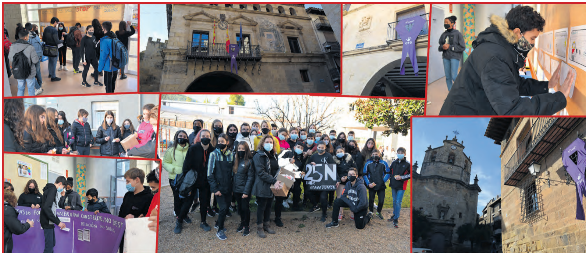
Todos los municipios del Matarraña colgaron un gran lazo y en el IES Matarraña se organizaron diferentes actividades para conmemorar el Día Internacional para la Eliminación de la Violencia contra la Mujer. NDM