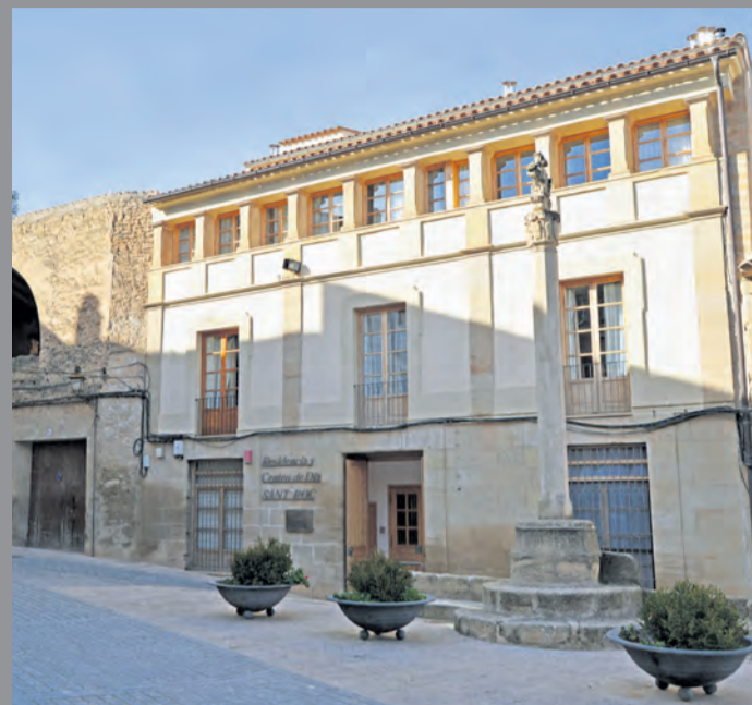
En la Residencia 'Sant Roc' ya usan el sistema de videoconsultas. NDM

Desde el inicio de la pandemia en el Matarranya se han registrado un total de 208 casos por coronavirus.