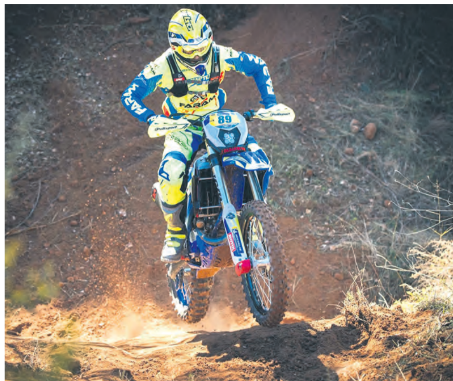
Guimerá quedó con un sabor agrídulce tras la prueba de Arnedo (La Rioja). NDM

La próxima salida senderista se une así a las ya anteriormente realizadas por el Departamento como alternativa durante la COVID. Las dos primeras se realizaron en octubre. La primera, en Peñarroya de Tastavins, visitó las Rocas del Masmut y sus alrededores. La segunda recorrió 'Els Estrets' de Arnes. En enero, la tercera, tuvo lugar en el Pantano de Pena de Beceite.