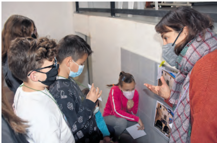
Los niños y niñas aprendieron cómo se trabaja en el sector turístico. M.J.G

Los alumnos del CRA Algars conocieron todos estos conceptos relacionados con el turismo en dos jornadas diferentes. La primera de ellas, el jueves 18 de marzo llegó hasta los co-