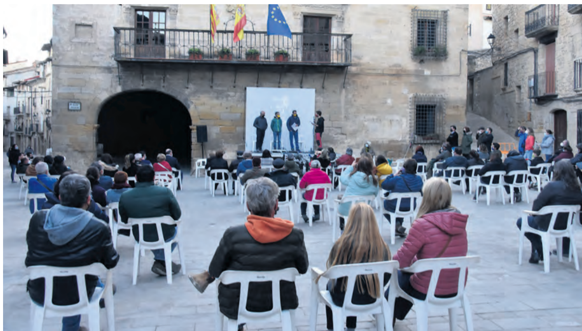
La Ruta por la Dignidad Rural de Teruel concluyó con un homenaje a los corredores en la plaza de La Fresneda.

El sábado 13 de marzo, bajo todas las medidas de seguridad sanitaria, en la plaza de La Fresneda se congregó gente venida de muchos pueblos de la comarca para recibir entre aplausos a los tres corredores que completaron la ruta. "Estamos en casa, nos sentimos muy acogidos y eso no tiene precio. Ves en estos momentos que lo que has hecho es importante, porque has hecho mover a la