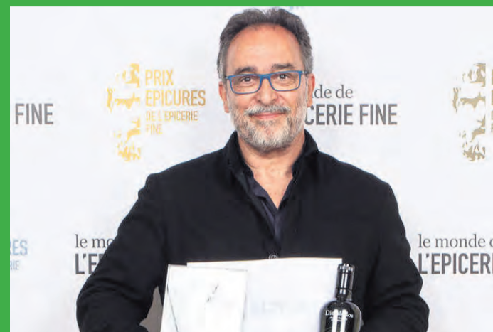
El aceite de Diezdedos vuelve a ser reconocido internacionalmente. NDM