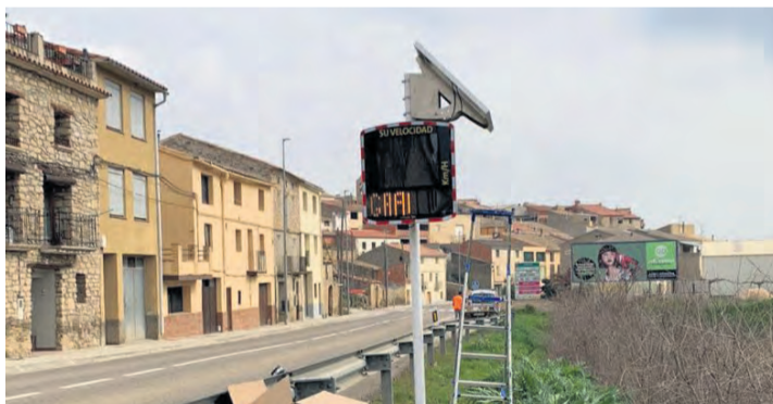
Los paneles se han instalado en las dos entradas del municipio. NDM

Los paneles que se han instalado en Valdeltormo tie-