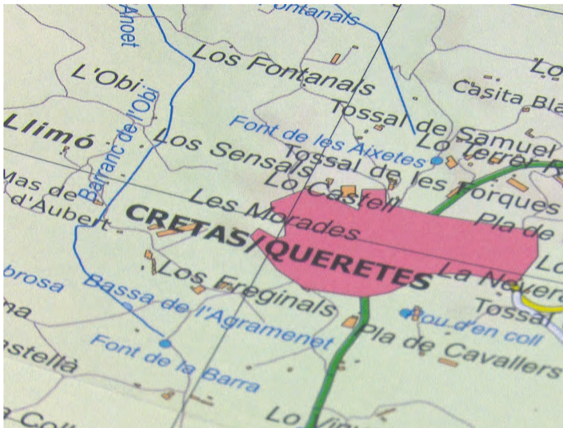
El mapa toponímico de Cretas ha sido el primero en desarrollarse dentro de esta iniciativa. NDM

De los 700 topónimos encontrados, para el folleto se seleccionaron 230, los cuales aparecen agrupados por tipología y acompañados con un mapa del término municipal