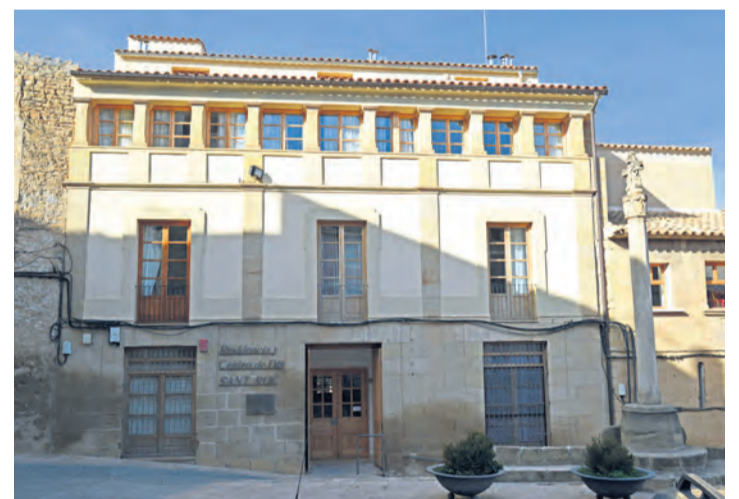
El presupuesto asciende al asumir los gastos del personal de 'Sant Roc'. NDM

Respecto a las principales inversiones que el Ayunta-