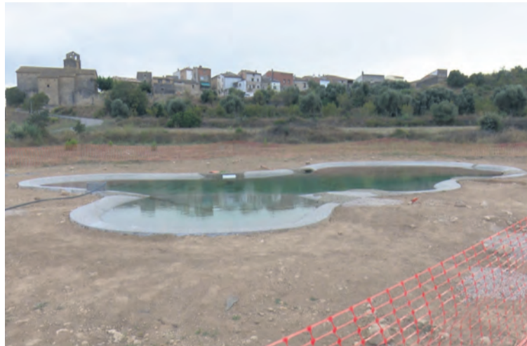
Este año está previsto desarrollar la segunda fase de la piscina municipal. MJG

Pero sin ninguna duda, el gran foco de actuación por parte del consistorio de Arens de Lledó se centra en seguir traba-