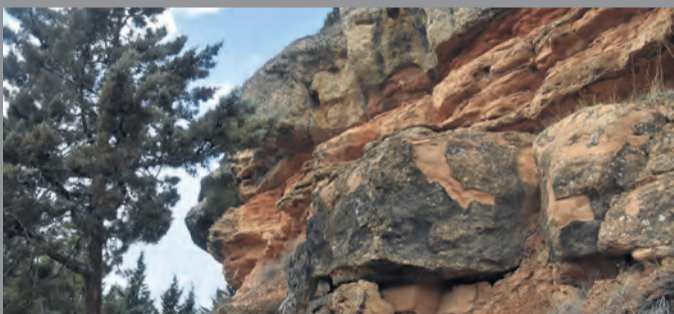
Evitar los desprendimientos de 'La Mola' será prioridad. NDM

Por otro lado, el Ayuntamiento también prevé crear una instalación de placas solares para mejorar la eficiencia energética del pueblo. La intención del proyecto es que todos los edificios e instalaciones municipales se alimenten con placas solares. Para ello, Arens también está pendiente de una subvención.