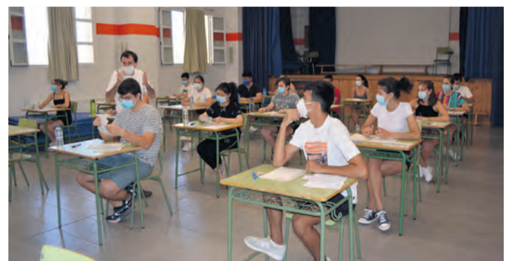
En 2020 el IES Matarraña acogió la EVAU por primera vez en su historia.

La Comisión Organizadora de la prueba, en la que están re-