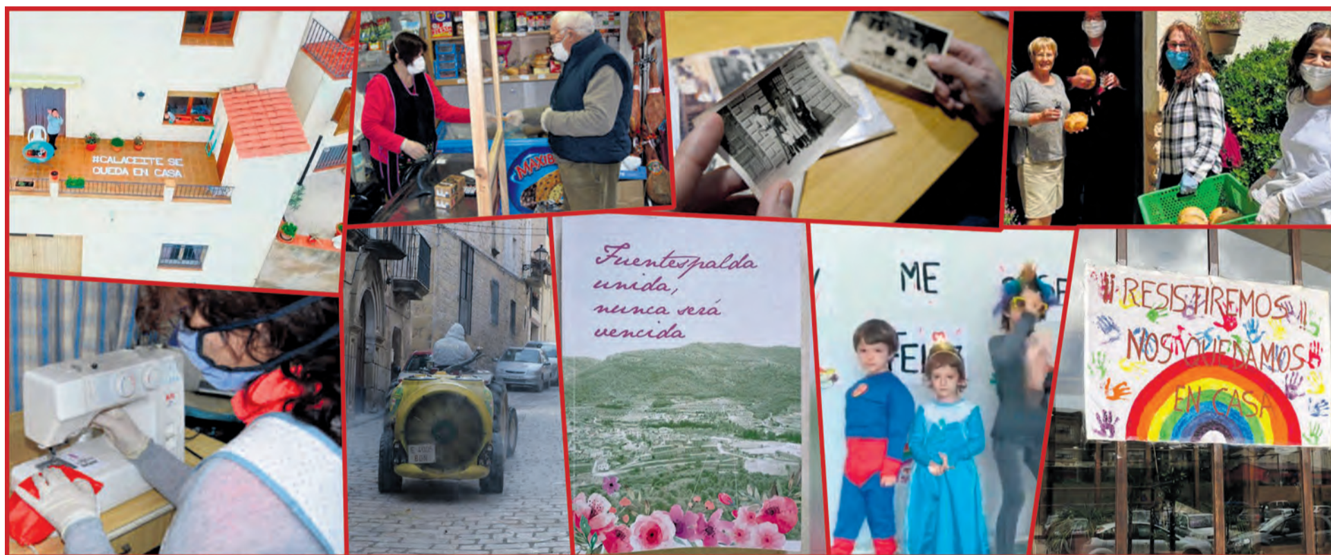
Durante el confinamiento los municipios y vecinos trabajaron para cumplir las medidas sanitarias y también se desarrollaron iniciativas para animar a los habitantes del Matarranya.