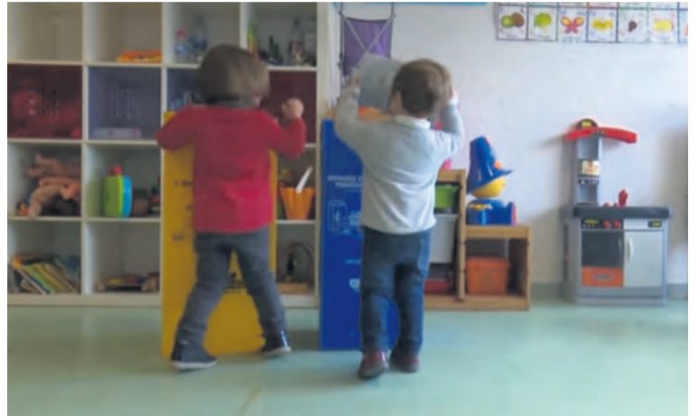
Las instalaciones contarán con un total de 4 usuarios. NDM

"Estamos encantados", declaraba la alcaldesa de