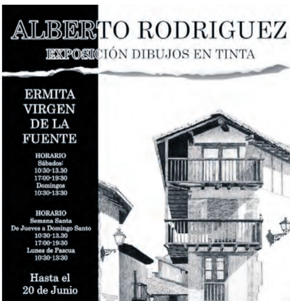
Alberto Rodríguez expondrá en Peñarroya de Tastavins. NDM

La muestra en memoria del Mercado Medieval se podrá visitar en la Sala de Exposiciones