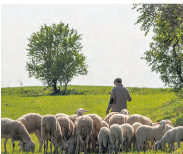
La entidad financiará la promoción de cordero sostenible. NDM

De esta forma, Caja Rural de Teruel refuerza su vínculo con los ganaderos de este sector tan importante para la economía aragonesa, mediante la firma de este acuerdo con INTEROVIC. Además, esta