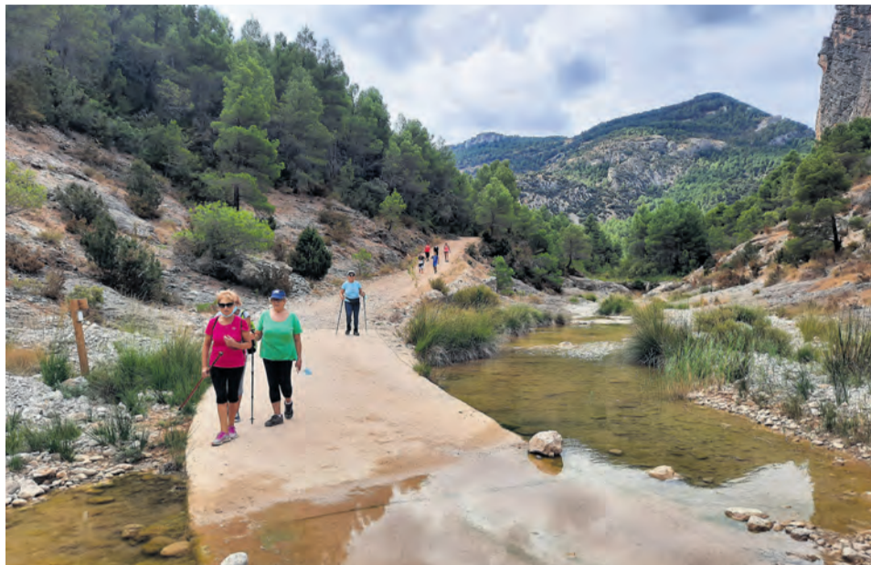
Peñarroya acogió la primera salida senderista el pasado mes de octubre. NDM