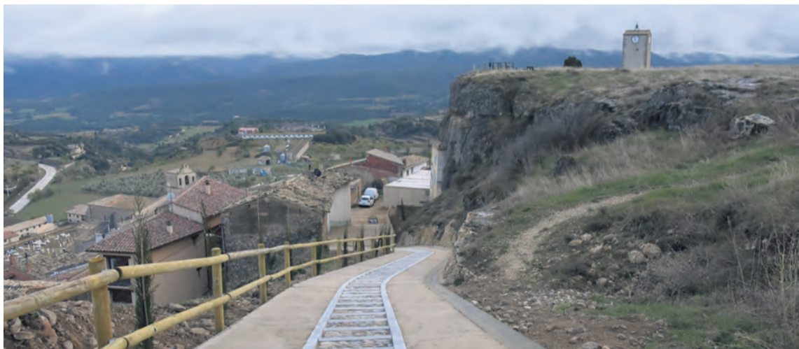
El acceso a la zona más alta del municipio ya luce un aspecto totalmente renovado. NDM

Ahora las obras ya han finalizado y muestran un acceso en el que se ha estabilizado la