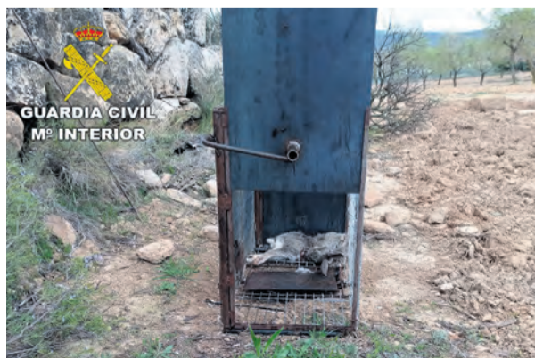
Imagen de la jaula intervenida con cebo dentro.

El presunto autor colocaba jaulas trampas en un terreno agrícola de su propiedad, perfectamente armadas, camufladas y con cebo, con la finalidad de capturar gatos domésticos para darles muerte con un estoque metálico. Desde que empezó esta actividad ilícita, solamente había capturado un gato común, al que le dio muerte. Se trata de un método prohibido por ser