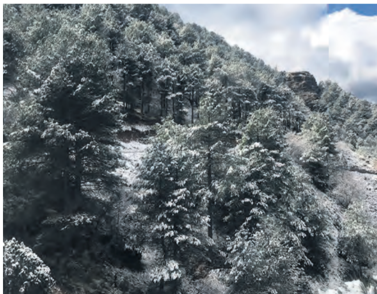
La nevada dejó una fina capa de nieve en el campo y los tejados. José Blanch

Finalmente, la nieve se dejó ver en el Matarraña. En la noche del viernes la cota de nieve bajó a los 700 metros y localidades como Monroyo u Peñarroya cubrieron sus calles y tejados con una fina capa de nieve.