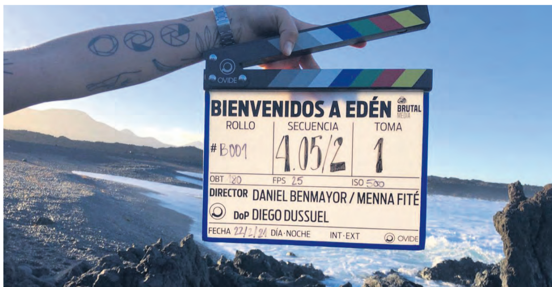
El rodaje empezó el pasado mes de febrero en Lanzarote y ya se está trabajando en Cretas.

Por otro lado, hace una semana anunciaban que