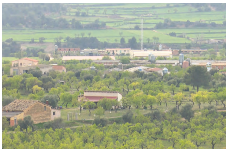
Esta modificación implica una mayor exigencia e intensifica el control. NDM

Una de las principales objeciones que presentaron es la falta de análisis en las aguas, consideran que se podría haber catalogado la zona de manera generalista sin haber realizado análisis ni seguimiento concreto de las aguas de cada localidad. No obstante, desde el Gobierno de Aragón entienden que se tienen que incluir todos los municipios porque la contaminación afecta a toda la "masa de agua", hecho que perjudica a los municipios con menos explotaciones agrícolas. En este sentido, también se han incluido localidades vecinas como por ejemplo Fabara, Maella y Nonaspe, por donde también discurre el río Matarranya. Hay que señalar que la cuenca del río Algars ha quedado excluida de la catalogación