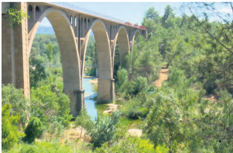
El río Algars, a su paso por el término municipal de Lledó.