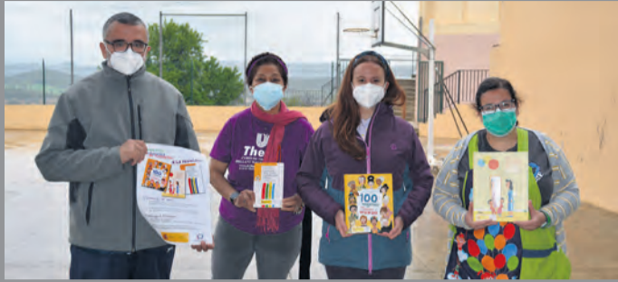
El centro de Peñarroya recibió los libros por San Jorge. R. LOMBARTE