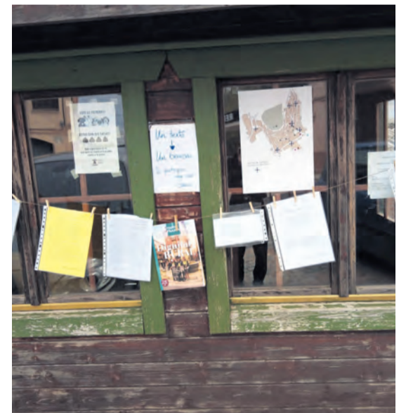
Monroyo celebró el Día del Libro colgando poemas y dibujos por diferentes rincones del pueblo. NDM

puyo á r e tecnológica servicios tecnológicos