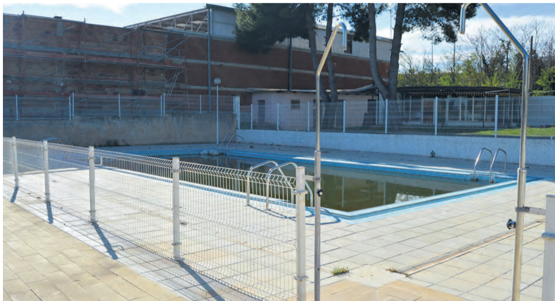
Valderrobres recibirá 120.000 euros procedentes del FITE para poner en marcha una piscina climatizada.