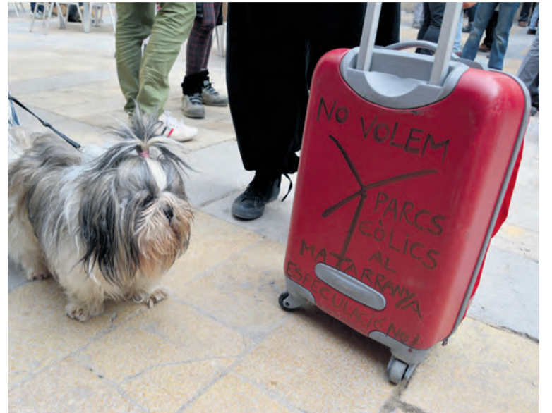
Muchos vecinos del territorio se acercaron al acto con su maleta.