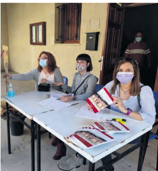
El ayuntamiento de Valdeltormo obsequió a sus vecinos con un libro durante la festividad de San Jorge. NDM

unas carencias muy evidentes en vertebración del territorio", y denunció que " hace años que nuestra provincia está dejada de la mano de Dios ". Y no vemos que desde las administraciones haya unas políticas que puedan beneficiar a la gente del territorio, sino más bien todo lo contrario". En ese sentido, Pérez lamentó la política energética que se está llevando a cabo en el mundo rural, y recordó que "la pandemia ha agravado unas consecuencias que estábamos arrastrando desde hace años, viviendo asimismo un procedimiento de expolio del territorio en pro de las energías renovables sin ningún tipo de planificación".