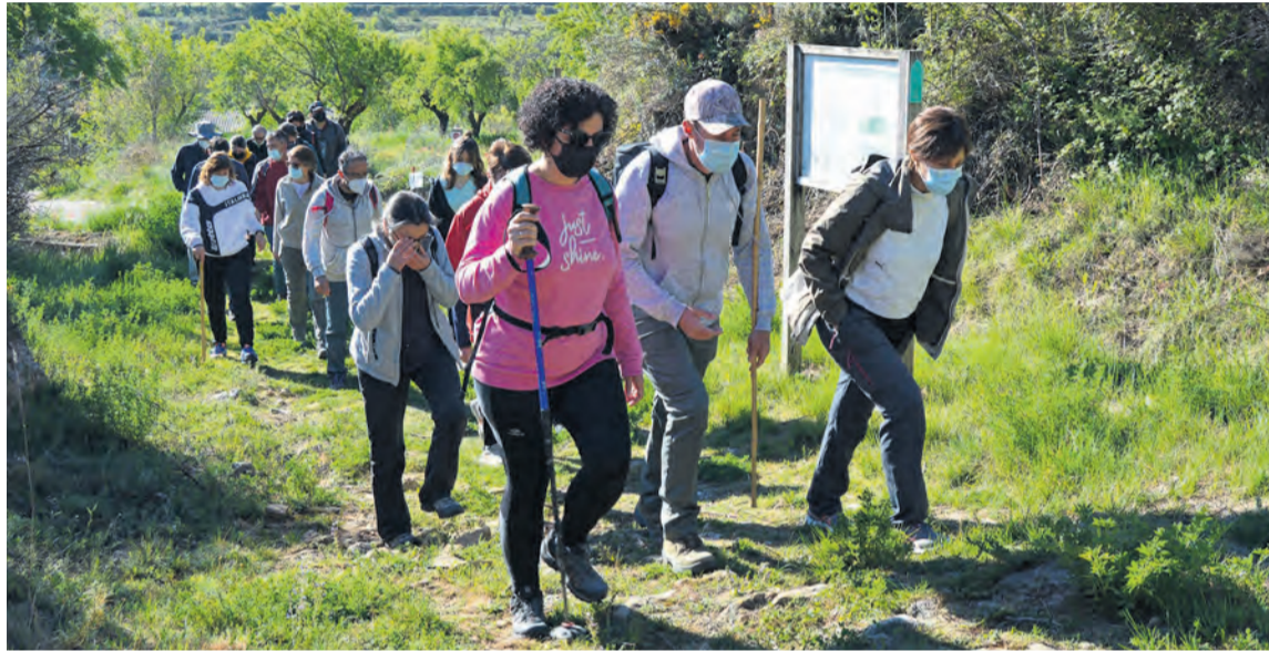
Los participantes salieron de manera escalonada y marcharon por los Estrets y la Cova del Floro. R. LOMBARTE

Precisamente, la ruta senderista celebrada para la ocasión, partió hasta el Mas del Ra-