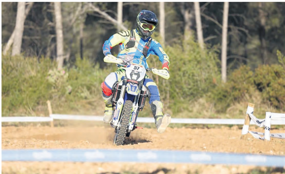
Sitges ha sido el escenario del nacional de Enduro. La próxima carrera será en Pontevedra. NDM