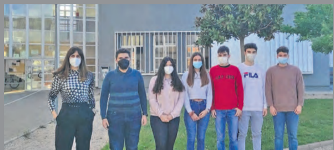
El proyecto ha sido impulsado desde Ciencias de la Tierra. NDM

ción de la estación depuradora", pero "entendemos que si el Gobierno de Aragón aprueba la redacción del proyecto, tendremos más números para que la depuradora sea una realidad".