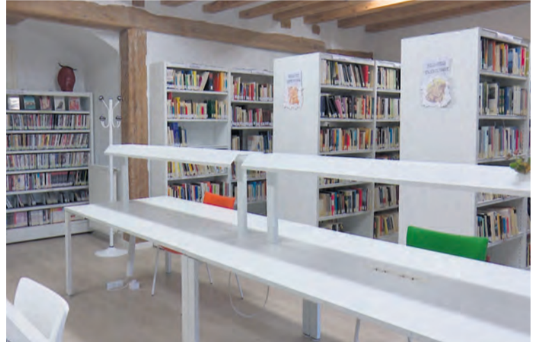
La biblioteca de Valderrobres dinamiza diferentes propuestas culturales.