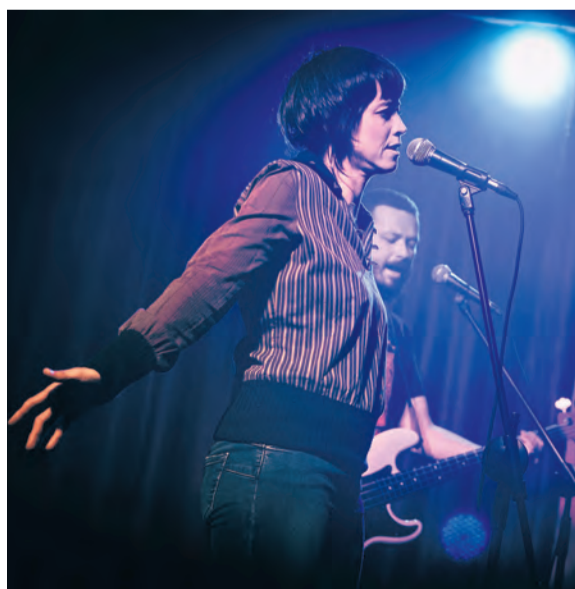
El CSA l'Argilaga ha reiniciado su actividad cultural con los conciertos de la banda barcelonesa Tilde y del grupo zaragozano delDesierto. El próximo día 8 de mayo sigue su programación con la obra de teatro 'Trituro y Escarnio' de Dudosa Compañía. MMB