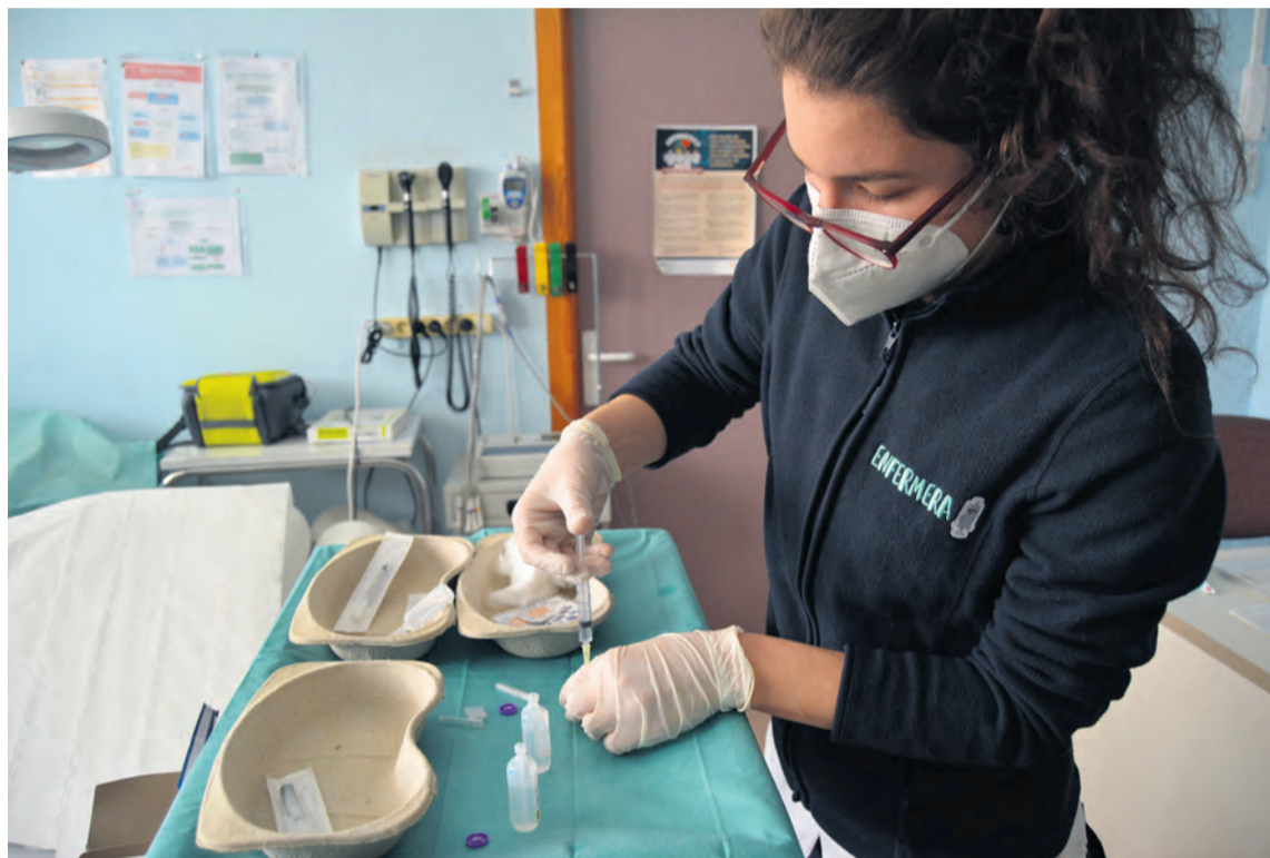
Esta semana se han repartido más de 71.000 dosis de vacuna contra la Covid-19, una cifra récord en Aragón.