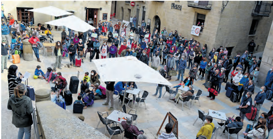
La plaza mayor de Valderrobres centró el acto de protesta contra los proyectos eólicos del Matarraña. R. LOMBARTE