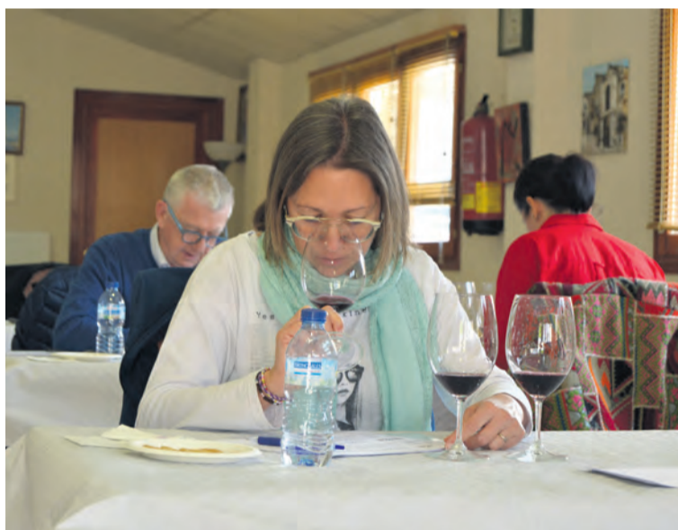
Cuatro enólogos de prestigio se encargaron de puntuar los vinos. R. LOMBARTE

del Bajo Aragón mediante una cata a ciegas”. Por motivos de pandemia, ni la Feria del Vino de Cretas ni los premios a los mejores vinos que visitan la feria se han podido celebrar ni en el presente año ni en el 2020. De ahí que la IGP Bajo Aragón, en colaboración con el ayuntamiento de Cretas, haya impulsado este nuevo concurso, que por un lado quiere premiar a los mejores vinos que se hacen en el territorio , y por otro reconocer a un sector que está sufriendo las consecuencias de la pandemia.