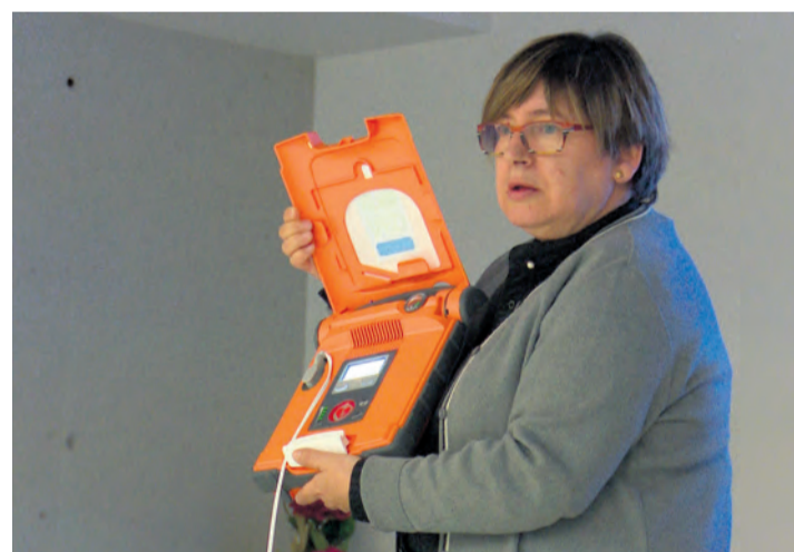
Diferentes municipios del territorio cuentan ya con desfibrilador. NDM

Además, el ayuntamiento ha pedido una subvención al Instituto Aragonés de