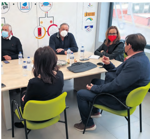
El Grupo Arcoiris tiene previsto ampliar el matadero.