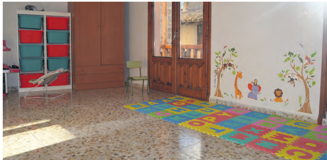
Peñarroya, que cuenta con servicio de escuela infantil desde octubre, prevé levantar un nuevo centro. NDM

La resolución que hizo pública el Gobierno de Aragón también contempla una partida presupuestaria de 120.000 euros para el proyecto de construcción de una escuela infantil en la localidad de Peñarroya de Tastavins . El pueblo, que cuenta con el servicio provisional de 0 a 3 años desde octubre e integrado a la