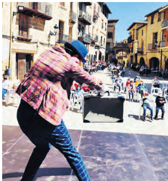
En La Fresneda, la festividad del 23 de abril contó con un grupo de magia para todos los públicos. NDM