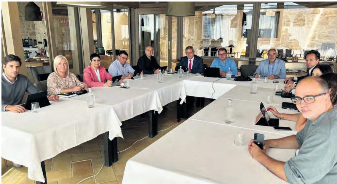
El Consejo Rector de Caja Rural durante su reunión en la Comarca del Matarraña. NDM

La Torre del Marqués es un hotel de 5 estrellas ubicado en Monroyo y claro exponente del Turismo que se desarrolla en el Matarraña, que junto a otros hoteles como Mas de la Costa, Torre del Visco, Fábrica de Solfa o El Convent, entre otros, completan una oferta de turismo de calidad referente internacional, que se ve reforzado por la extraordinaria oferta gastronómica y cultural del Bajo Aragón.