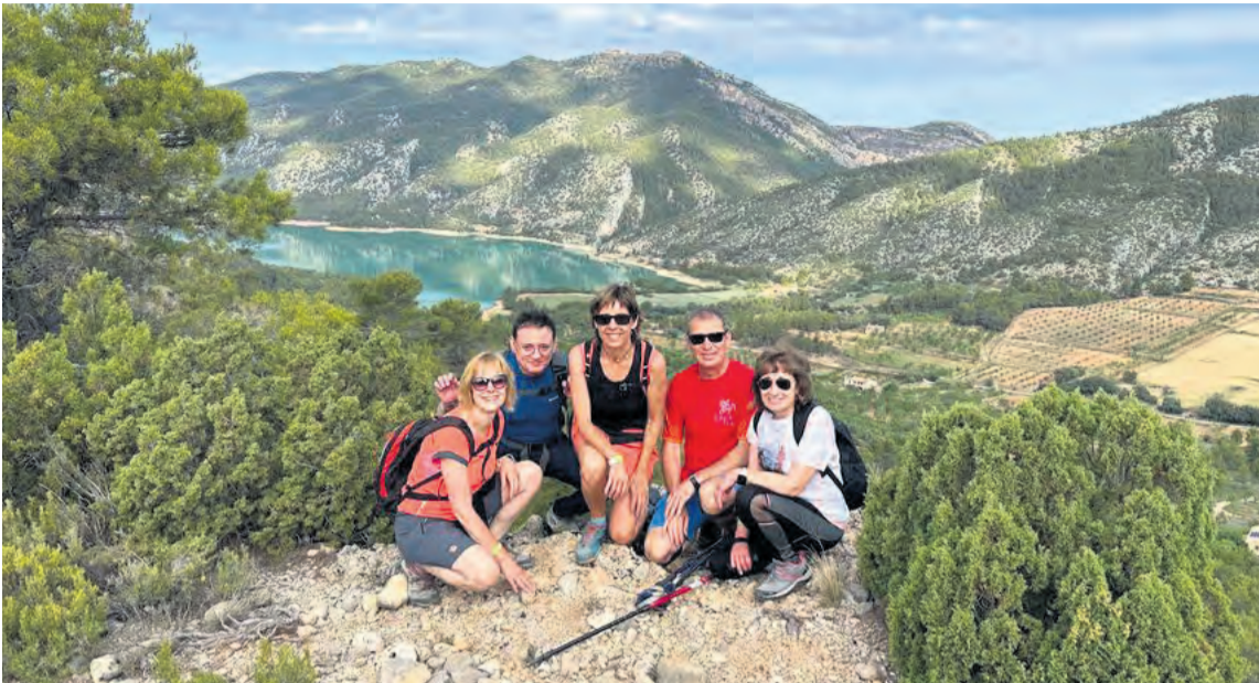
El recorrido planteado desde la organización ofreció unas vistas privilegiadas del territorio. NDM