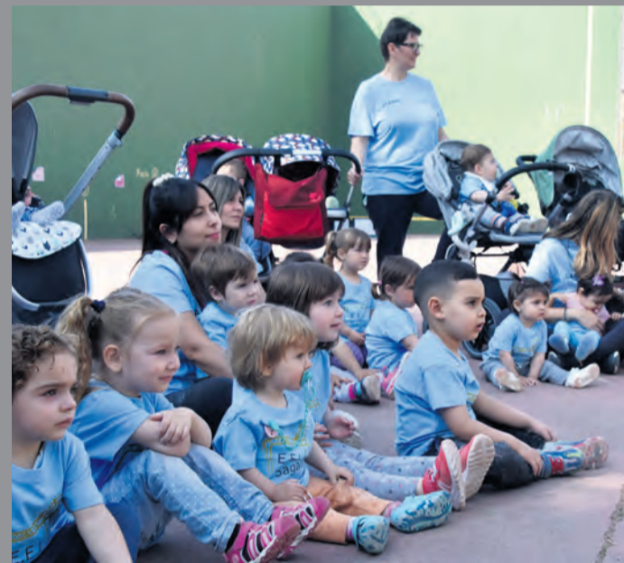
Los alumnos disfrutaron de un cuentacuentos. M. Jiménez