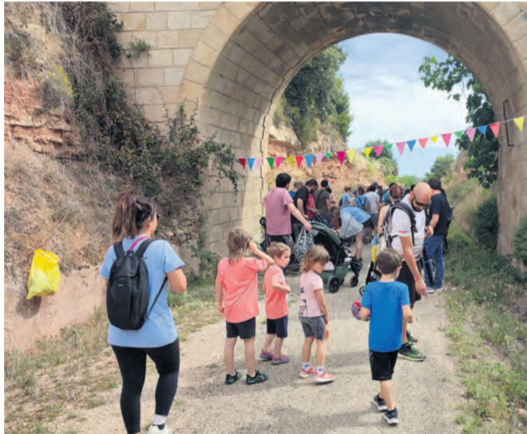
Las familias recorrieron un tramo de la Vía Verde. MJG

marcal, resumía así la jornada, "la idea era hacer una jornada de convivencia entre padres y chicos, aprovechar la Vía Verde para hacer una marcha, plantar árboles y plantas autóctonas de la zona y después hacer una co-