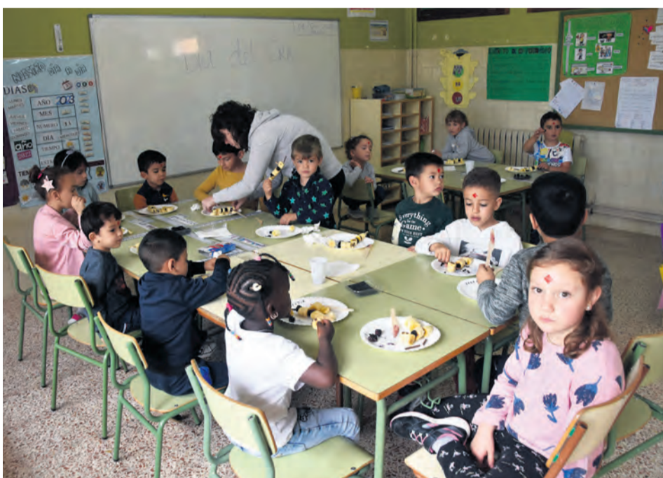
Durante el día del CRA los alumnos participaron en diferentes talleres. M. Jiménez

Las aulas de Fuentespalda, Peñarroya y Monroyo organizan una jornada llena de actividades con el objetivo de que los niños y las niñas de las tres clases se conozcan y se relacionen entre ellos