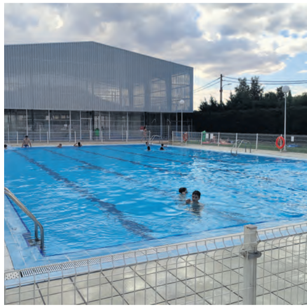
Las piscinas, en una fotografía de este sábado.

Asimismo, y desde la página web del ayuntamiento de Valderrobres, también se han publicado los horarios para los cursos de natación , que están dirigidos a