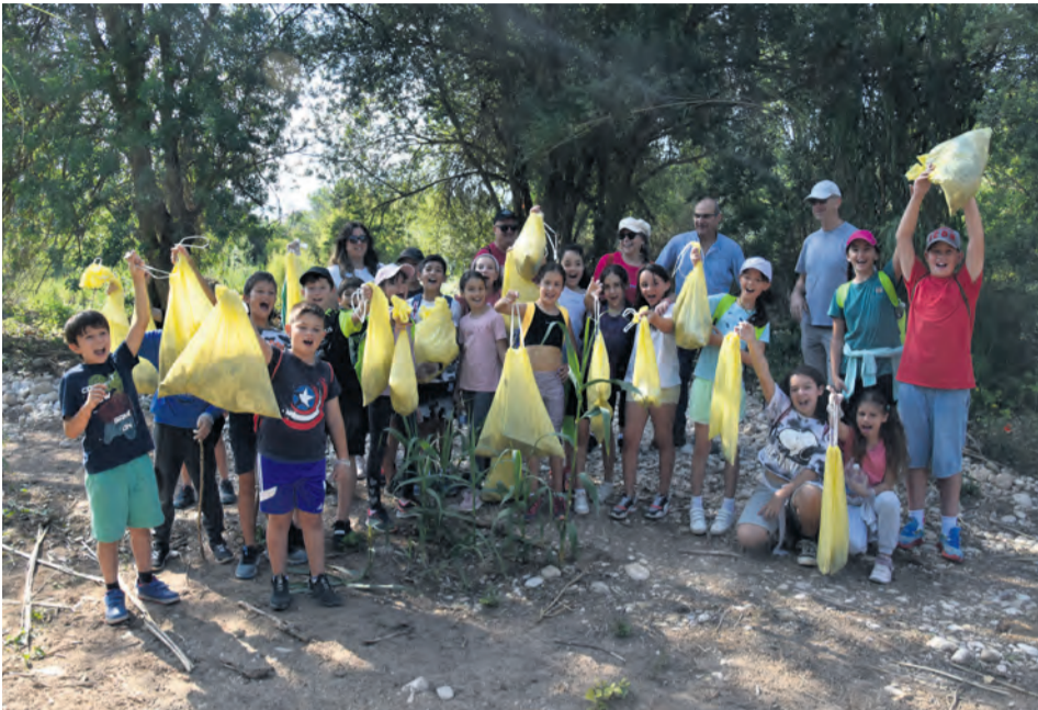
El grupo de estudiantes del CEIP Vicente Ferrer Ramos con toda la basura recogida. Marta Jiménez