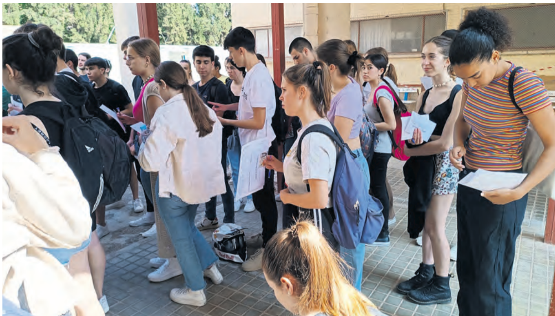
Los alumnos del IES Matarraña justo antes de entrar a los exámenes de la EvAU en el Instituto de Alcañiz. M. Jiménez