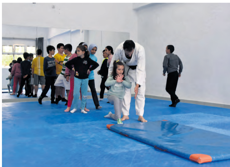
Los mayores practicaron deportes como el kárate y la escalada. M. Jiménez