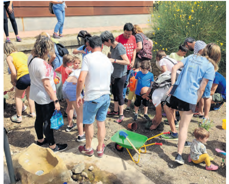
Al llegar al albergue hicieron un taller de jardinería. MJG

Para esta celebración acudieron familias de la mayoría de los 10 pueblos del Matarraña que cuentan con un aula de la escuela infantil. Y gozaron de una jor-