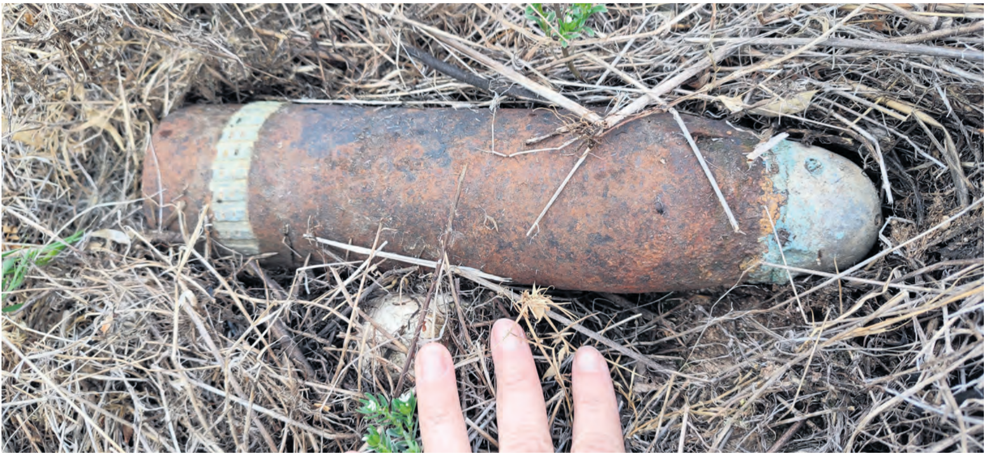
Miembros de la Guardia Civil fueron hasta el castillo de Peñarroya para retirar el artefacto explosivo. Marta Jiménez