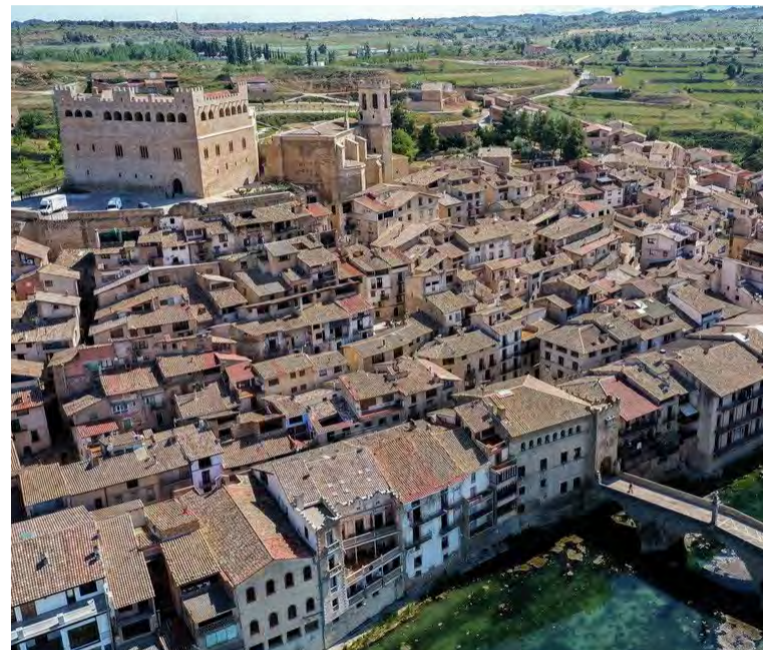
La Asociación ha premiado los 20 años de trayectoria de la Fundación. M.S.

Por su parte, desde la Fundación Valderrobres Patrimonial, su