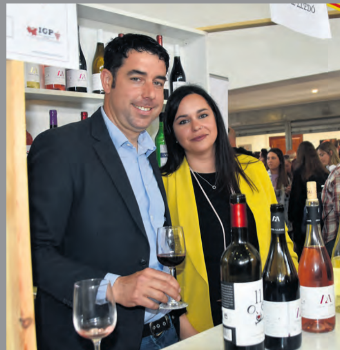
La Bodega se ha hecho con una medalla de oro y otra de plata.