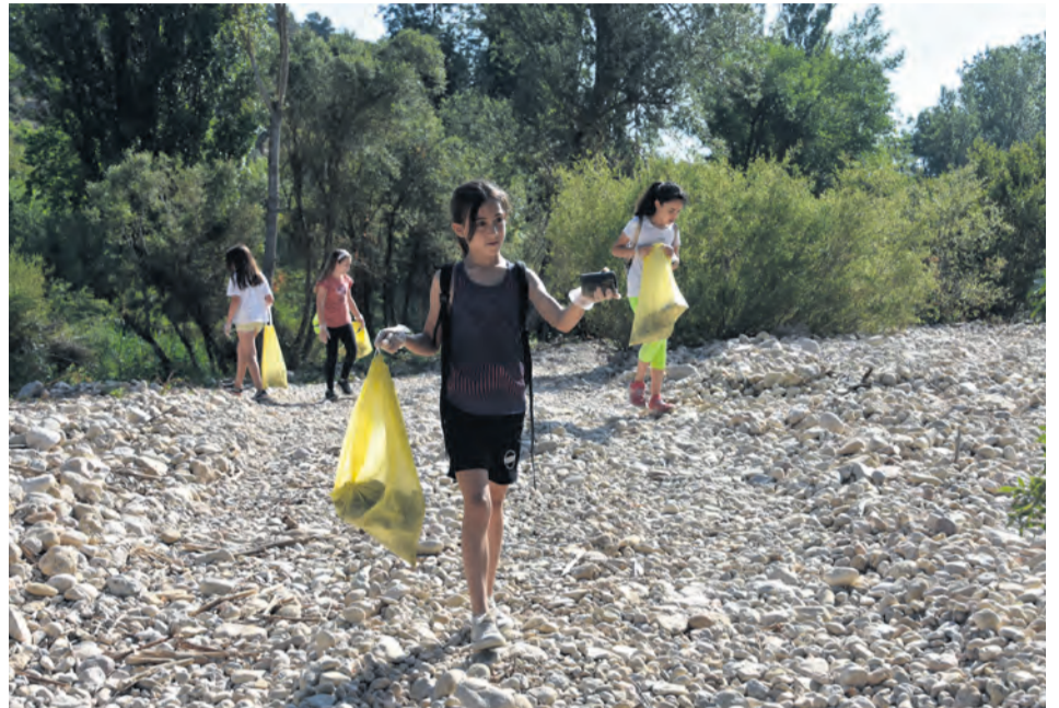
Los chavales encontraron todo tipo desperdicios abandonados en plena naturaleza. Marta Jiménez