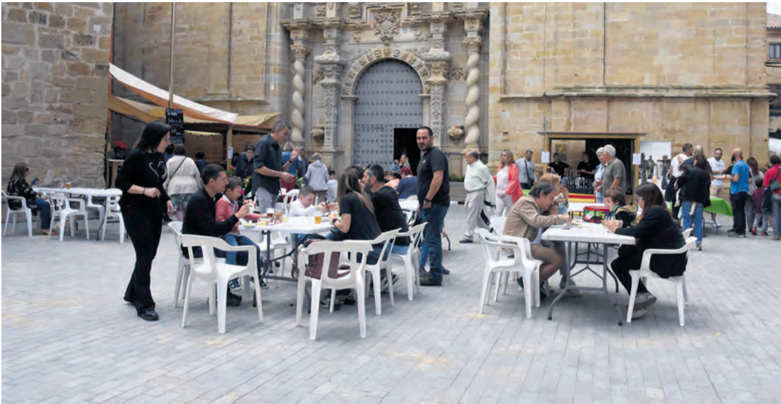
Las plazas de la localidad se llenaron de puestos de comida y de visitantes con ganas de probar platos. I. Aparicio