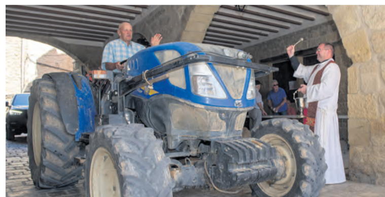
En Mazaleón también tuvo lugar la tradicional bendición. NDM

debaker Champion de la década de los 50 y, no faltaron, los inolvidables Escarabajo y el Renault 4 .