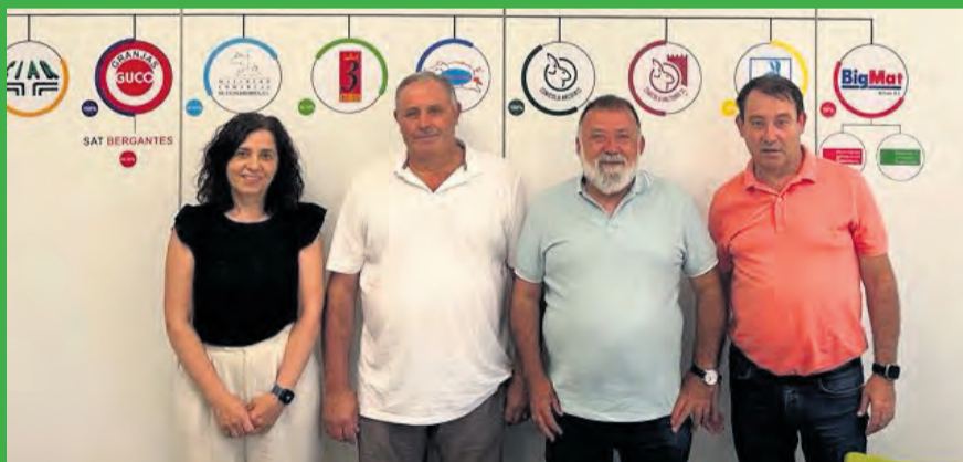
El candidato del PSOE al Congreso por Teruel visitó la semana pasada Arcoiris. NDM