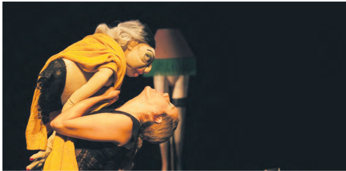
Durante el festival, el Palacio de la Encomienda acogerá diferentes pases de 'Odet', de la Cía Anna Albaladejo. NDM

La Fresneda se prepara para albergar uno de los festivales de artes escénicas más esperados de Aragón. Y es que del viernes 28 al domingo 30 de julio llega la décima edición del 'Matarranya Íntim'. El festival de vanguardia está de aniversario, y para celebrar sus diez años de trayectoria ha diseñado una programación muy especial. Bajo el eslogan 'Lo político. Vivir es un acto político', el 'Matarranya Íntim' le hace este año un guiño a Boris Nieslony, el prestigioso artista visual y performer alemán, presentando hasta 14 propuestas diferentes en La Fresneda. Un programa variado, muy cuidado, que abarca desde el clown hasta el teatro de sombras, pasando por la danza dramática, el teatro musical, la poesía escénica, el teatro de objetos y el cabaret. Un festival que dará comienzo la tarde del viernes en la Plaza Nueva con la propuesta 'Plàstic', de La Familia Política, un proyecto de teatro clown para todos los públicos que nos hará reflexionar a