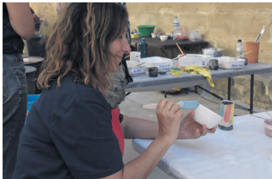
El público descubrió los secretos de la cerámica en diferentes talleres. I. Aparicio