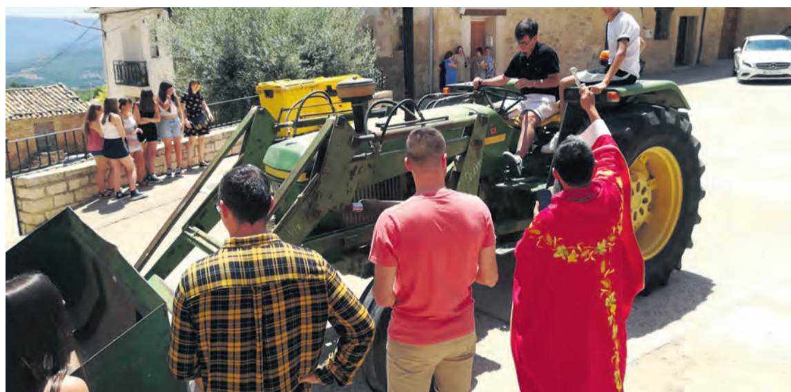
Los tractores siempre están presentes durante la bendición de los vehículos, como este en Monroyo. NDM

Ese mismo día, la Asociación de Empresarios Turísticos de la localidad organizó de la mano de la bodega Mas de Torubio una exitosa cata de vinos. 65 personas se apuntaron a esta actividad. El sábado pasado fue la traca final, con juegos tradicionales, merienda, cena y baile.