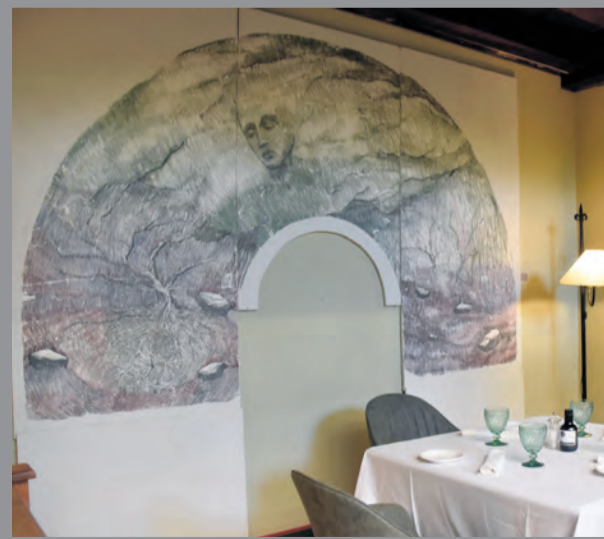
El artista se inspira en la época del renacimiento. I. A.