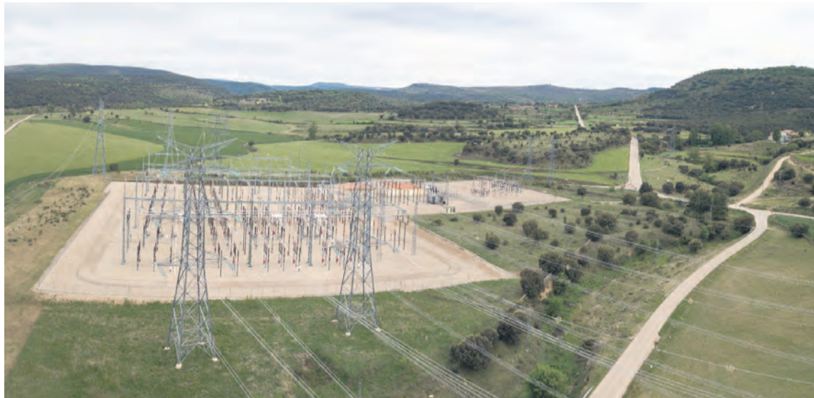
La MAT de Forestalia pretende evacuar la energía que produzca el Maestrazgo desde Fraiximeno a Almassora. NDM

El ayuntamiento de Morella , junto a los consistorios de Cincorres y Portell y asociaciones y vecindario de la comarca dels Ports, han presentado alegaciones contra la línea de Muy Alta Tensión (MAT) que pretende construir Forestalia . Se trata de una línea de evacuación desde el polígono eólico Clúster Maestrazgo de Aragón , y que afecta a las comarcas de Maestrazgo, Bajo Aragón y Els Ports. Las partes implicadas entienden que la línea de evacuación cruzaría la comarca hasta llegar a la subestación de Fraiximeno con "graves afecciones sobre la salud del vecindario, el paisaje, ecosistemas protegidos, patrimonio, biodiversidad y el modelo de vida de muchas personas que habitan y trabajan las tierras". También anunciaron que se presentará un recurso sólido para que se revise