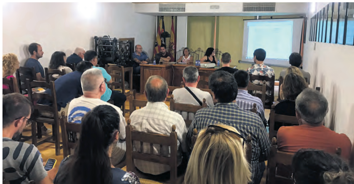
Las últimas asambleas ordinaria y extraordinaria se celebraron a finales de junio en la localidad de Ráfales.