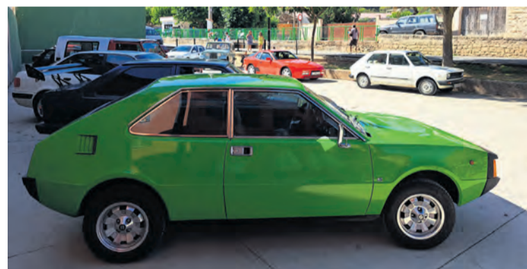
En Arens hicieron un encuentro de coches clásicos. NDM

Destacó la fiesta en Arenys, donde tuvo lugar un encuentro de coches clásicos . Allí se pudieron ver míticos coches como el Seat Sport 'Bocanegra' , un Stu-