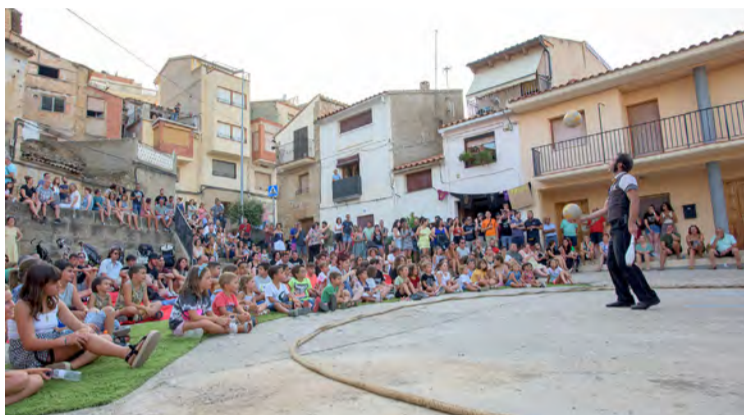
'La Nit en Blanc' forma parte del programa de Festivals del Matarranya. NDM

Desde la organización del festival destacaron que "hemos conseguido tener un cartel muy atractivo, y esperamos que todo el mundo disfrute. Siempre lo decimos: intentamos que sea un festival para todos los públicos en el que cada asistente encuentre al menos una propuesta que le pueda gustar". Como principal novedad, en esta edición la música toma mayor protagonismo que en anteriores ocasiones. "Cada año el peso lo suele llevar una disciplina artística, y en este ocasión ha sido la música ", apuntaron desde la organización, que