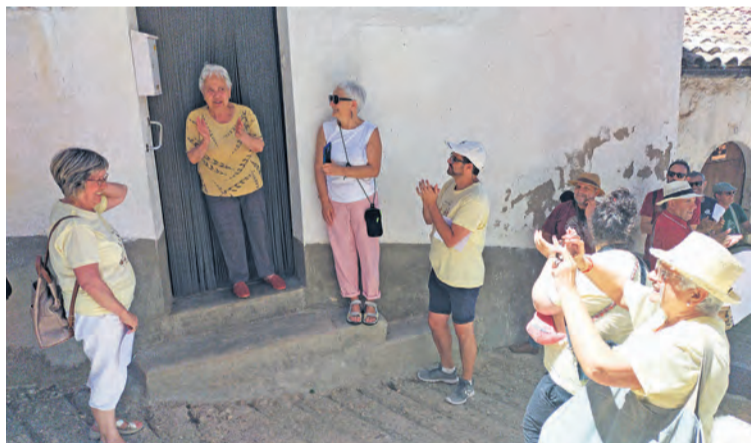
Durante la mañana hubo ronda y posterior canto de 'aubades'. R. Lombarte

Este verano se ha escuchado el río. El río de la música. Siguiendo la línea de los últimos tres años, el campus Ebre Folk ha hecho parada en el Matarranya. Concretamente, en el municipio de Peñarroya de Tastavins , donde el pasado 2 de julio se celebraron talleres de baile, un pasacalles al ritmo de tabales y dulzainas, una ronda de albañes por el pueblo, así como el bureo. A través de la asociación Cultural Tastavins y del ayuntamiento, Peñarroya se ha vestido de fiesta popular y ha indagado en la forma que tenían nuestros ancestros de bailar y de disfrutar. Por un lado, redescubriendo los pasos de los boleros y fandangos, las jotas y seguidi-