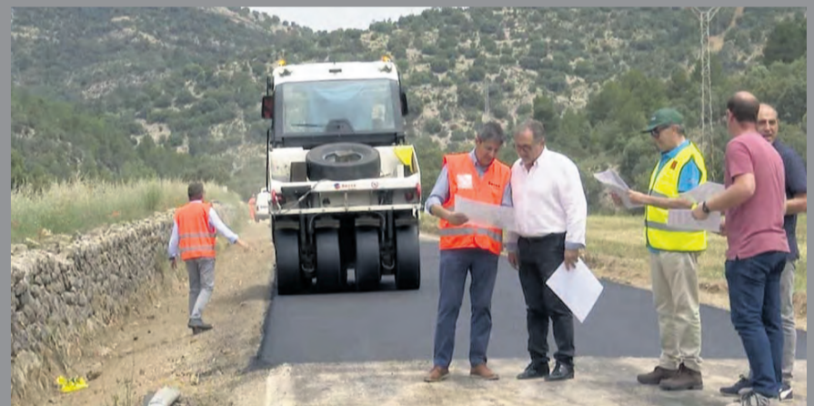
Los trabajos de asfaltado de la CV-110, vía que une Herbers con el Port de Torremiró. NDM