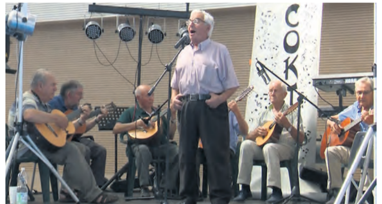
Rondalla y concierto amenizaron la tarde en el pabellón de Valderrobres. I. A.

te de FECOJUPEMA nos cuenta que "me he encontrado a un chico con el que hice la mili y no nos habíamos visto desde entonces. Te encuentras con gente que viviendo cerca, a lo mejor no ves en 10, 15 o 20 años". Una fiesta en la que