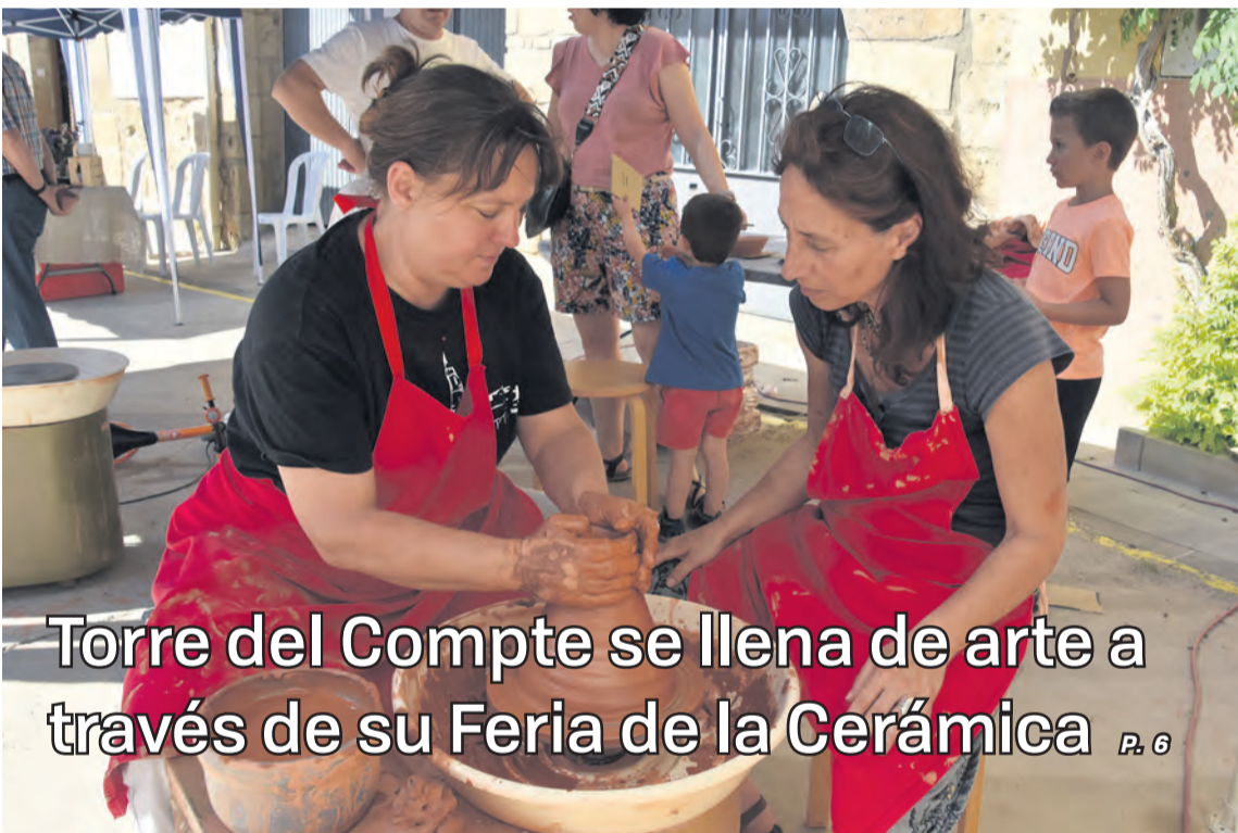
Torre del Compte se llena de arte a través de su Feria de la Cerámica P. 6

Durante toda la jornada hubo numerosos talleres de cerámica, entre ellos uno de iniciación al torno. I. Aparicio