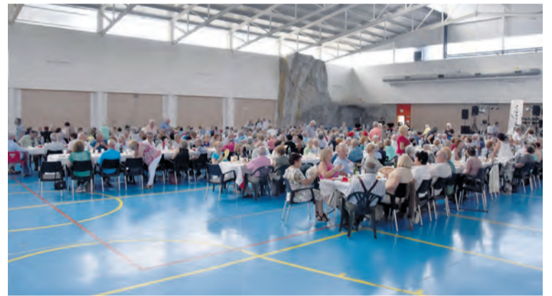
Más de 300 personas de 14 pueblos disfrutaron del encuentro. I. A.

Muchos de los asistentes tienen esta fecha marcada en rojo en sus calendarios. Y es que no solo es un día de ocio y de convivencia. Además, es una jornada de encuentro. "Aquí viene gente de casi los 14 pueblos que están en la federación, y te encuentras con gente que normalmente no ves ", afirma Gil. Esta es una fecha muy significativa para las personas que, por diferentes motivos, sólo se pueden juntar una vez al año. Como anécdota, el presiden-