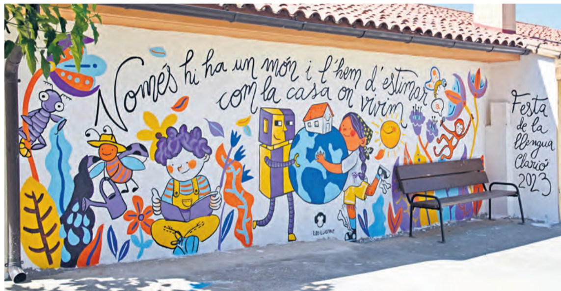
Este es el resultado final del mural que se pintó en las escuelas de la localidad. R. Lombarte

Han sido dos días muy intensos, muy participativos y que