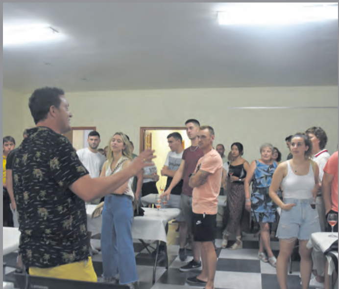
Unas 65 personas se apuntaron a una cata de vinos. I. Aparicio

Durante la fiesta de los chóferes se han visto todo tipo de vehículos, como tractores, camiones o sidecars