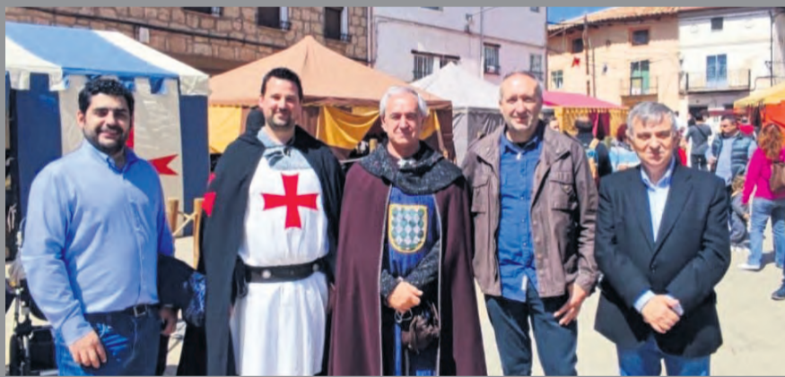
La línea de subvención está abierta a propuestas desarrolladas en 2022 y 2023. NDM