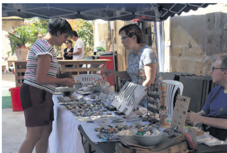
A la feria acudieron varios ceramistas para mostrar y vender sus trabajos. I. A.

La feria sirvió para contemplar piezas únicas de autor, comprar y tener experiencias diferentes,