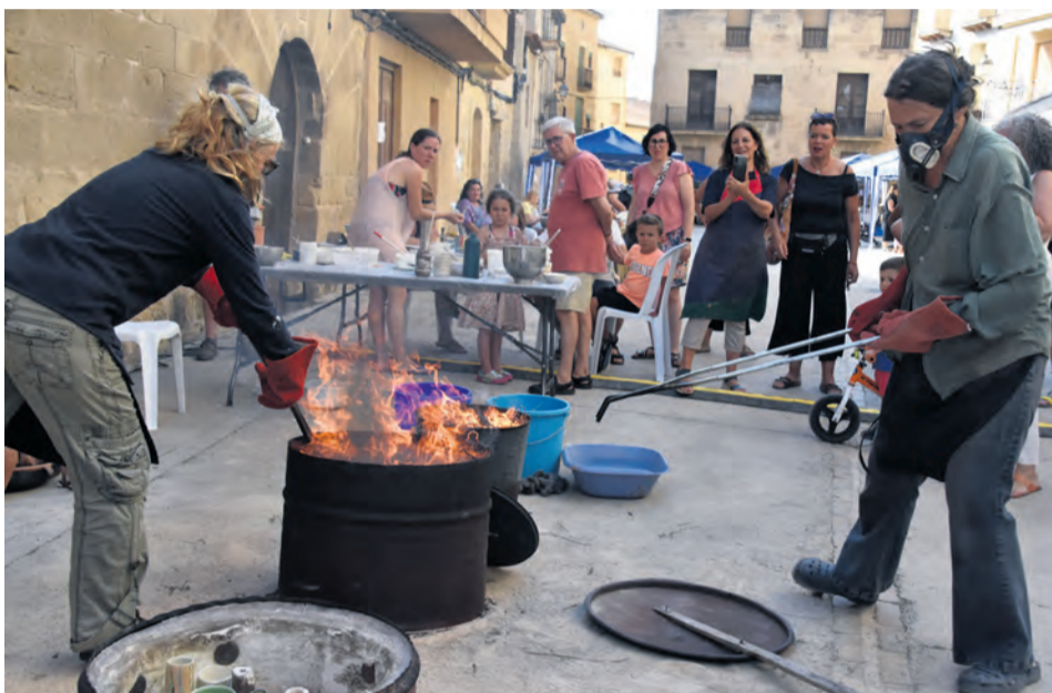
La cocción a fuego de la técnica japonesa del Rakú sorprendió mucho a los asistentes. I. Aparicio

Con talleres, paradas y muestras se dio a conocer el amplio mundo del trabajo de la cerámica