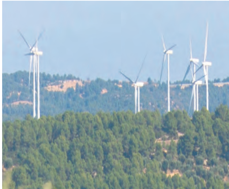
Los proyectos de Forestalia se ubican en el Matarraña y el Bajo Aragón.