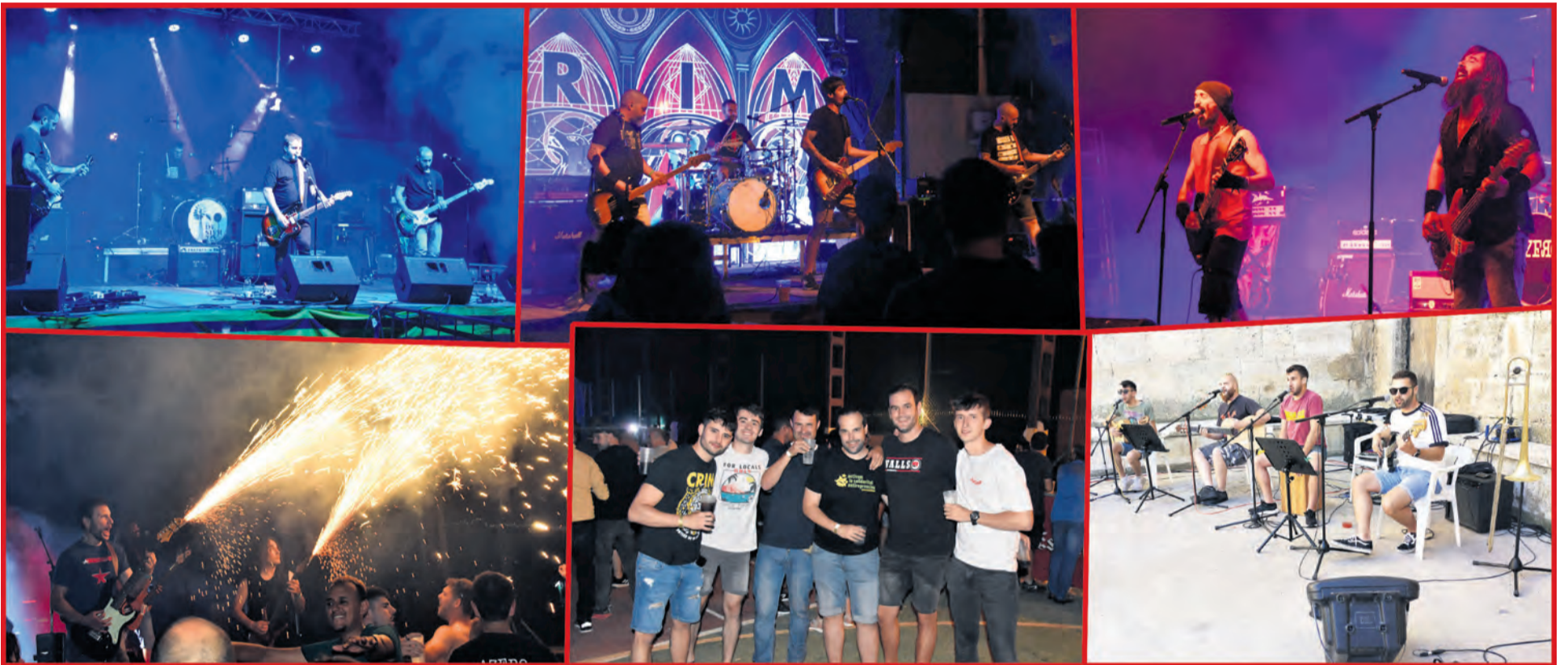
La edición número 21 del Franja Rock contó con la participación de Pimienta Molina, Del Desierto, Azero, Crim y Animal Sound. R. Lombarte