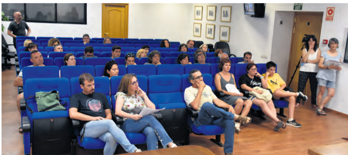
La comunidad educativa se reunió en la sede de Comarca para estudiar la oferta del catalán en el IES. R. Lombarte

El número de alumnos matriculados a esta asignatura en el IES Matarraña pasa de más del 60% al 30% en un curso