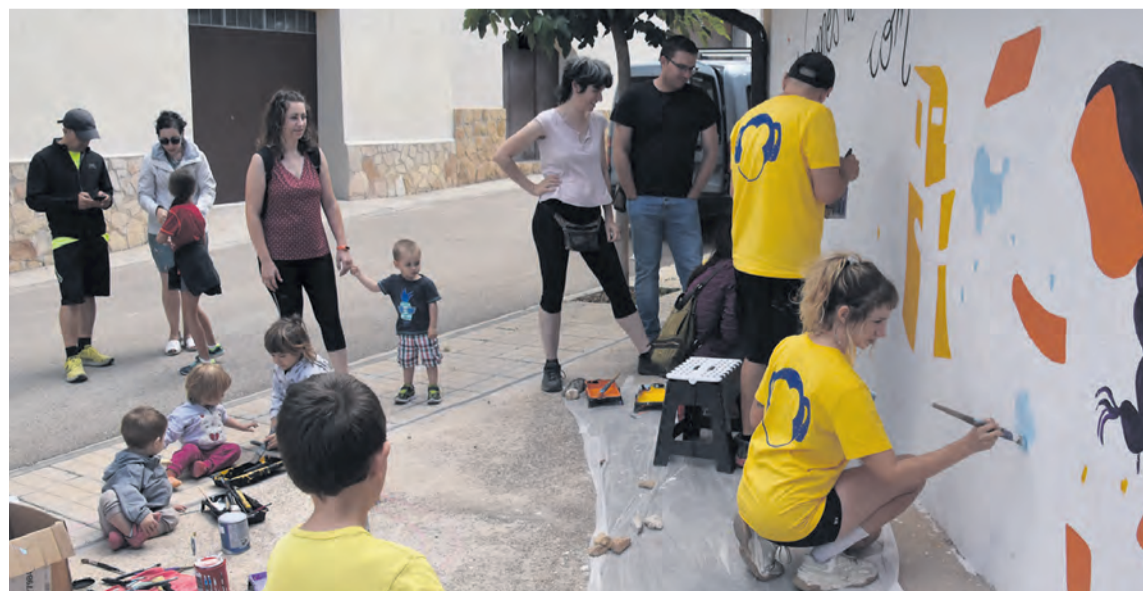
Mucha gente participó en el mural colaborativo. R. Lombarte

han atraído a mucho público proveniente de diferentes localidades de la comarca. En el taller de rap con Panxo, vocalista de ZOO, se juntaron un centenar de personas , y los niños y niñas se divirtieron dibujando portadas para las canciones del grupo de música. El sábado fue un goteo constante de gente que quería pintar un pedacito de mural.