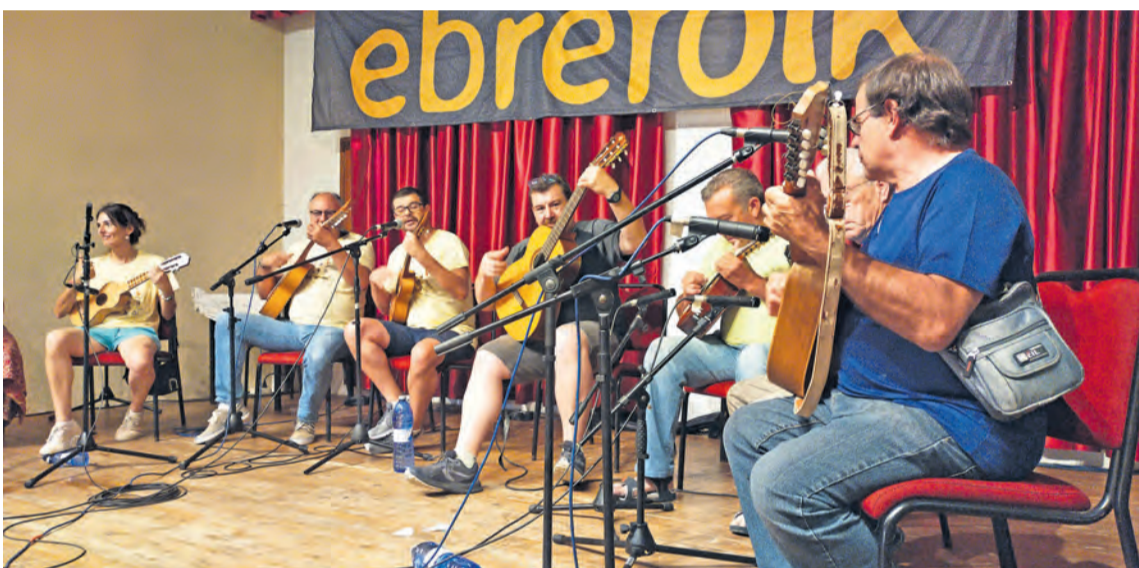
El salón acogió la tarde de bureo con las actuaciones de la Rondalla de Vila-real y la Rondalla dels Ports. R. Lombarte

El pasado 2 de julio regresó el Ebre Folk al Matarranya, que contó con talleres de baile, un pasacalles y tarde de bureo