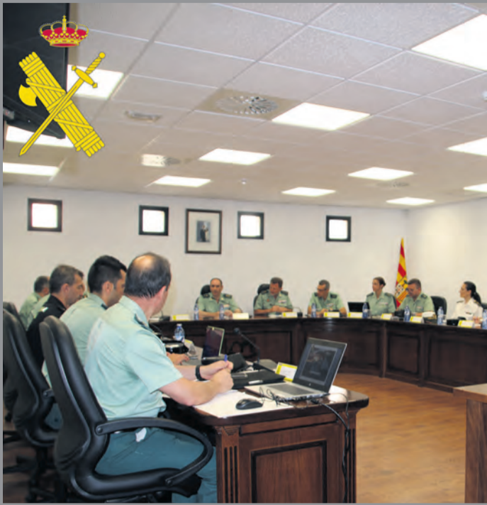
La reunión se hizo en la sala de plenos comarcal. NDM