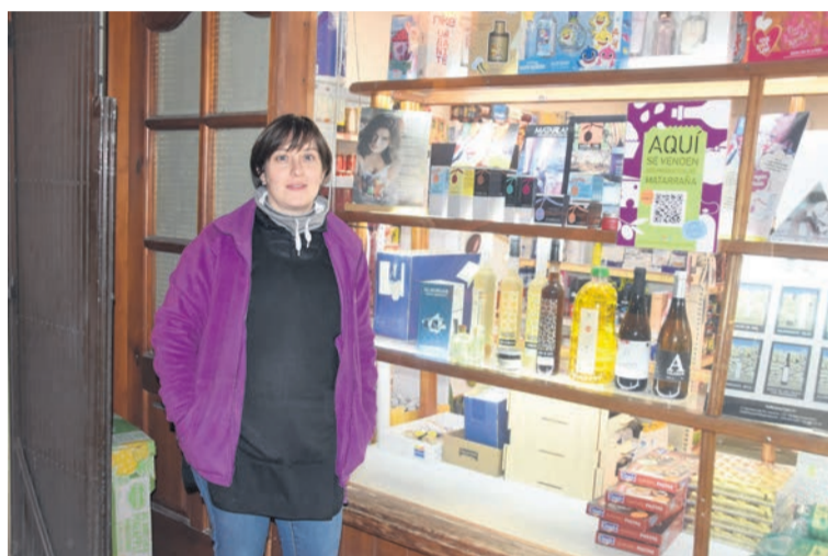
En el Matarranya cuatro establecimientos participan en la campaña. R. L.

Este año, se sortearán 14 lotes de productos "Aragón Alimentos Nobles", valorados en 50 euros cada uno y elaborados con alimentos de empresas pertenecientes a la Asociación de Industrias de Alimentación de Aragón. Cada semana se celebrarán dos sorteos, entre los consumidores que realicen compras superiores a 10 euros en los establecimientos participantes, premiando a aquellos que envíen una foto de su ticket de compra al número de WhatsApp habilitado para la campaña (663 63 92 47) y que cumplan con los requisitos establecidos. Además, al finalizar los sorteos, habrá un premio especial de un