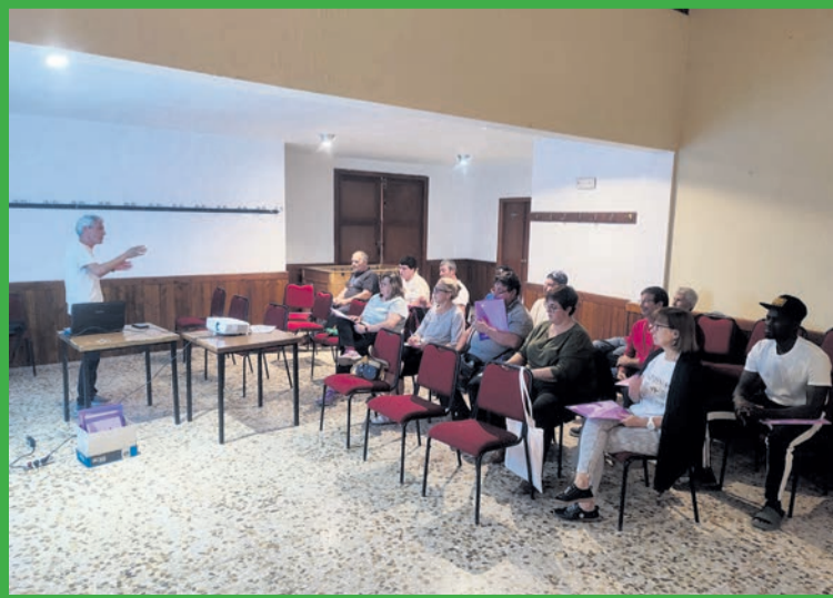
Profesor y alumnos durante el curso en Peñarroya.