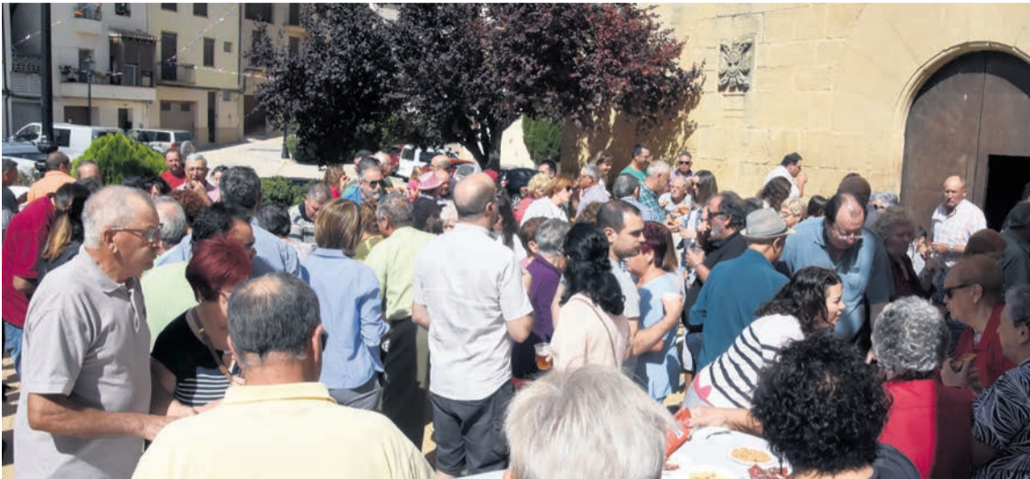
El volteo de campanas y el aperitivo popular abren unas fiestas que se alargarán hasta el lunes. I. Aparicio