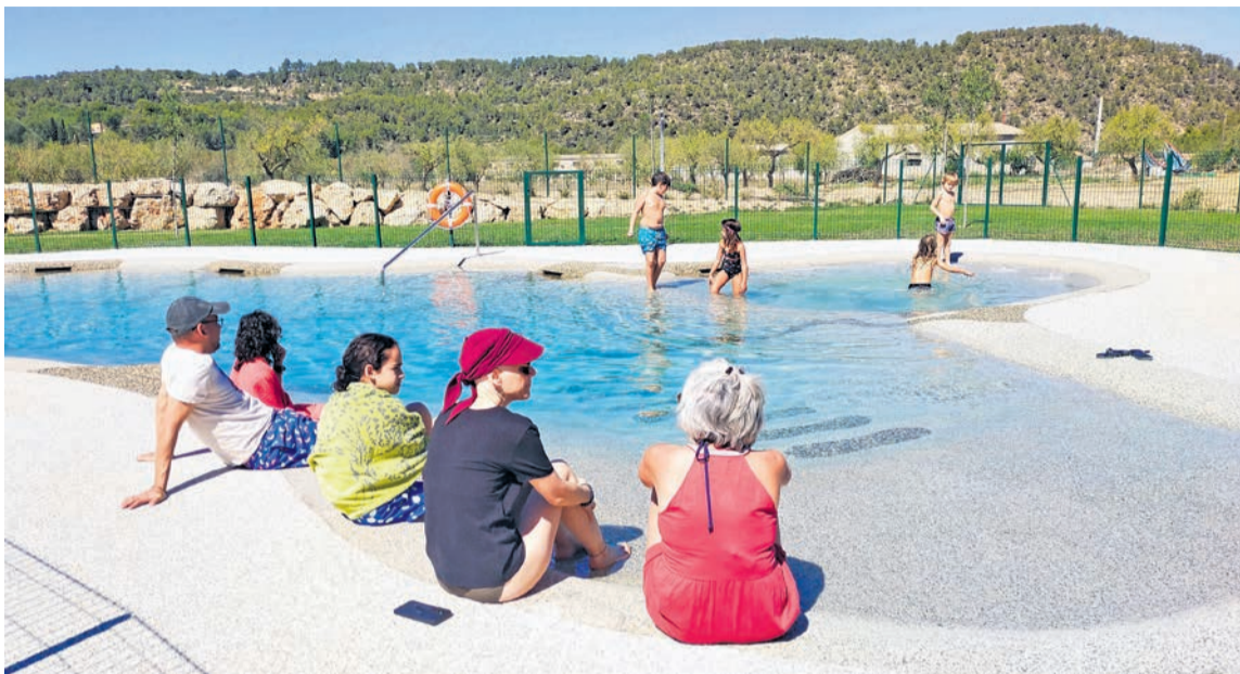
Los vecinos de Arens estrenaron las nuevas instalaciones al final del verano. R. Lombarte