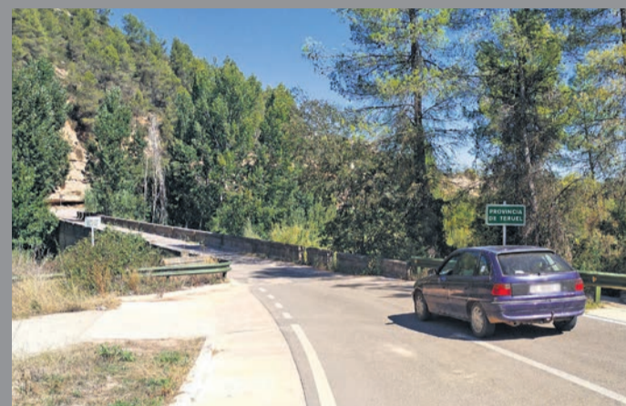
El actual puente solo permite el paso de un vehículo. M. Jiménez