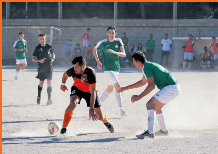
El Calaceite venció hace dos semanas ante el Valdealgofra.