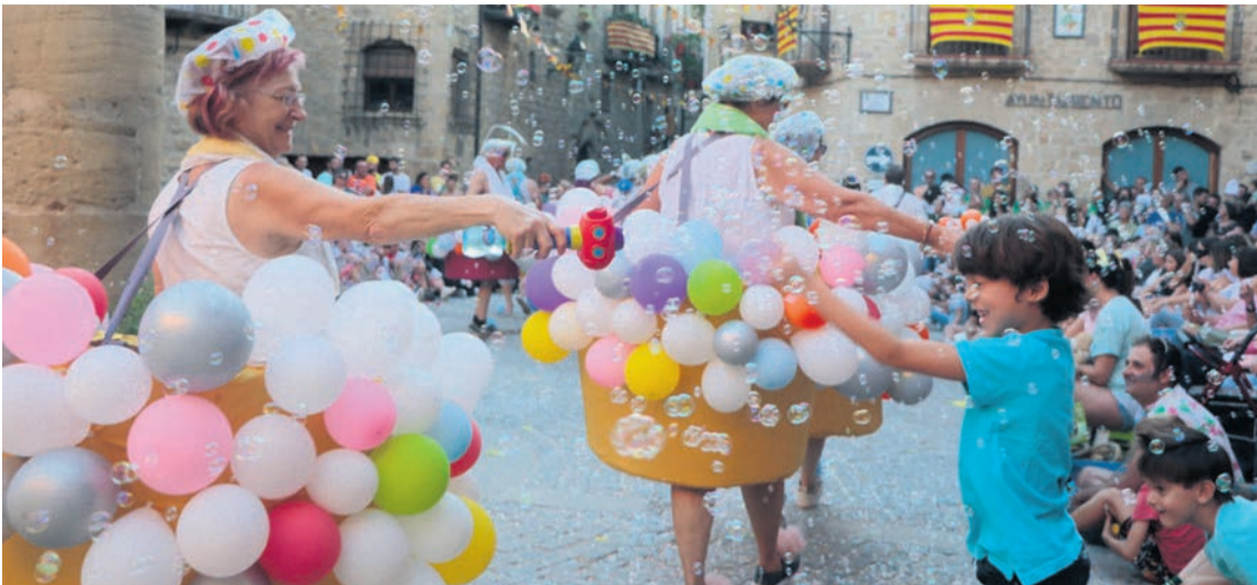
Las fiestas se alargarán durante toda una semana, del 7 al 13 de octubre. NDM