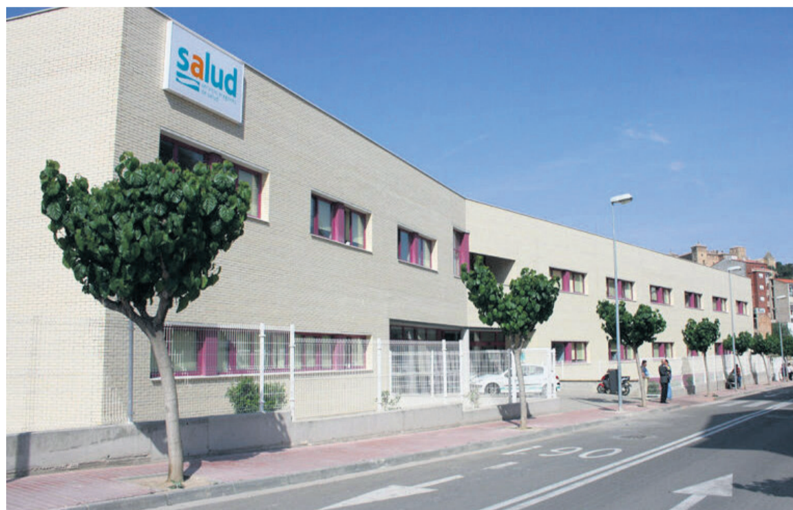
Desde atención primaria del sector de Alcañiz hacen un llamamiento a la participación. NDM

Hasta la fecha, en Valderrobres solo se la ha realizado el 35,4% de los citados, en Calaceite no llega al 46%