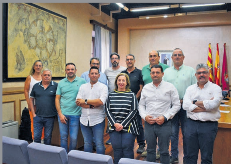
Autoridades del territorio, durante la reunión celebrada en Alcañiz.

Los alcaldes y los presidentes comarcales por cuyos territorios discurre la N-232 entre las Ventas de Valdealgofa y La Cartuja se reunieron el pasado 16 de marzo en Alcañiz con el objetivo de evaluar el grado de ejecución de la futura autovía A-68 . Se trata de una primera toma de contacto que los convocantes definieron como "muy fructífera", y en la que hubo "consenso y unanimidad" de los representantes institucionales en reivindicar una vía que consideran histórica para el territorio. En esa misma reunión, acordaron no politizar las reivindicaciones y poner en valor el trabajo de todos los alcaldes y presidentes comarcales que, hasta la fecha, han trabajado por el desarrollo de esta autovía. El encuentro contó con la presencia, en-