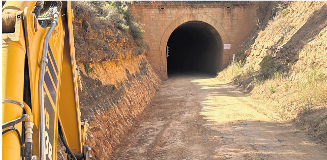
Las obras de mejora del pavimento de la Vía Verde empezaron el lunes de esta semana. NDM

El motivo del cierre se debe a la ejecución de unas obras de pavimentación del suelo. En esta actuación se llevará a cabo un tratamiento asfáltico de un tramo de poco más de 5 km y con un ancho de 3 metros. Además, se hará un tratamiento similar en diferentes túneles que atraviesa el camino, concretamente en los túneles número 11, 12, 15 y 16. Así mismo, también realizarán una substitu-