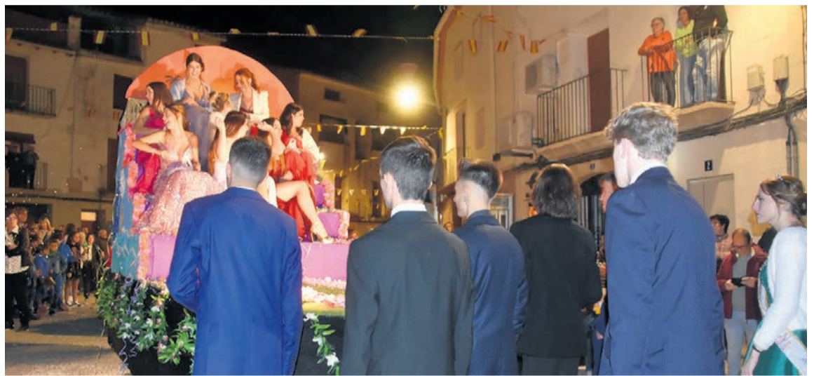
La carroza de las Reinas, seguida de los acompañantes es una de las más esperadas del desfile. I. Aparicio