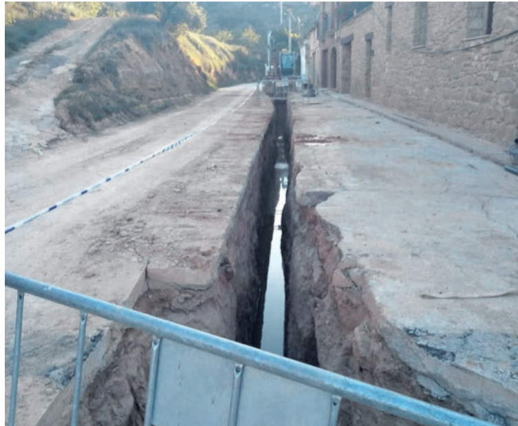
La calle Rehuerta en la primera fase de las obras. NDM

Durante las obras, la calle permanecerá cortada de 7:30 a 16:30 , pero aseguran que "por la tarde y los fines de semana va a estar abierto un carril", además, desde el consistorio avisan que "se ha modificado la circulación