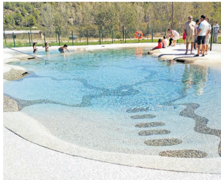
Las piscinas están integradas al medio natural. R. Lombarte