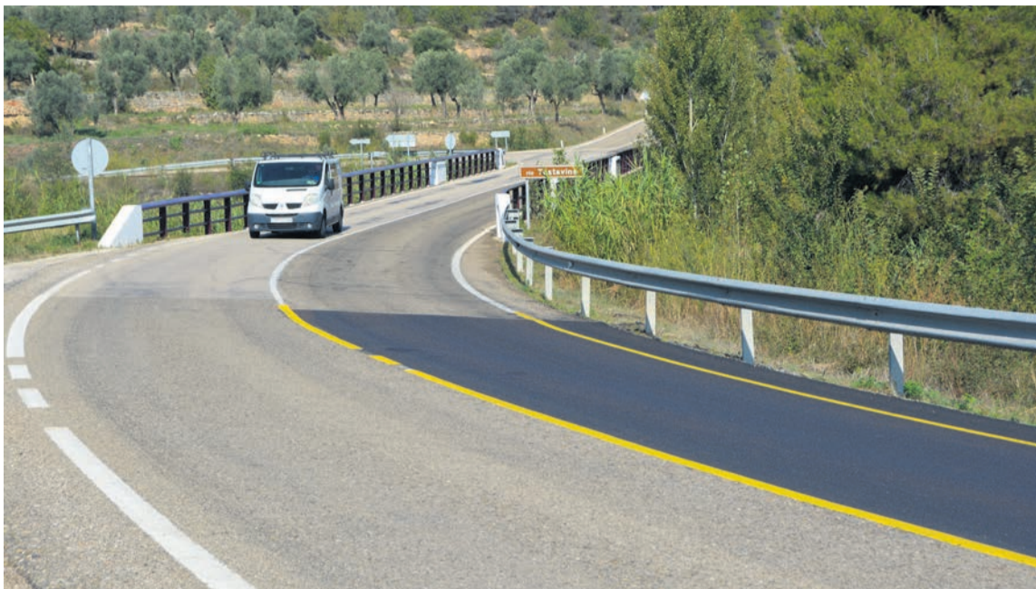
Las primeras actuaciones se han realizado desde las Ventas a Valderrobres. M. Jiménez