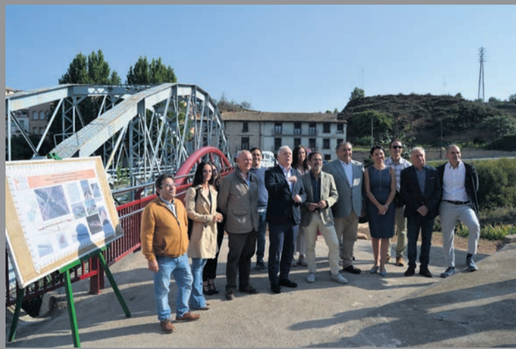
Las autoridades durante la inauguración. M. Jiménez

López destacó que "hoy es un día muy importante para los vecinos de Valderrobres, un día en el que por fin se hace justicia y se atiende una reivindicación histórica de este municipio, que es la de poder transitar peatonalmente de un lado al otro del río Matarra-