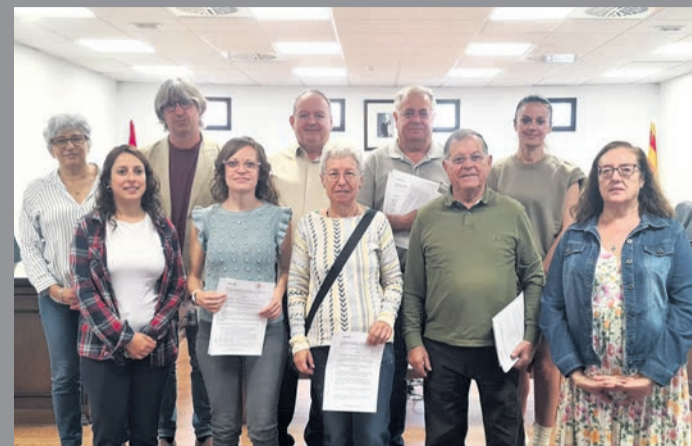
Los representantes de las asociaciones el día de la firma.

La campaña está financiada por el Departamento de Agricultura, Ganadería y Alimentación del Gobierno de Aragón y busca promover el consumo local en las áreas rurales.