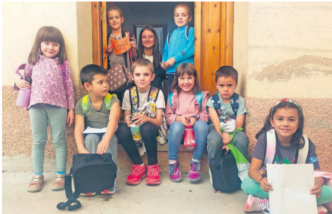
El Plan Corresponsables de Comarca en Peñarroya de Tastavins cuenta con 9 niños de infantil y primaria. R. Lombarte

El Plan Corresponsables que impulsa la Comarca del Matarraña no para de crecer. Si hace dos cursos, y como proyecto piloto, se desplegó por tres poblaciones de nuestro territorio, este curso se ha iniciado en 10 municipios y se ha traducido en trece monitores . A Cretas, Peñarroya de Tastavins y Valdehorno , que tienen este servicio desde el curso 2022/23, se sumaron el curso pasado Beceite, Calaceite, Fuentespalda, La Portellada y Mazaleón , mientras que este año el Plan Corresponsables ha llegado también a La Fresneda y Monroyo . Cada municipio cuenta con un monitor (un máximo de 10 alumnos), exceptuando Calaceite, Mazaleón y Cretas, que tienen una demanda importante y suman dos monitores. De hecho, Mazaleón ha comenzado el curso con 15 niños inscritos a este servicio, mientras que en Calaceite y Cretas los matriculados ascienden a 18. Un Plan Corresponsables que incorpora algunas novedades. La primera de ellas, que se viene impartiendo desde el primer día de clase . De hecho, y exceptuando Monroyo (que ofreció el servicio a partir del día 16 de septiembre) y Peñarroya (que empezó el cole el día 11), el resto de municipios tienen el