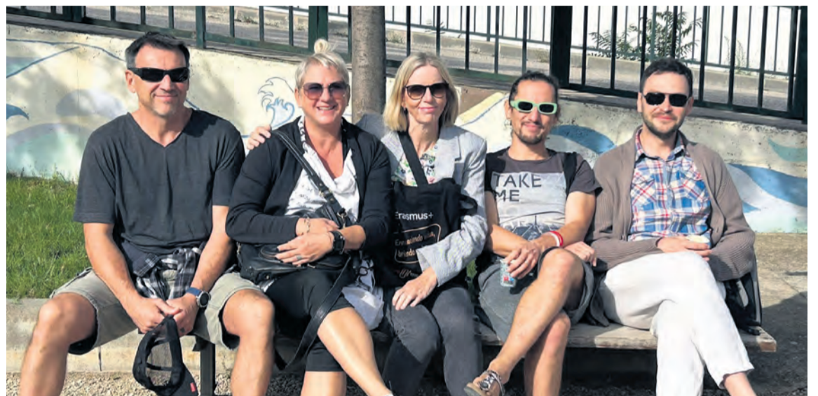
Una delegación de profesores europeos conoció el Matarraña y su centro a finales de septiembre. IES Matarraña

El instituto ya ha acogido a diferentes delegaciones de profesores. El primer viaje de alumnos será en diciembre