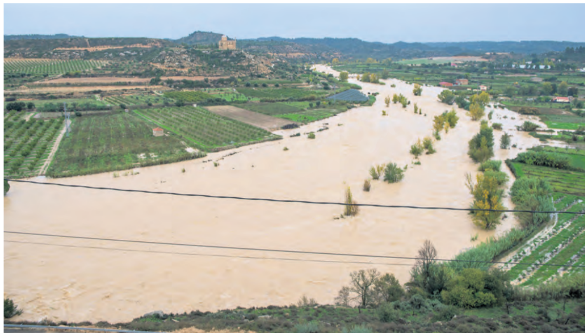
El temporal ha provocado numerosos desperfectos, especialmente el río Matarraña a su paso por Mazaleón.

Las intensas lluvias que se alargaron hasta nueve días en el Matarraña se han traducido en importantes desperfectos en nuestro territorio. Pistas forestales y caminos impracticables, inundaciones en infraestructuras públicas, paredes de piedra derruidas, una Vía Verde con tramos bloqueados, así como afecciones en el suministro de agua de boca, han sido las principales consecuencias de un intenso temporal que se ha traducido en más de 300 litros de precipitación en algunos puntos de los Puertos de Beceite. En cuanto al agua para el consumo humano, algunos municipios sufrieron restricciones puntuales en el suministro, como por ejemplo Torre del Compte, Valjunquera y Valdel tormo , si bien los principales quebraderos de cabeza los padecieron Lledó y Mazaleón . En Lledó, el martes 29 de octubre solicitaban agua a los Bomberos de Diputación porque el río Algars bajaba completamente seco . Dos días después, Lledó no podía llenar sus depósitos porque el río bajaba muy turbio. Unas restricciones que