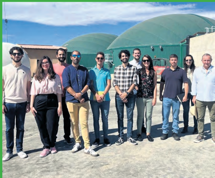
La iniciativa se realiza a través de un proyecto europeo. NDM

Life Chandelier integra tecnologías avanzadas para aprovechar residuos del sector agroalimentario, como cáscaras de almendra, hueso de oliva, restos de poda y purines, en la producción de biometano. Este biocombustible avanzado se generará en la planta de biogás de Valderrobres . Los ensayos en esta planta evaluarán la viabilidad y sostenibilidad de diversas combinaciones de desechos para