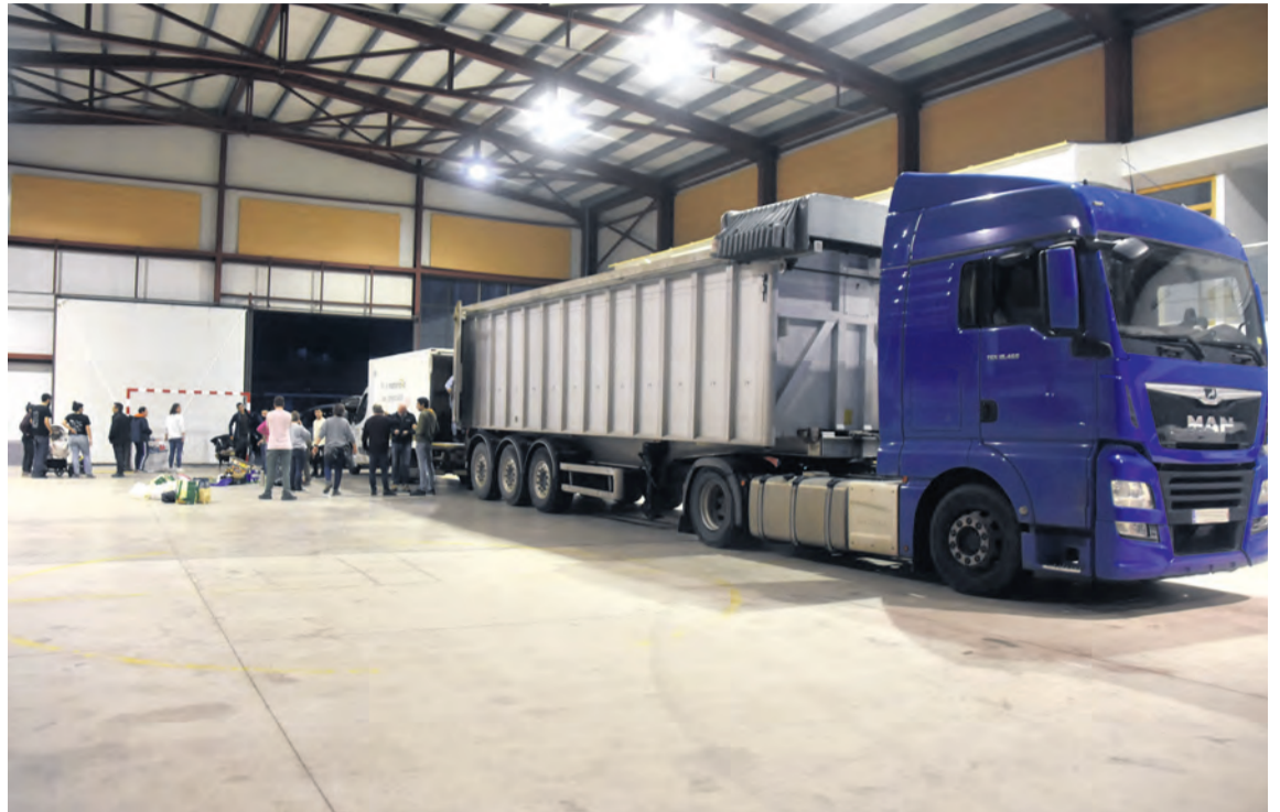
Desde Fuentespalda salió un tráiler, un camión y una furgoneta cargados con donativos para Valencia. I. Aparicio

A Valencia también se han trasladado Voluntarios de Protección Civil, bomberos de la DPT, Agentes de Protección de la Naturaleza así como Brigadas forestales de Monroyo, Valderrobres y Valdealgofra.