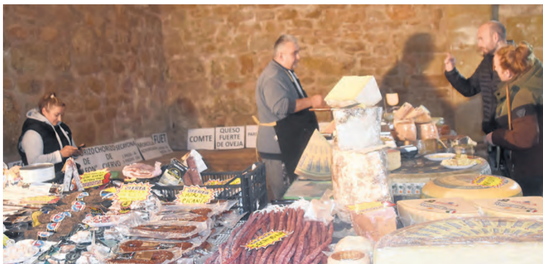
Todos los stands se concentraron en la lonja del ayuntamiento y en el pabellón para refugiarlos de la lluvia. I. A.

Una feria que estuvo muy menguada con no más que 20 stands , porque "muchos de los que ponen las paradas no han venido, por miedo al tem-