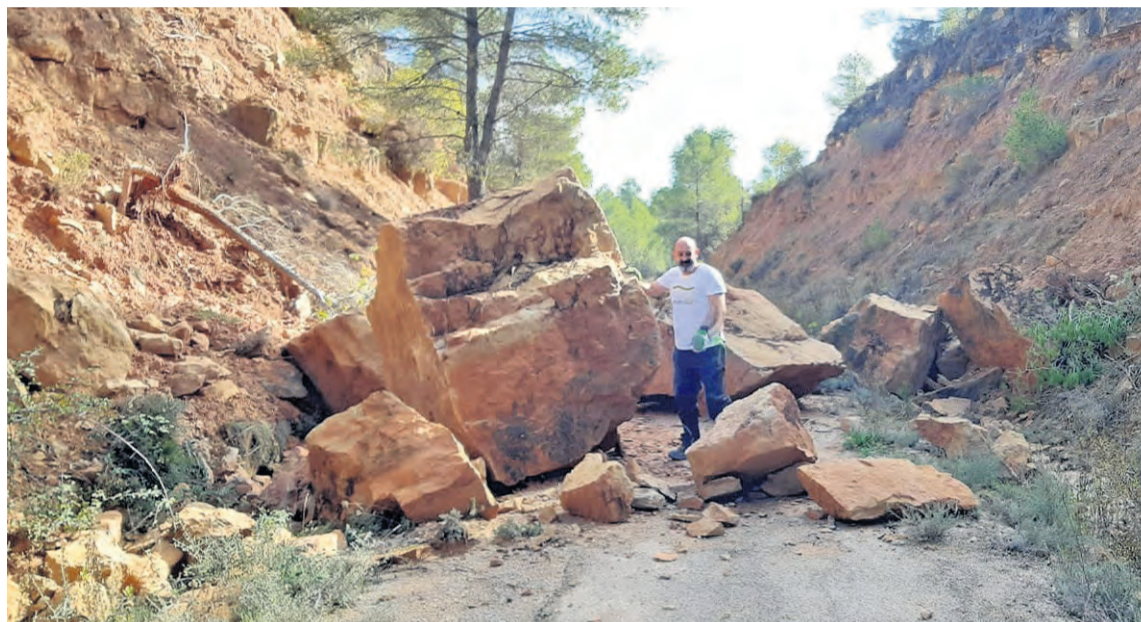
Técnico de la Comarca del Matarraña, frente a los desperfectos ocasionados por el temporal en la Vía Verde.

El último temporal ha provocado cuantiosos desperfectos a su paso por el Matarraña. Y una de las infraestructuras más castigadas ha sido la Vía Verde . De hecho, y después de que los técnicos de Comarca del Matarraña identificaran sobre el terreno buena parte de los desperfectos y destrozos ocasionados por las lluvias torrenciales, se calcula que se precisarán como mínimo 400.000 euros para revertir la situación, sanear y consolidar las zonas afectadas. De hecho, al cierre de esta edición los técnicos todavía no habían podido acceder a un tramo de 1,5 kilómetros , aproximadamente, de Vía Verde entre las estaciones de ferrocarril de Torre del Compite y Valderrobres , puesto que las acumulaciones de rocas y corrimientos de tierra impedían su acceso. Ante el estado de la infraestructura ciclista, desde la Comarca desaconsejan utilizar la Vía Verde hasta nuevo aviso. Los tramos más afectados por el temporal de lluvias son principalmente los pasos de trinchera, donde se han producido importantes desprendimientos, afectando tanto a las cunetas como a la calzada por la que discurren los ciclistas.