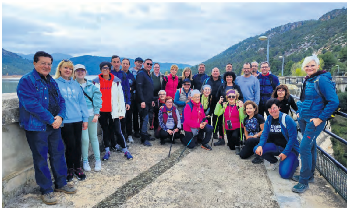
Este año la propuesta para las Jornadas Europeas fue una ruta alrededor del pantano de Pena. NDM

La cita fue el sábado, 9 de noviembre, y hasta allí acudieron alrededor de 40 personas dispuestas a disfrutar de una jornada cultural al aire libre. La ruta fue guiada y los caminantes pudieron descubrir las curiosidades del entorno, las características del pantano y las diferentes