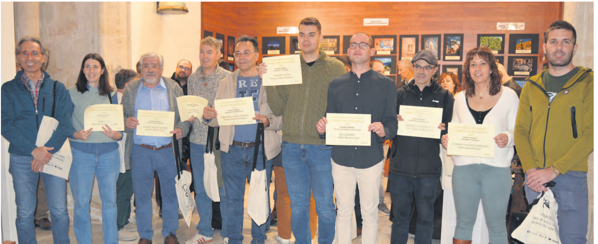
La iglesia de Ráfales acogió la exposición y entrega de premios del concurso fotográfico organizado por la Comarca del Matarraña. Marta Jiménez