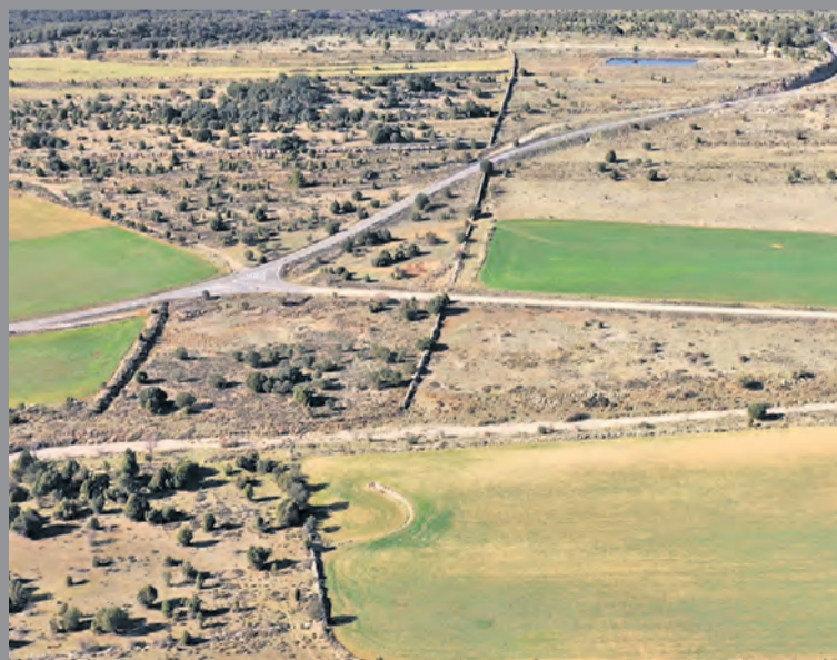
El proyecto afecta a 1.700 hectáreas de superficie. NDM

El ayuntamiento de Morella ha presentado un recurso de alzada en contra de los proyectos de planta solar y líneas de evacuación que afectan al término municipal, concretamente a las zonas de Llàcua, Llivis y Campello . El consistorio se ha posicionado 100% en contra de este proyecto, que afecta a más de 1.700 hectáreas de superficie. El recurso de alzada es el siguiente paso después de las alegaciones que se presentaron en el mes de octubre del año 2023 y también en las posteriores modificaciones del mes de diciembre. Hablamos de los proyectos de la planta solar fotovoltaica Morella Llàcua subestación Morella Solar y línea de evacuación 132kV SET Morella solar 30/132kV - SER Morella 132/400kV y planta solar Morella Llivis. A través de este recurso de alzada, desde el ayuntamiento se pide la nulidad y la suspensión del proyecto presentado,