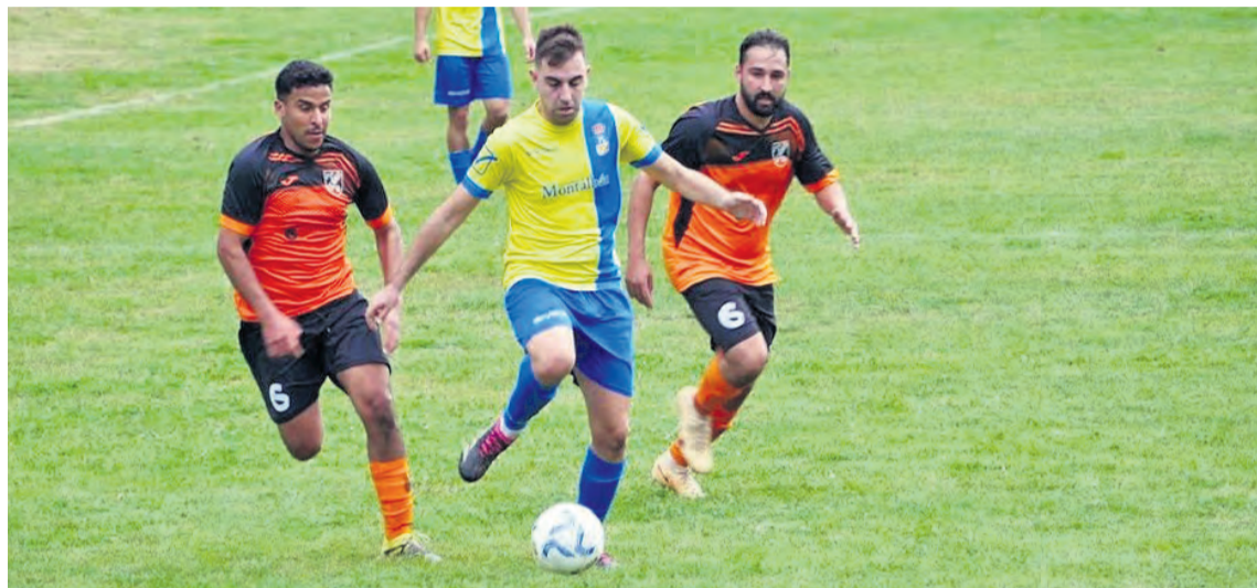
Imagen del partido que enfrentó en la jornada 5 al Calaceite frente al Polideportivo Montalbán.

Al Calaceite se le está dando mejor jugar a domicilio que ante su afición. Así lo reflejan los resultados y así lo corroboró en la última jornada de liga. Victoria contundente del equipo entrenado por Rafa Boira ante el Utrillas (0-3), un resultado que le vale para sumar la tercera victoria a domicilio de la temporada y escalar posiciones. De hecho, todos los puntos que ha sumado Calaceite esta temporada (9 en total) los ha obtenido lejos de su estadio. Tras tres semanas sin vestirse de corto, puesto que el temporal obligó a suspender el partido de la jornada 6 ante el Samper de Calanda , Calaceite volvió con fuerza a la competición. El viaje por tierras mineras le sentó bien. Los del Matarraña se adelantaron en la primera mitad gracias a un gol de Óscar Boira . Nada más empezar la segunda parte, Calaceite amarró el resultado gracias a un tanto de Sergi Prats , máximo goleador de la categoría. En el tramo final del partido, los del Matarraña redondearon la victoria gracias a otro gol de Prats , que lleva 8 este año. Una victoria que le vale para subir a la novena posición, empatando