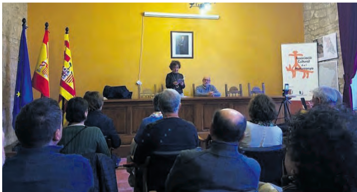
El ayuntamiento de Torre del Compte acogió las principales propuestas de la jornada. J. L. Camps

Torre del Compte fue el pueblo anfitrión de la edición número 31 de la 'Trobada Cultural del Matarranya'