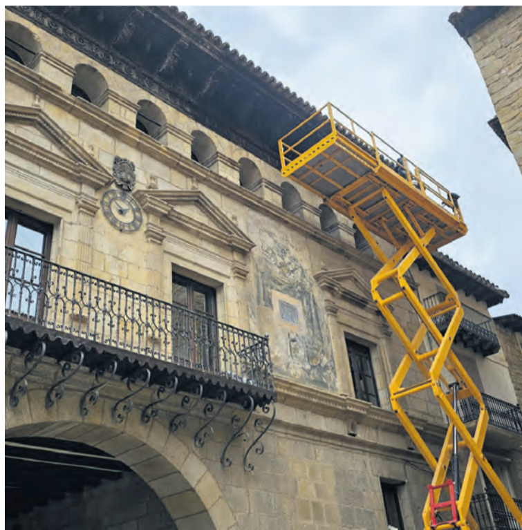
La actuación ha empezado por el lateral de la calle La Paz.