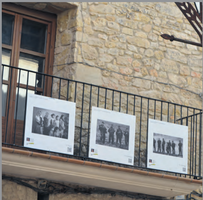
La exposición estuvo en Ráfales durante su feria. M. JIMÉNEZ