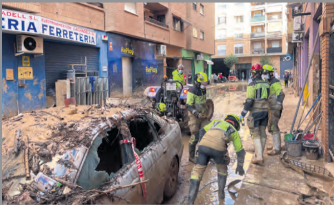
Los bomberos han hecho labores de achique y desescombro. NDM