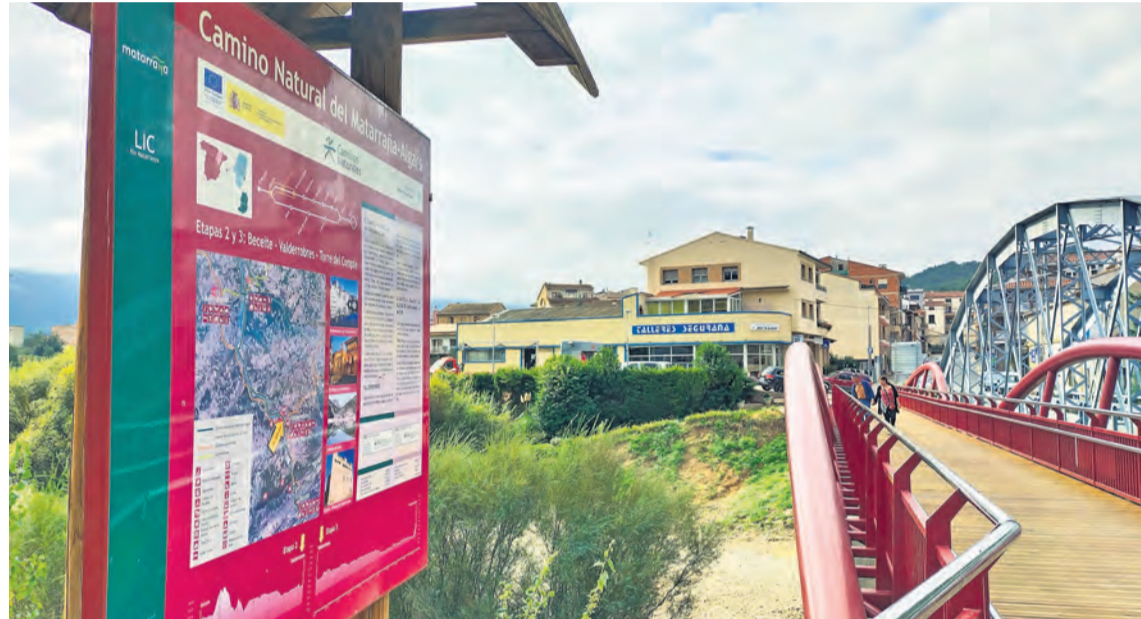
Cartel informativo del Camino Natural Matarraña-Algars a su paso por el núcleo de Valderrobres.