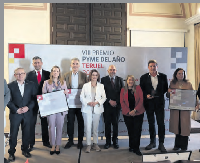
Fotografía de grupo de los premiados PYME 2024. NDM