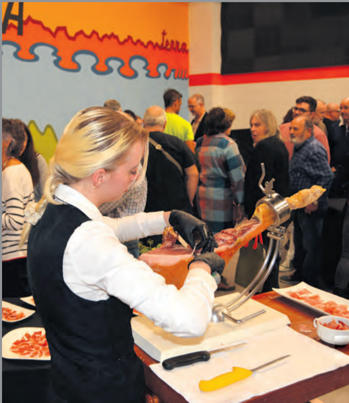
Al acto acudió un gran número de invitados. M. Jiménez