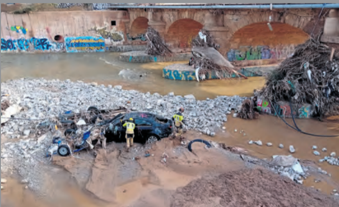
El operativo aragonés trabaja asignado en Catarroja. NDM