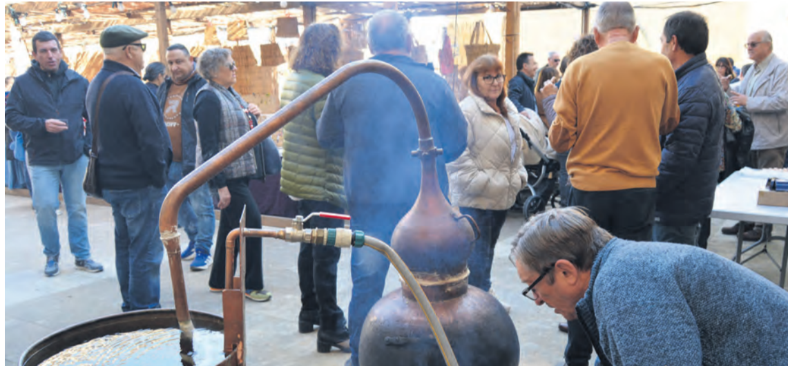
Un año más, el alambique se colocó en la plaza de la localidad dónde se realizó el tradicional aguardiente. M. J.

Entre los stands se podía encontrar desde artesanía, ropa o complementos , hasta productos de alimentación , en una edición en la cual, desde el consistorio, afirman que es cada vez más difícil encontrar feriantes. Y es que "siempre intentamos traer un poco de todo: productos cárnicos, quesos, artesanía, y creo