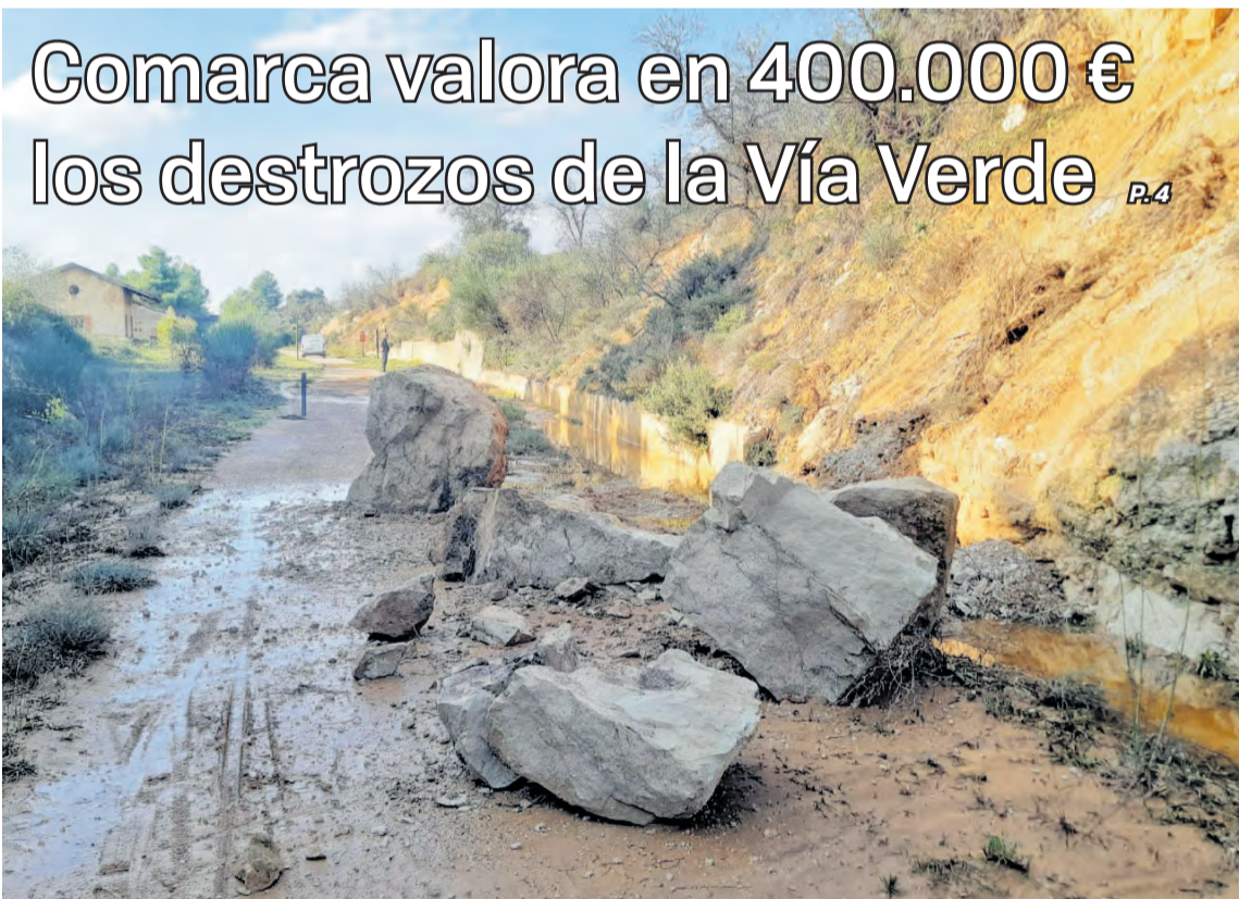
La infraestructura ciclista ha sufrido numerosos desperfectos como consecuencia del temporal de lluvias. NDM

Días de hermandad y de tradición en las ferias de Monroyo y Ráfales P.10