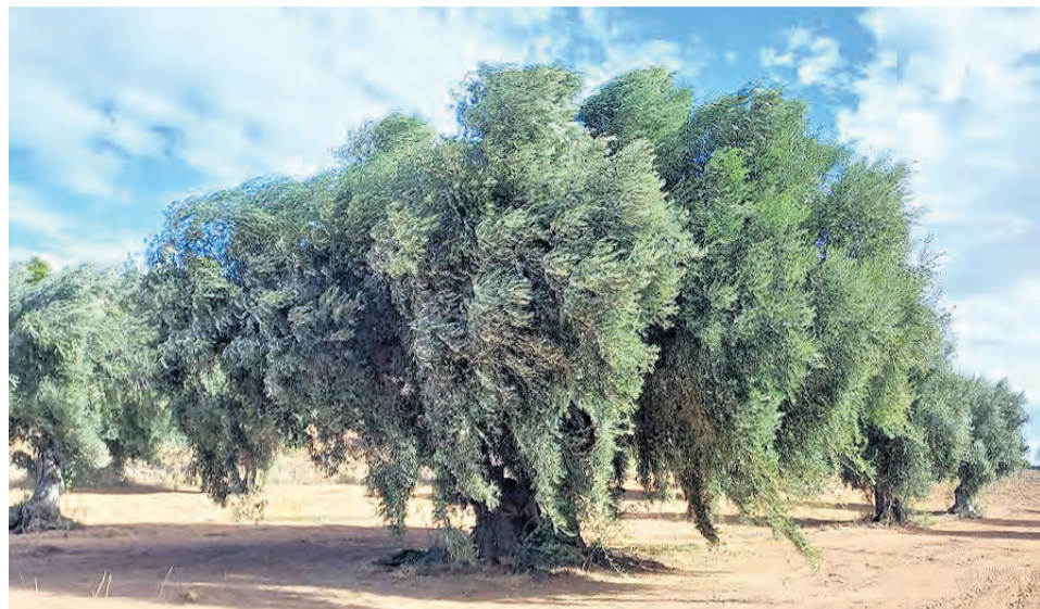
La 'llorona' es una de las nuevas variedades, y que se ha identificado en el término de Lledó.