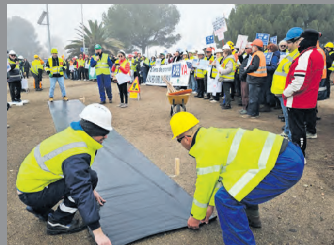
El sábado una manifestación reclamó el inicio de las obras. NDM