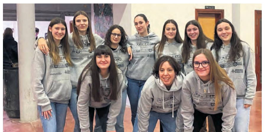
Las Antenas Informativas prepararon unos torneos de ping pong y fútbolín para todos los públicos en Cretas, como actividad de Navidad y de dinamización juvenil. NDM