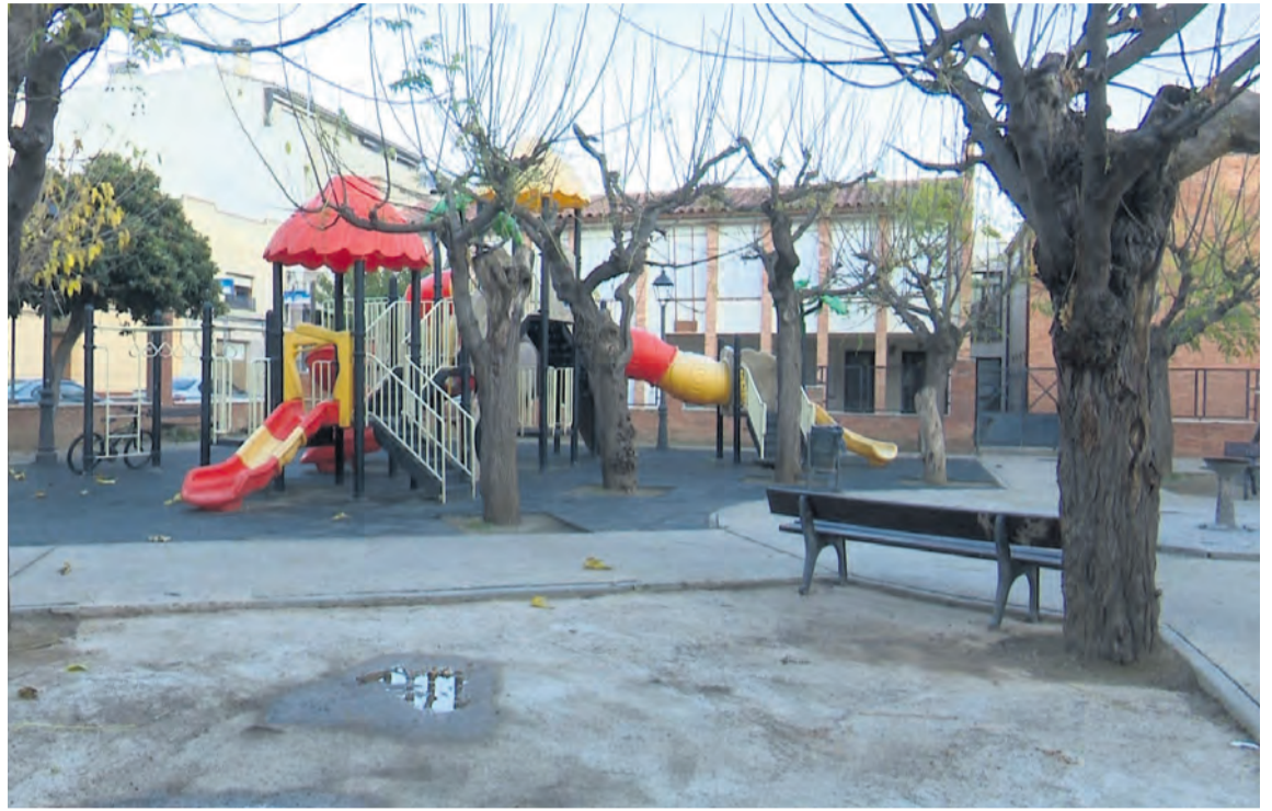
El parque infantil y la calle Madrid, donde descansa el colegio, contarán con un buen saneamiento en 2025. I. A.

Por otro lado, hay que tener en cuenta el canon y los costes. De hecho, en poco más de un año, el precio de la entrada de los residuos en vertedero prácticamente se ha cuadruplicado, por lo que reciclar mejor y eliminar la materia orgánica del recipiente RSU es el reto más importante. Rodríguez remarcó que "hace dos años, la tasa era de 28,76€ la tonelada. Ahora pagamos cerca de 100". Esto "ha venido impuesto por los costes de explotación de vertedero, por la aplicación de la ley de residuos, que supone un impuesto de 44 euros, y el coste adicional de más 13 euros por la emisión de gases de efecto invernadero". Por lo tanto, cuanto más reciclemos menos pagaremos. Por un lado, porque reducirá los kilos que acaban en el vertedero. Pero también porque "nos pagan por el reciclaje de cartón y envases".