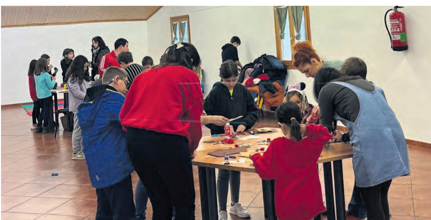
En Fuentespalda, durante todas las vacaciones de Navidad, se han realizado diversas actividades, películas, hinchables, karaokes y manualidades, entre otras. NDM