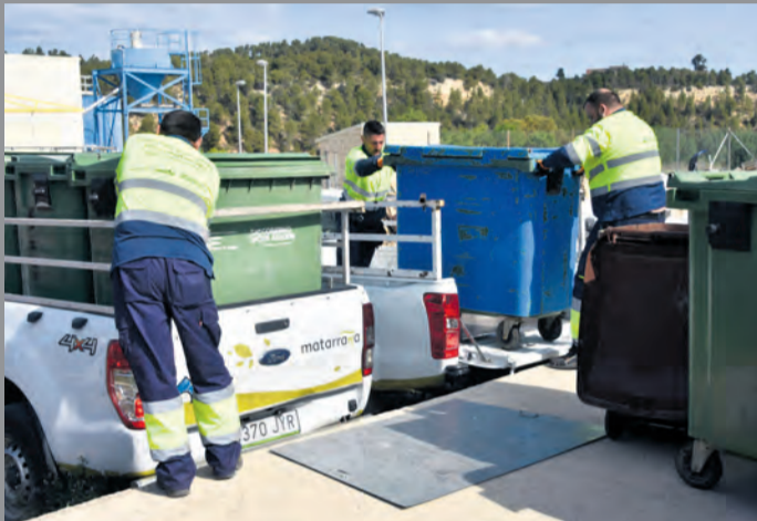
El Matarranya cuenta con tres sistemas de recogida selectiva. NDM