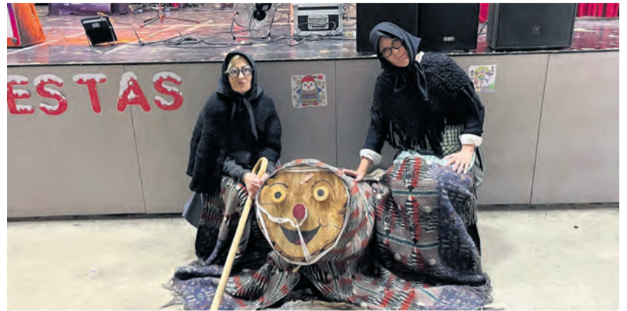
El 21 de diciembre los Pajes de los Reyes recogieron las cartas de los niños de Peñarroya, en una tarde en la que hubo también Tronc de Nadal, pinchos, orquesta y discomóvil. NDM