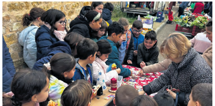
Los alumnos del CRA Matarraña (Mazaleón, Calaceite y Valdelatoro) organizaron un mercado navideño en cada localidad. Imagen de los niños calaceitanos. NDM