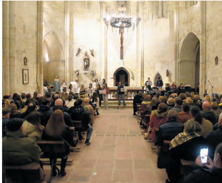
Los conciertos solidarios se vivieron en la iglesia de Valderrobres.