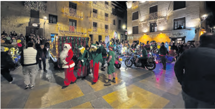
Papá Noel llegó la tarde del 24 de diciembre a las calles de Valderobres acompañado de unos 20 elfos moteros en una cabalgata muy vistosa y llena de magia. NDM