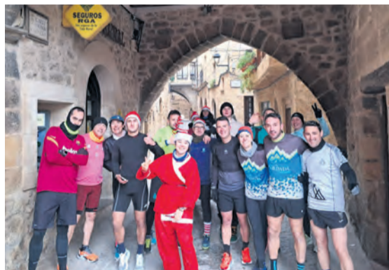
La plaza de Cretas fue el epicentro de la carrera. M. J.