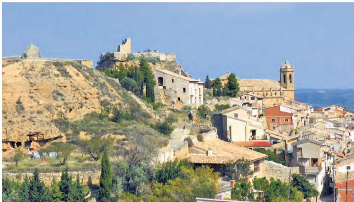
El skyline de La Fresneda, con un capdevila perfilado por el castillo, el cementerio medieval y la iglesia parroquial.