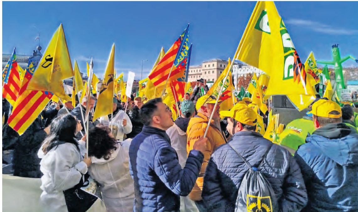
Fotografía de las protestas protagonizadas en Madrid, donde asistieron agricultores de nuestras comarcas. NDM

Después de unos meses de enero y febrero de 2024 muy calientes, el sector primario cerró el año con una nueva movilización. De hecho, agricultores y ganaderos de toda la geografía nacional participaron el lunes 16 de diciembre en una manifestación convocada en Madrid como respuesta a los acuerdos entre la Unión Europea y Mercosur, y que desde el sector primario consideran que se va a traducir en la llegada masiva de alimentos básicos que utilizan métodos de producción que en Europa están completamente prohibidos desde hace años, generando "competencia desleal" entre agricultores, a la vez que repercutirá en el consumidor final. La manifestación fue convocada por ASAJA y COAG. En ella asistieron distintos agricultores del Bajo Aragón y el Matarranya. De hecho, desde la provincia se organizó un autobús que no se llenó. Sin embargo, la movilización fue importante y en la manifestación asistieron profesionales agrarios de todas partes. La proliferación de acuerdos de libre comercio entre Europa y terceros países, como América Latina o Marruecos, son el detonante de un 2024 muy tenso entre las organizaciones agrarias y la administración pública, sea la Unión Europea, el Gobierno de España o el Gobierno de Aragón. Desde el sector entienden que