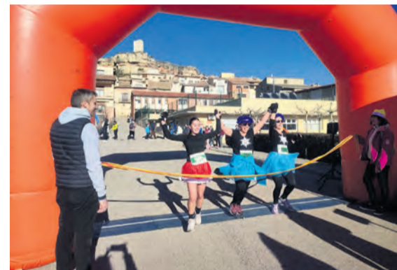
La San SilvesTrail de Monroyo se celebró el sábado. I. A.