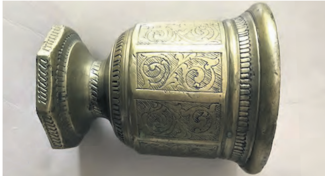
La colección consta de piezas de gran valor artístico y se exhibirá en las galerías del castillo. NDM

La colección incluye morteros desde la Edad Media hasta el siglo XX, todos de bronce y de tamaños muy variados. Este tipo de morteros, elaborados por los mismos operarios que realizaban las campanas, servían para la preparación de la comida y también tenían usos en farmacología. Al tratarse de elementos útiles, no tienen la categoría de obra de arte. Sin embargo, y tal y como apuntó el director de la funda-