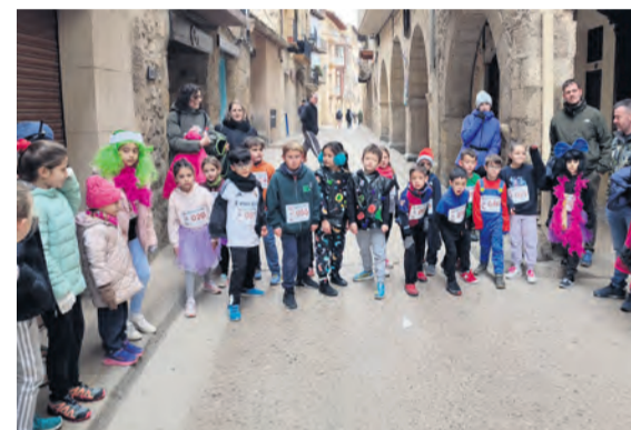
Valderrobres no faltó a su cita deportiva y festiva. M. J.