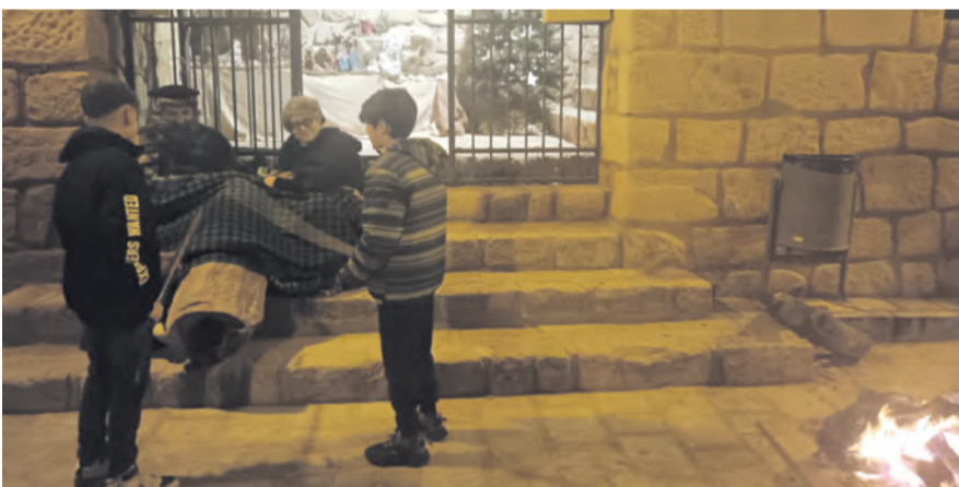
Pese al frío, en el municipio de Mazaleón también se invitó a los niños a hacer 'cagar' al Tronc de Nadal con su 'vara', una tarde en la que también disfrutaron los adultos. NDM