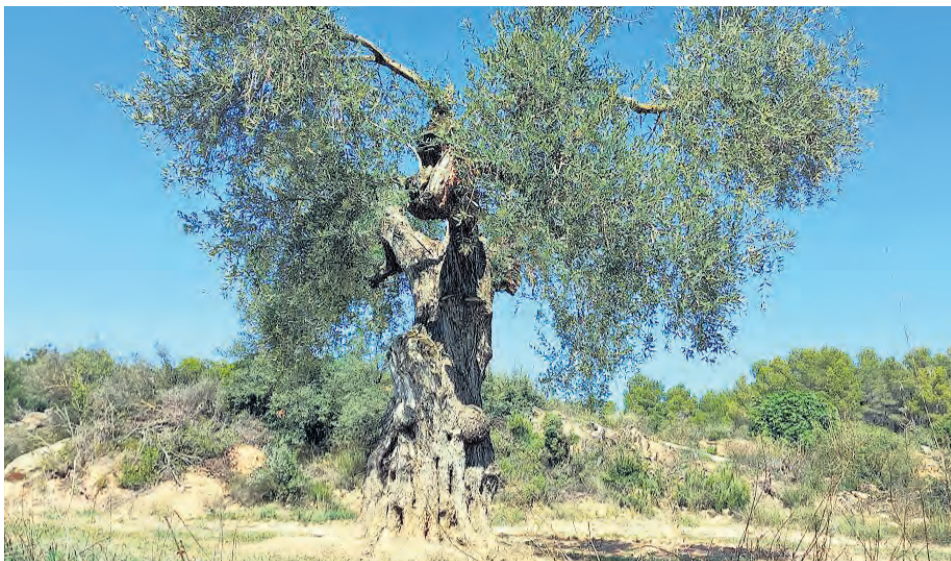
La 'Iolencia' es una nueva variedad de olivo que el proyecto ha localizado en Arens de Lledó. NDM