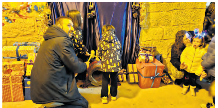
Durante las fiestas de Navidad, las familias de Lledó se congregaron en los porches del ayuntamiento para que los niños hicieran cagar el Tronc de Nadal. NDM