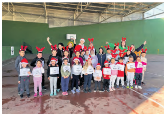
La escuela de Valdeltormo celebró su San Silvestre. NDM

Cada vez más municipios se suman a la moda de hacer carreras y marchas para los últimos días de diciembre