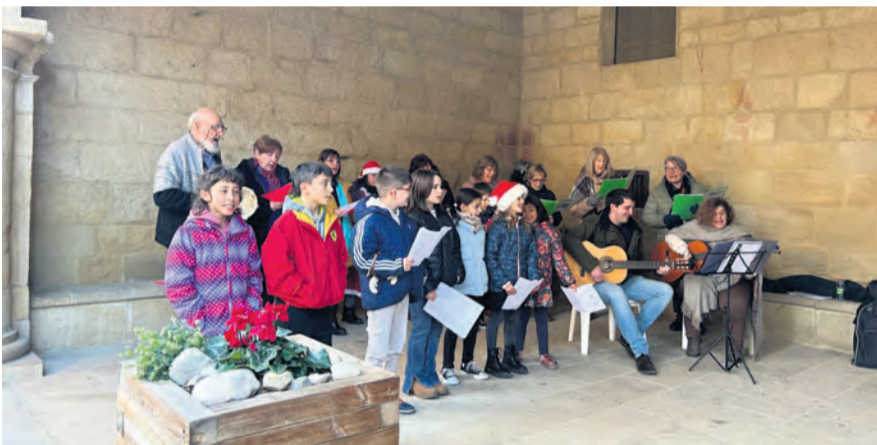
En Valjunquera celebraron la llegada de la Navidad con una emotiva cantada de villancicos, donde participaron vecinos de todas las edades. NDM