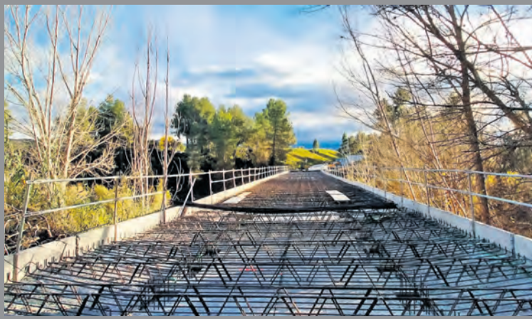
Estado de las obras del puente de Lledó sobre el río Algars.

Las obras del puente de Lledó sobre el río Algars continúan a buen ritmo, con la previsión de tenerlas acabadas a inicios de este mes de enero . Estos son los 'tempos' que mueve la empresa ejecutora del proyecto, Hormigones la Paz , y que suponen una inversión de 500.000 euros a cargo de la Diputación Provincial. Una actuación más que necesaria, sobre todo si tenemos en consideración que el puente era muy estrecho y actuaba como cuello de botella , entorpeciendo las comunicaciones entre Lledó y la vecina Terra Alta. La mejora de esta infraestructura ha supuesto el corte puntual de la