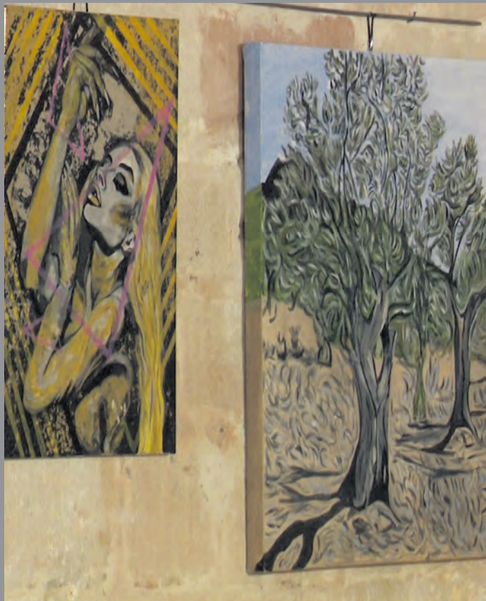
Los premios se darán a conocer el próximo 20 de enero. NDM