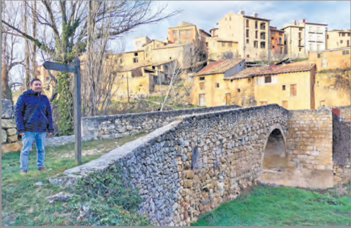
Lasmarias junto al puente medieval de Torre de Arcas. R. Lombarte