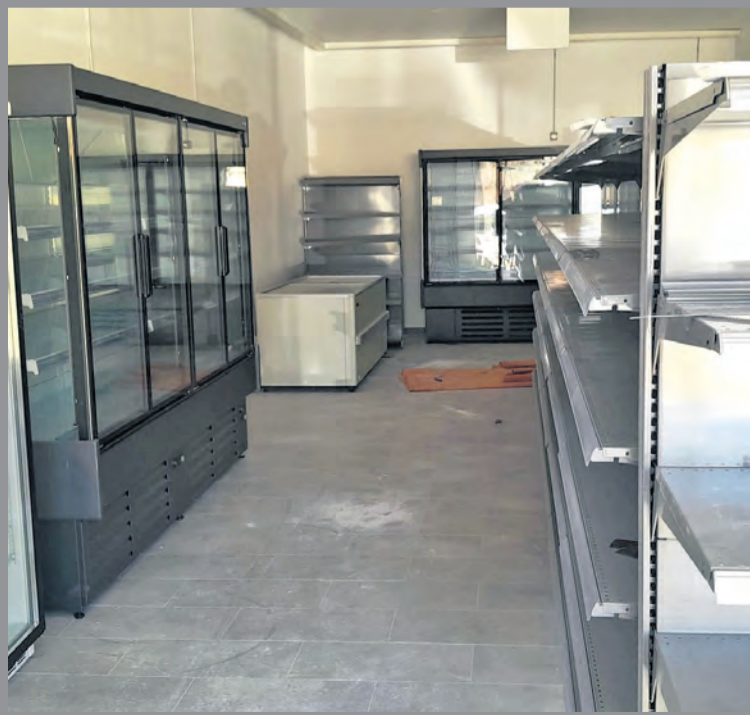
El ayuntamiento está ultimando los detalles de la tienda municipal. NDM

Ráfales estrenará su tienda municipal a primeros de marzo. Éstas son las previsiones que mueve el consistorio, después de que el pasado 6 de febrero, y en sesión extraordinaria, aprobara el pliego de condiciones para la gestión del Multiservicios Rural . De hecho, el procedimiento apareció en el Boletín Oficial de la Provincia del 12 de febrero, donde se especificaba que el plazo para presentar solicitudes por parte de los interesados era de 15 días naturales después de su publicación. La Mesa de Contratación valorará las ofertas presentadas y la documentación administrativa, previendo adjudicar la gestión de la tienda el 28 de febrero. Si nos centramos en los criterios de adjudicación que aparecen publicados en la web del ayuntamiento, se valorarán dos aspectos. La puntuación de las propuestas se hará atribuyendo un 70% de la ponderación a criterios relacionados directamente con la calidad de la gestión de la tienda, mientras que el 30% restante se basa en la aportación económica que ofrece el