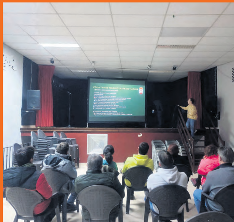
Monroyo ha protagonizado un encuentro previo a la 'Tres Trails'. I. Aparicio

El destino Sierras Matarraña está preparado para acoger la primera edición de la Matarranya 3 Trails , un formato de carrera inédito en Aragón y que constará de tres etapas. La carrera dará comienzo el sábado por la mañana, con un recorrido comprendido entre Peñarroya de Tastavins y Fuentespalda , y que constará de 24 kilómetros. Por la noche, la competición se trasladará hasta Monroyo , desde donde saldrá una etapa nocturna de 16 kilómetros que discurrirá también por Torre de Arcas . Y ya para el domingo, se celebrará la tercera y última etapa de esta carrera, con salida nuevamente desde Monroyo y paso por Ráfales , con una distancia de 23 kilómetros. En total, más de 63 kilómetros de recorrido y que contará con la presencia de más de 130 corredores . En la primera etapa participarán un total de 75 corredores. La etapa nocturna la protagonizarán 78 corredores, y en la etapa de cierre hay confirmados 90 participantes. Detrás de esta iniciativa que se vivirá este fin de semana (1 y 2 de marzo)