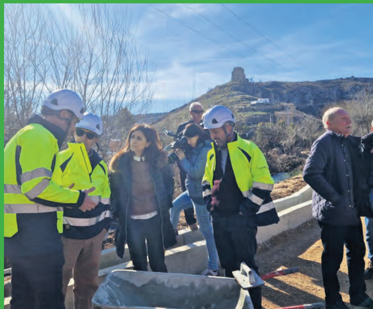
El Gobierno está actuando en puntos afectados por la DANA. DGA

Estas actuaciones cuentan con una financiación de un millón de euros por parte del Ministerio y son los servicios provinciales del Departamento de Medio Ambiente y Turismo quienes han redactado los tres proyectos globales, uno por provincia, y los responsables de la dirección de los trabajos. Estos consisten principalmente en reparaciones en pistas forestales, pasos de agua de barrancos y otras reformas de infraestructuras dañadas tras las pasadas DANA.