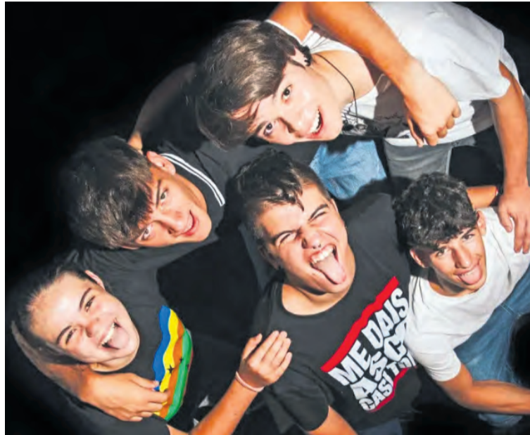
Imagen promocional con los cinco integrantes de la banda 'Kalumnia'. NDM

Los Kalumnia se han colado en las primeras posiciones del Viña Road , un concurso de bandas emergentes que impulsa la organización del Viña Rock y que premiará a los finalistas con una actuación dentro de la programación del festival para este 2025. De hecho, y a 26 de febrero, 'Kalumnia' suma 1.360 votos , y se encuentra entre los cinco primeros puestos del ránking. Ahora estamos en la primera fase del concurso, donde la decisión recae en el voto popular . Todas aquellas personas que deseen aportar su grano de arena y colaborar con los 'Kalumnia', pueden acceder a la página web del concurso, o ir directamente a https://road.vina-rock.com/votar/3253 , rellena el formulario de votación y confirmar. Durante esta primera fase del concurso, que finaliza el 4 de abril , el voto popular determinará el orden de las bandas noveles preferidas para actuar en el Viña Rock. Las 20 bandas más votadas pasarán a la fase final, y será ahí donde entrará la dirección del festival, que partiendo de criterios como la línea musical y las condiciones técnicas, decidirá qué dos grupos actuarán en el Viña Rock.