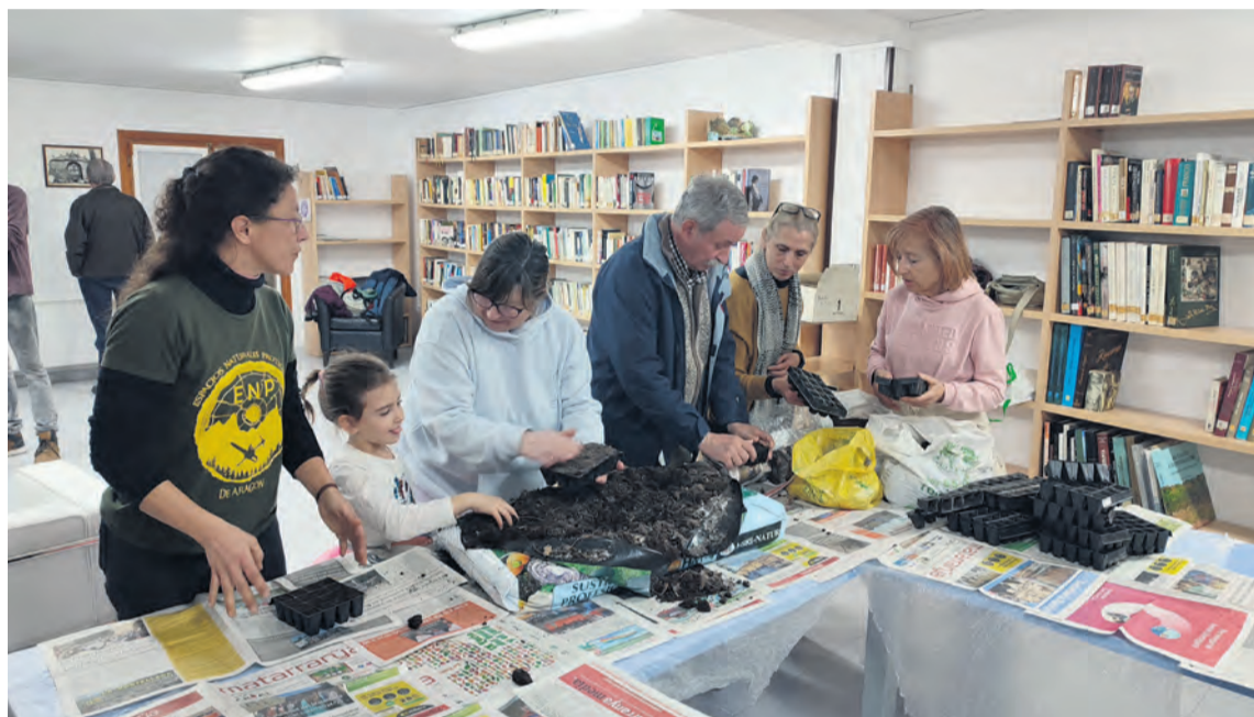
Diferentes vecinos del Matarraña participaron en el taller de sustratos que se celebró en la biblioteca. M. Jiménez

Tomate de cuelga de Mas de las Matas; tomate morado de Alcañiz; tomate grande rosado de Berge; tomate de conserva de Beceite... Así, hasta catorce variedades distintas. La 'Biblioteca de Llaorettes' de Peñarroya de Tastavins ha puesto en marcha una nueva temporada de horticultura impulsando un taller de elaboración de sustrato para plantel, y que se ha complementado con un experimento de ciencia ciudadana para saber cómo se comportan diferentes variedades de tomatara del Bajo Aragón a partir de 650 metros de altitud. De hecho, y a través del CITA (Centro de Investigación y Tecnología Agroalimentaria), se han repartido distintas semillas de tomate entre los horticultores de la localidad, con la responsabilidad de plantarlas, cuidarlas y hacer su seguimiento. Además, y si la cosecha prospera, la intención es hacer en verano una cata de tomates y un taller de extracción de semillas , "devolviendo" todos estos conocimientos a la biblioteca. A través del CITA, y gracias a la labor de toda una serie de prospectores del territorio que en su día recogieron diferen-