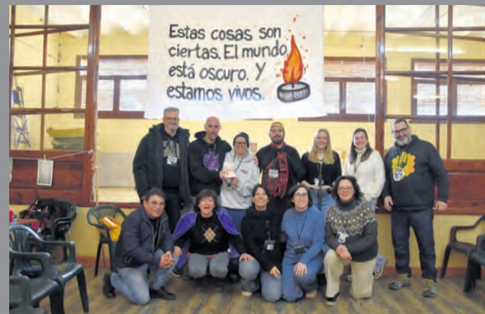
Foto de grupo tras acabar el juego de rol en vivo.