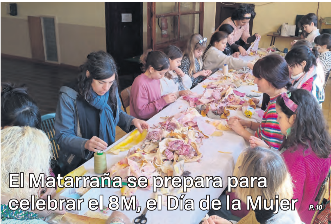
El Matarranya se prepara para celebrar el 8M, el Día de la Mujer P.10

En Valderrobres, las mujeres prepararon una obra colaborativa para una exposición que se estrenará el 8M. M. Jiménez