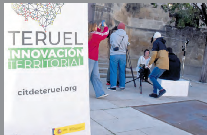
La convocatoria tuvo lugar en Fuentespalda.

Es un programa que gusta, pero no todos pueden participar, ya que hay más demanda de plazas de las que el instituto IES Matarraña puede ofrecer. Aun así, las oportunidades son muchas. Precisamente, la primera semana de febrero, un grupo de 6 alumnos del IES viajó a Noruega con el proyecto de cooperación Erasmus+ llamado 'Think Globally, Act Locally'. En mayo está previsto que estudiantes de Bérghamo devuelvan la visita y hagan una estancia en el Matarraña. Y para abril está programado un viaje con destino a Eslovaquia .