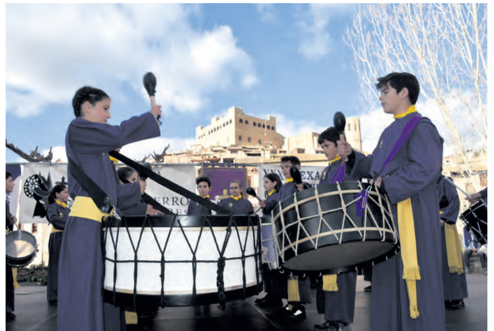
Bombos y tambores de Valderrobres están preparados para la Semana Santa. NDM