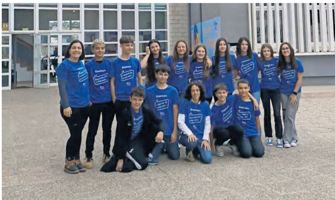
Fotografía de grupo con los estudiantes que viajaron durante el primer trimestre a Italia. IES Matarraña

Este curso los alumnos de segundo de la ESO han tenido la oportunidad de viajar a Italia con el proyecto europeo