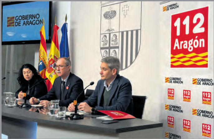
Presentación de la Memoria del 112 Aragón del 2024. DGA