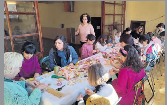
El taller se desarrolló en el Salón de las Hermanas.