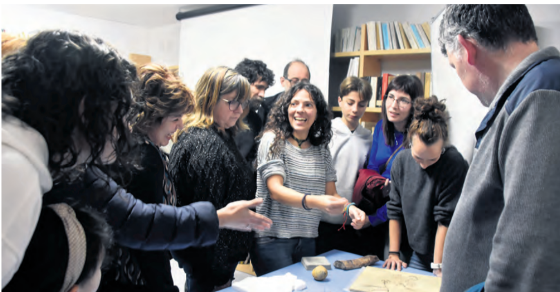
Esta es la primera actividad del ciclo de actividades 'Tras las huellas del Tastavinsaurio'. I. Aparicio

La científica de Peñarroya de Tastavins impartió una conferencia sobre igualdad, dinosaurios y geología