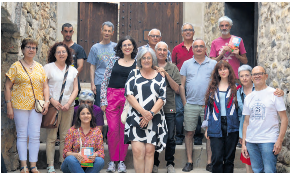
Fotografía tomada en Nonaspe durante uno de los encuentros del club de lectura 'Oratge' en 2024.

Amantes de la literatura crean un club de lectura donde confraternizan obras en catalán, aragonés y castellano