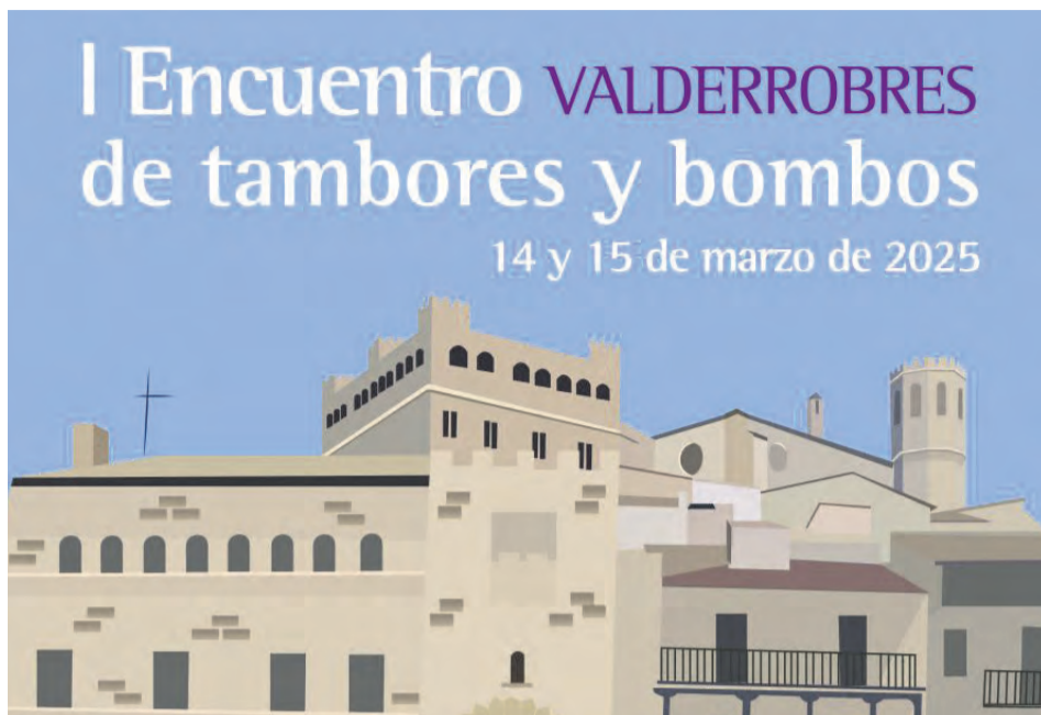
Los grupos locales y cinco cofradías invitadas participarán en el encuentro. NDM