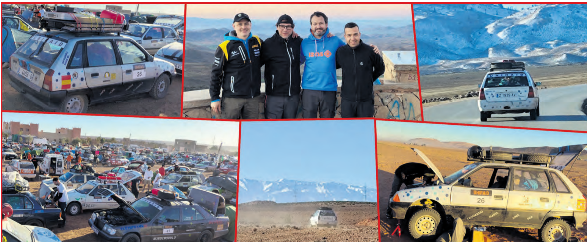
Colección de fotografías del viaje de los cuatro valderrobrenses por Marruecos. M. Bel