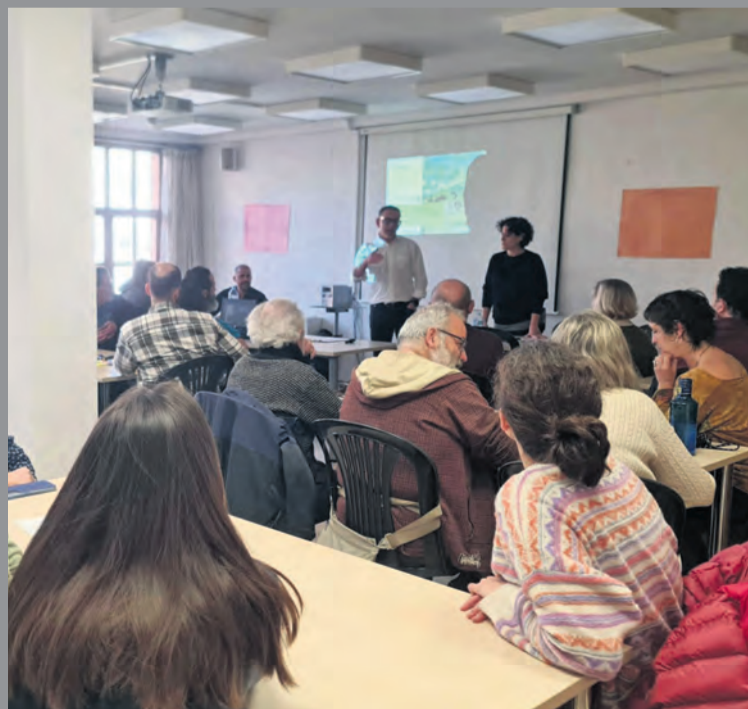
La primera reunión atrajo el interés de los empresarios del territorio. NDM

Durante la jornada, se establecieron las acciones a desarrollar en los próximos meses. Los objetivos principales que se marcaron fueron la desestacionalización , aumentar el gasto económico que hace el visitante en el territorio y distribuir la riqueza genera-