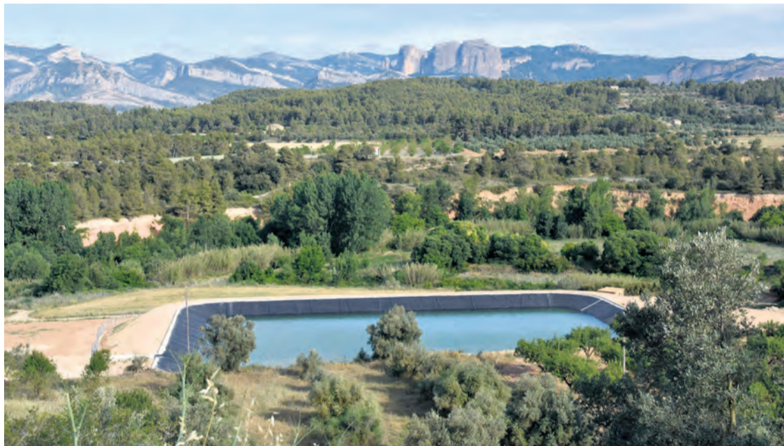
La balsa se construyó en el 2023 pero hasta la segunda fase no estaba conectada a la red de abastecimiento.