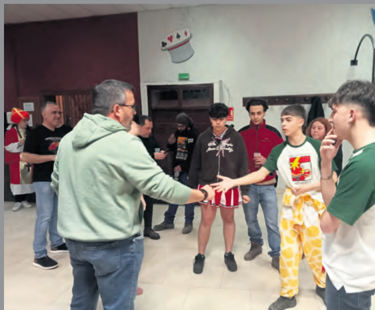
Fotografía de la final del campeonato de Monroyo.

En paralelo al campeonato, se realizaron diversas actividades para dar a conocer este juego entre los más jóvenes. Se organizaron talleres de morra en la escuela del pueblo,