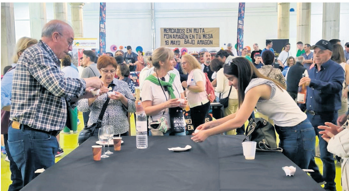
'Mercados en Ruta' se cerró con una feria el domingo 18 que reunió a unos 15 stands diferentes en Alcañiz. NDM

El programa, que se lanzó con 'Pon Aragón en tu Mesa', se tradujo en actividades, degustaciones y showcooking