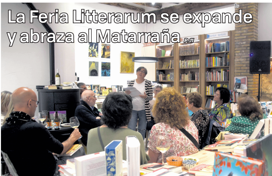
Calaceite se convierte en una nueva sede para el evento literario con la acogida de diferentes actos. I. Aparicio