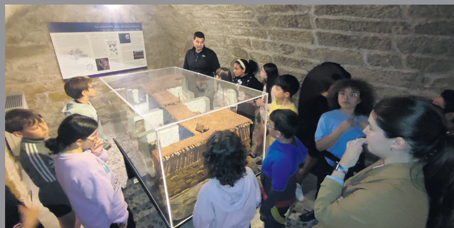
Alumnos de la escuela de Calaceite durante su visita al museo. M.J.