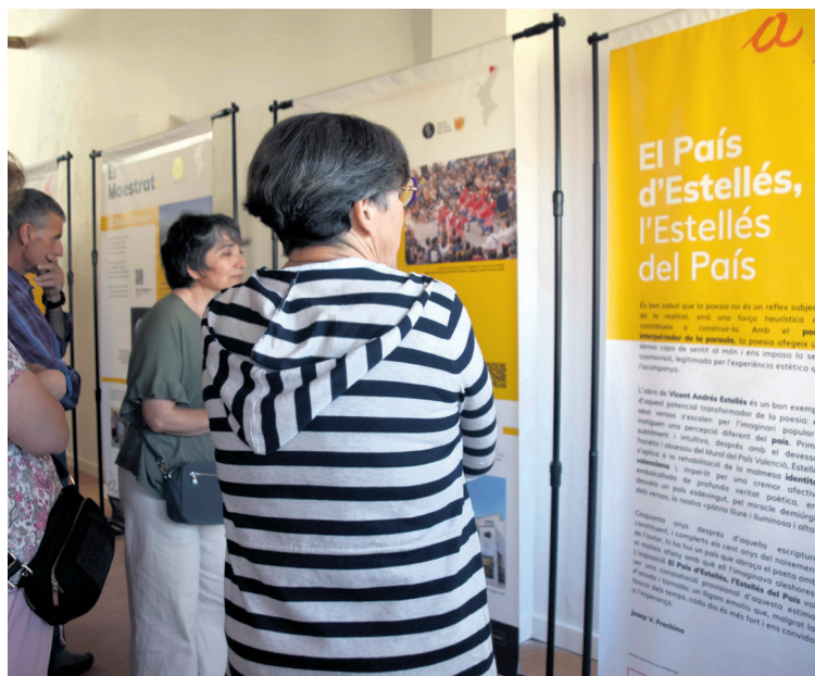
El acto de presentación llenó el espacio expositivo de la librería. I. Aparicio

en Calaceite ha tenido lugar una presentación organizada en el espacio cultural De Bat a Bat Llibres y con la colaboración de la Associació Cultural del Matarraña ( ASCUMA ). El acto ha incluido la presentación del libro Ordint Trames , una muestra coral escrita por siete mujeres del territorio, así como una exposición sobre el poeta valenciano Vicent Andrés Estellés . El broche musical ha venido de la mano del cantautor aragonés Tomàs Bosque , acompañado por los hermanos Celma , con temas dedicados al poeta de Peñarroya de Tastavins Desideri Lombarte. "Queremos que cada año haya actos en el Matarraña y en el País Valencià", declaró Flores. "Estamos en el corazón de un territorio lingüístico