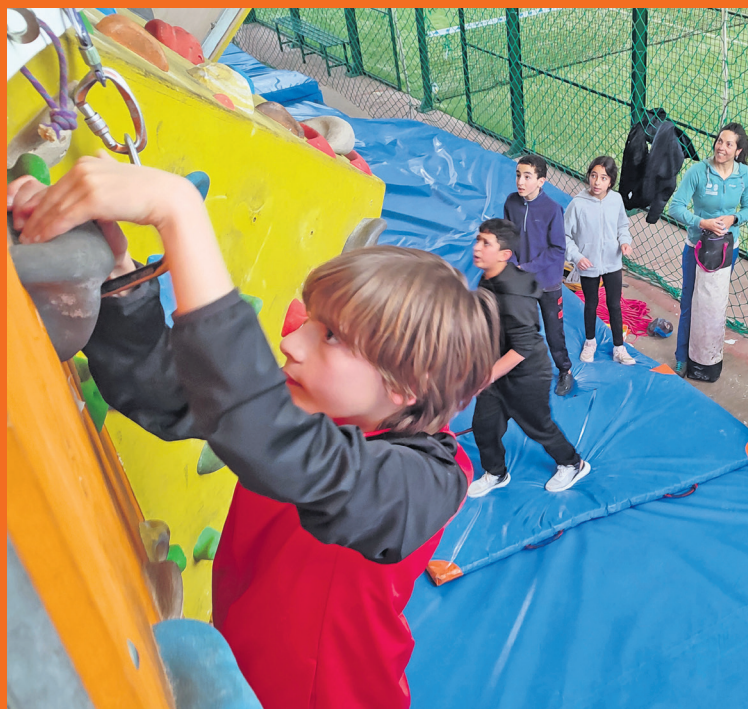
Las clases se realizan en las instalaciones deportivas de Monroyo. R. L.

Esta disciplina requiere constancia y dedicación. Rodríguez explica que la escalada se sostiene sobre tres patas: la fuerza de brazos y piernas, junto con la estrategia y la psicología, distribuidas en una propor-