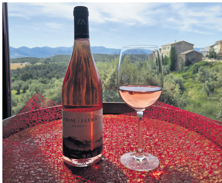
El Crial Lledó Matarraña rosado consiguió una doble medalla de oro.

El concurso Grenaches du Monde, que reúne a los mejores vinos elaborados con la variedad Garnacha de todo el mundo, destacó el rosado del Matarraña entre una importante competen-