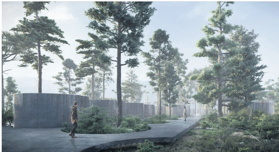
Recreación digital del proyecto arquitectónico de Solo Houses en Cretas.