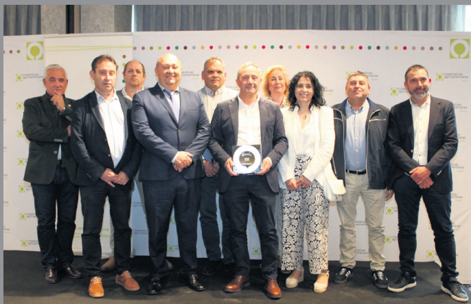
Foto de grupo tras recibir el premio.