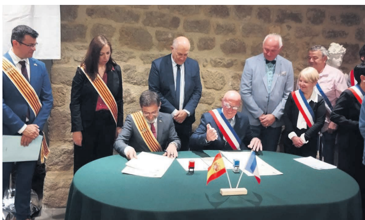
El acto oficial de hermanamiento en territorio francés. NDM

cribió Lespignan como un pueblo "muy mediterráneo, con mucha cultura de viña" y destacó la similitud en el carácter de la gente: "Son gente muy abierta, dinámica y alegre, y enseguida hemos congeniado. Incluso, a pesar de