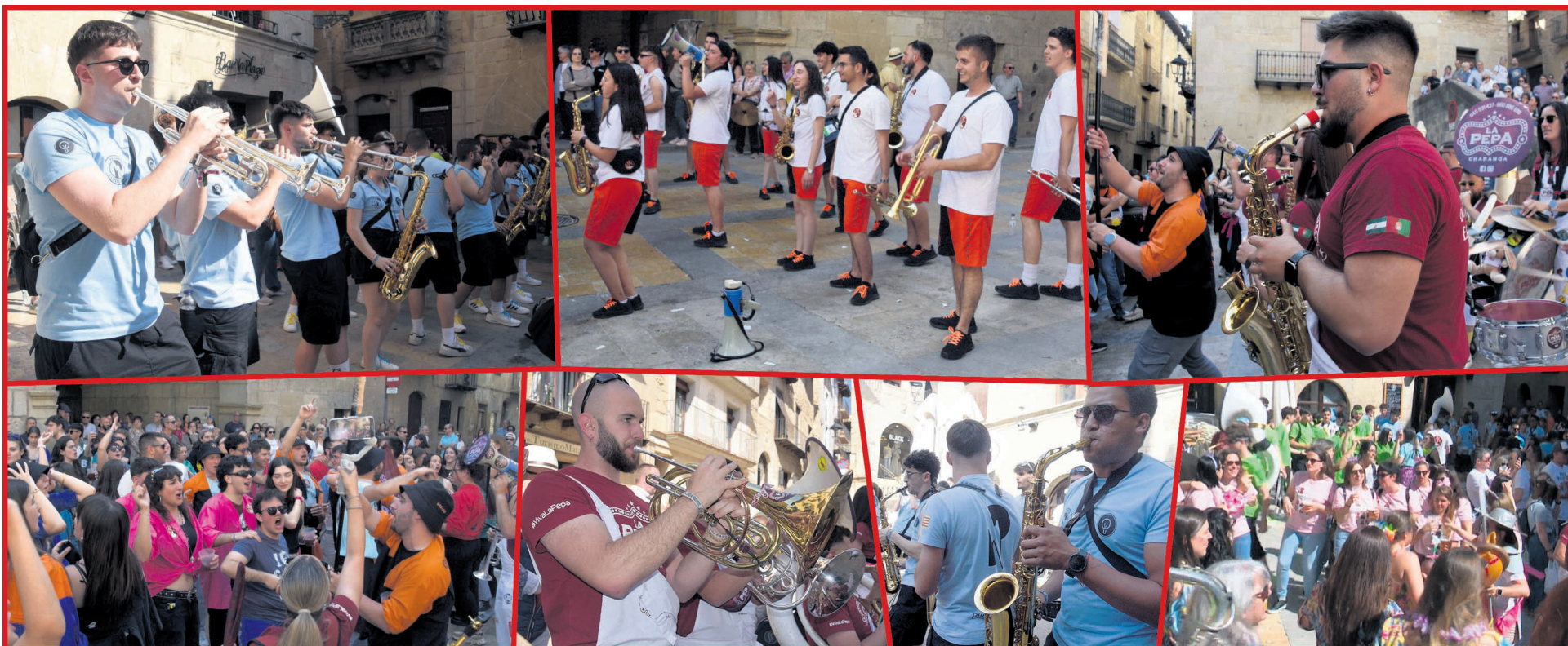
La plaza de Valderrobres se llenó de gente, música y diversión en la IV edición del concurso de Charangas. Isabel Aparicio