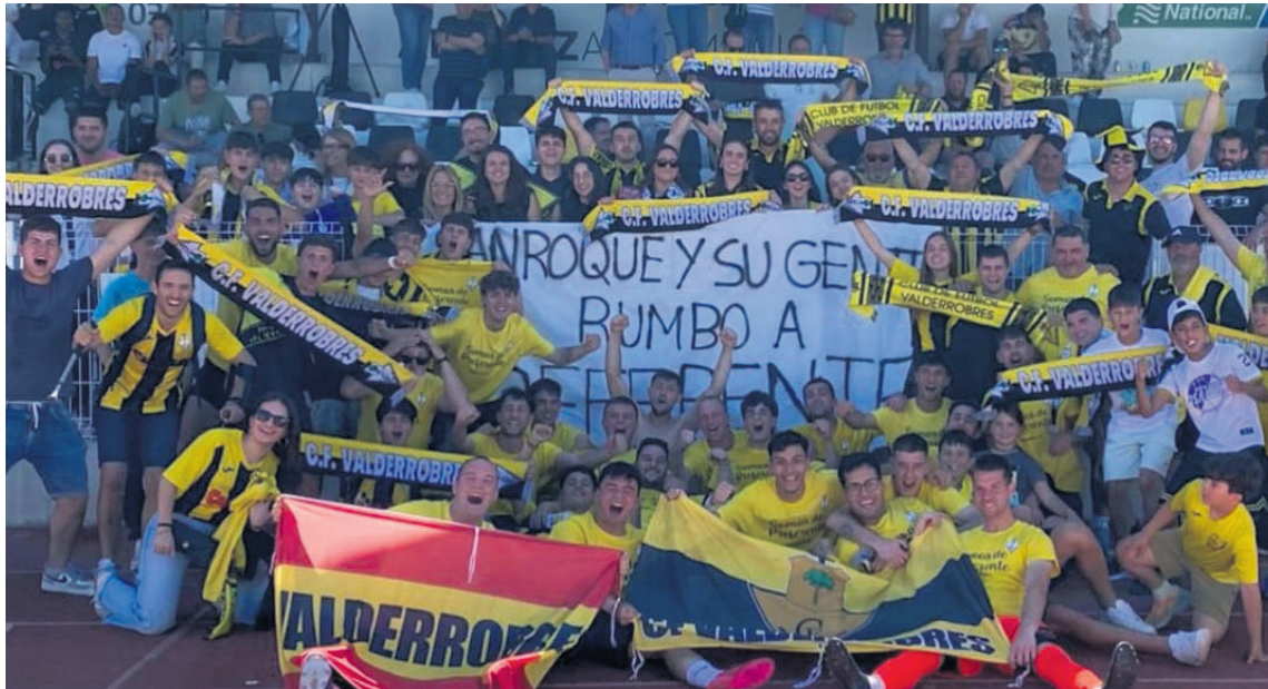
El equipo, la directiva y la afición del Valderrobres celebraron una victoria que ha valido un ascenso histórico.