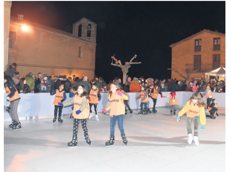
La pista de patinaje sobre hielo fue uno de los reclamos principales. SCO