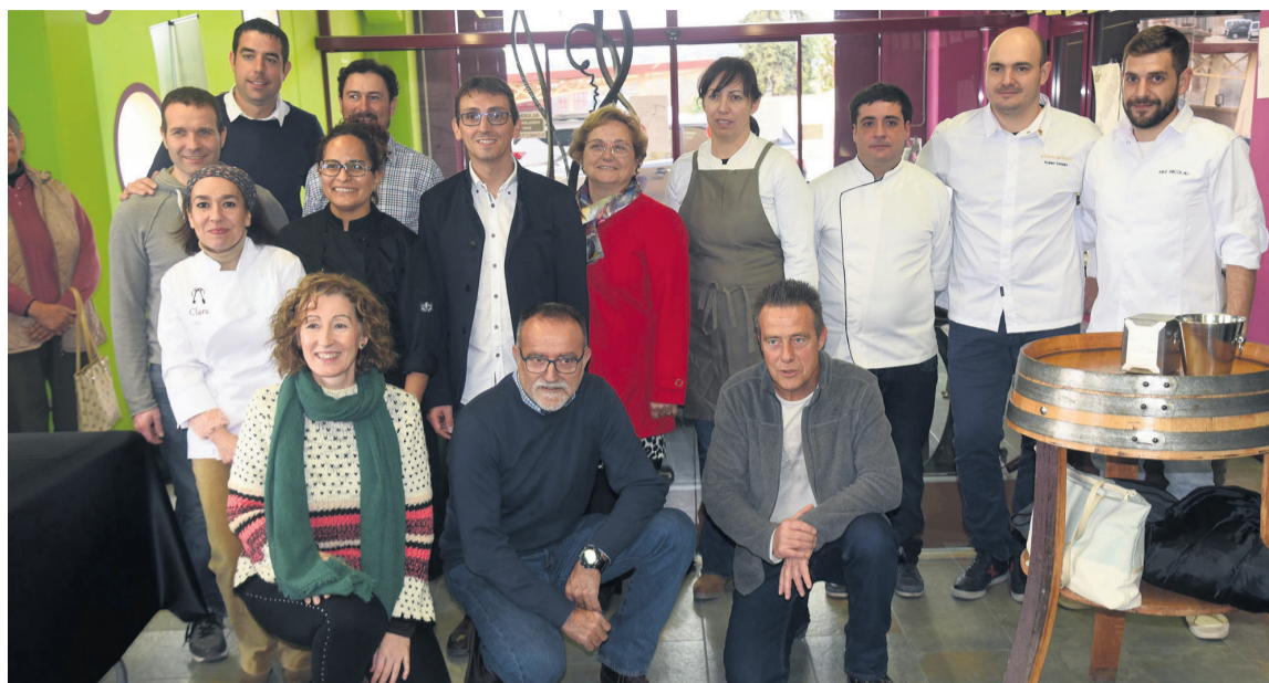
Cinco bodegas y cinco restaurantes del territorio participaron en la clausura de las Jornadas Gastronómicas del Matarranya. JP