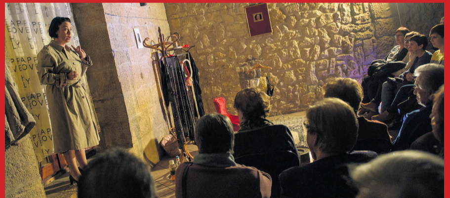
Alumnos de CPEPA Valderrobres procedentes de varios municipios del Matarraña disfrutaron de la obra 'Espérame en el Cielo' de Francachella Teatro que se representó en La Codoñera. MMB