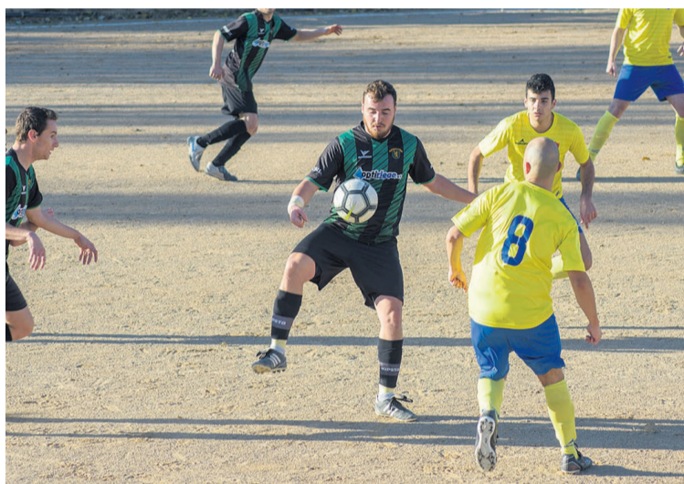
El Mazaleón no estuvo acertado en el gol y solo pudo empatar con el La Salle. MMB