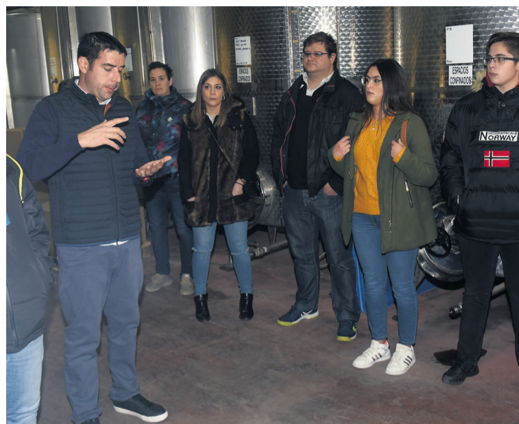
Los asistentes conocieron las instalaciones de Bodegas Crial de Lledó. JP