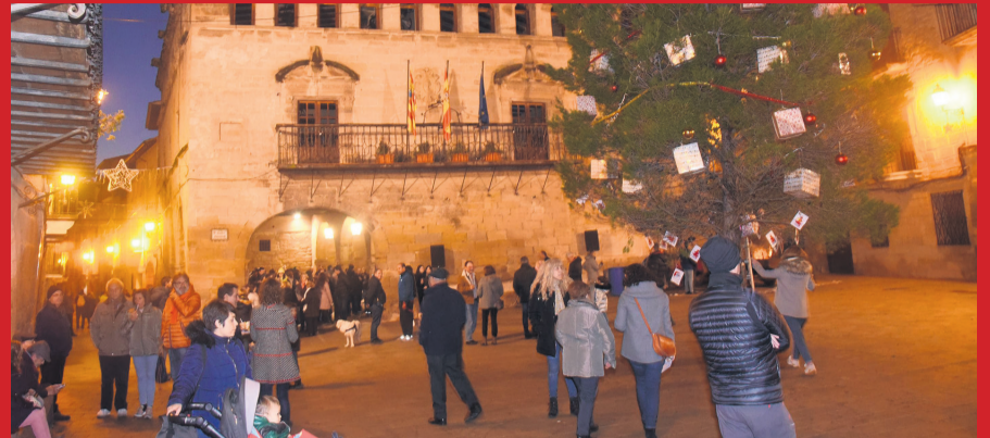
La Fresneda celebró el día de la 'Plantà del Pi' en el que pequeños y mayores pudieron participar en un taller de postales navideñas, el encendido de las luces y una merienda popular. JP