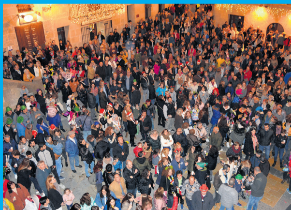
Valderrobres hizo un masivo ensayo de las campanadas. JP

Aun así, no hay nada que se le resista a Valderrobres. La lucha por conseguir ser el municipio escogido para dar las campanadas de Telecinco y recibir de nuevo la iluminación navideña de manos de Ferrero Rocher centró este mes todos los proyectos del municipio. Desde su inicio el pasado 31 de octubre, la carrera está fue de fondo. La apertura de la nueva oficina de turismo con el fin de recabar votos en favor de Valderrobres y la ce-