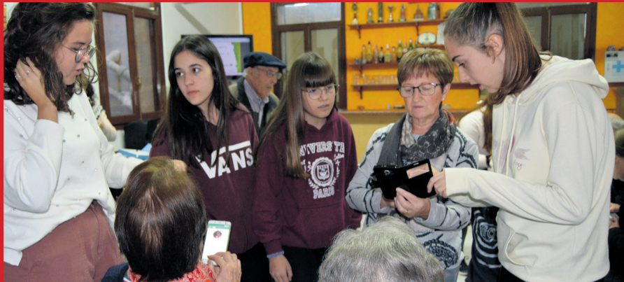
Las Antenas Informativas del Matarraña se desplazaron hasta Fuentespalda para organizar un pequeño taller en el que enseñaron a los mayores a utilizar sus dispositivos móviles.

Edite: Mas Mut Produccions, S.L. Noguereis, 2 · 44586 Pena-roja de Tastavins // Depòsit Legal: T-1250-10 Redacció, maquetació i fotografia: Marc Martí, Marta Jiménez, Paula Viver, Sabina Colomé // Publicitat: 978 85 14 07 / 669 81 64 89