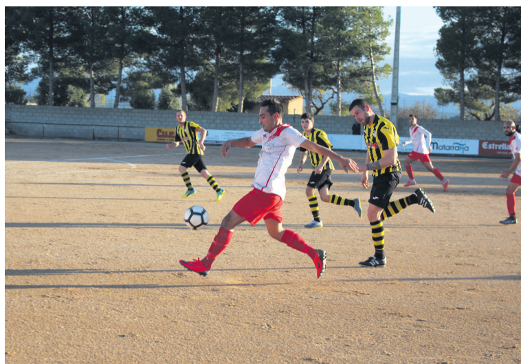
El Calaceite superó al Valderrobres en el primer derbi del Matarranya. PVS