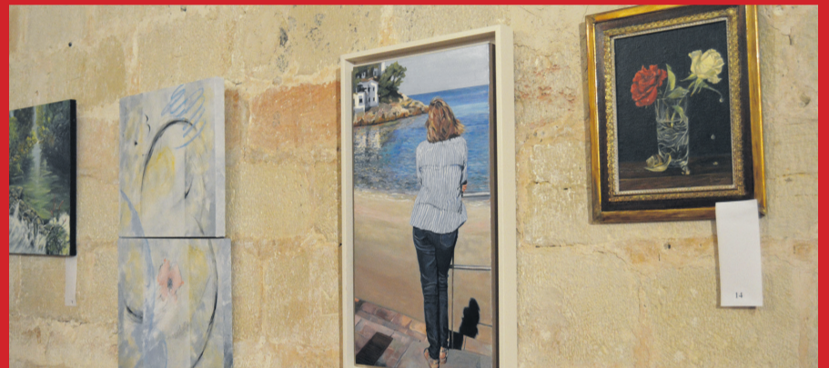
La ermita de la Virgen de la Fuente de Peñarroya de Tastavins acoge una exposición de todas las obras pictóricas presentadas al XVI Concurso de Pintura 'Desideri Lombarte'. MJG