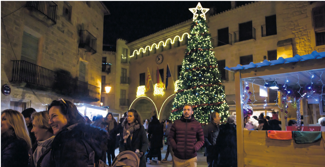
Cientos de visitantes abarrotaron el casco histórico de Calaceite durante la celebración del certament ferial. MMB