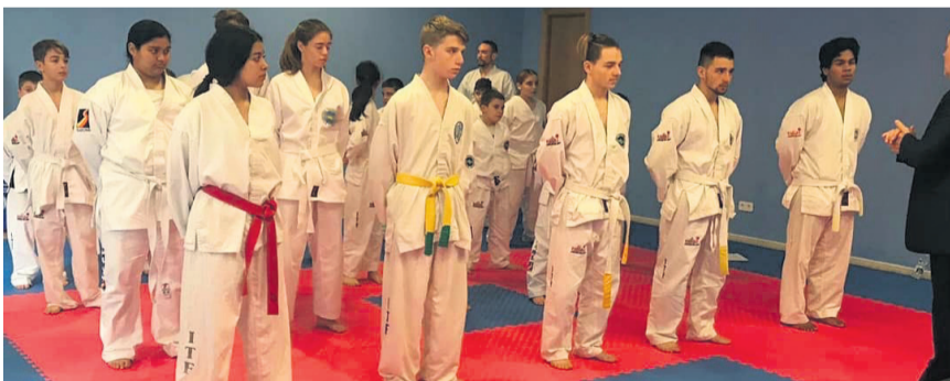
Niños y adultos participan en las clases de Taekwondo que se desarrollan en Valderrobres. NDM