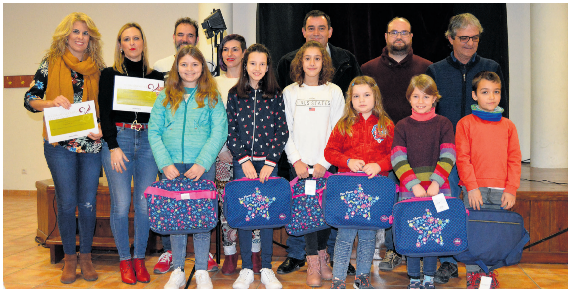
Los más pequeños fueron los protagonistas en la entrega de los premios del concurso 'Qüento va, qüento vingue'. JP