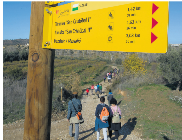
La Comarca presentó dos nuevos senderos locales en Mazaleón. MMB