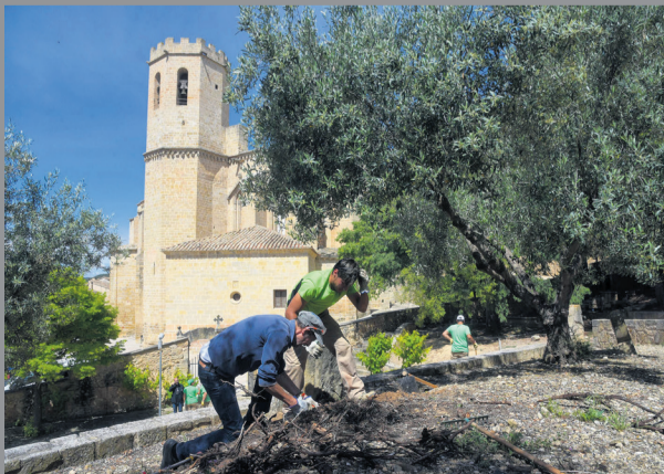
La Comarca ya realizó un taller de empleo sobre jardinería. NDM

Entre los talleres aceptados por el Gobierno de Aragón en el territorio, se destinarán 189.000 euros a la entidad comarcal para la elaboración de un taller en virtud de certificar de manera profesional a personal de ayuda a domicilio . Una cualificación que repercutirá directamente en la creación de puestos de trabajo en la zona. "En la actualidad, cuando