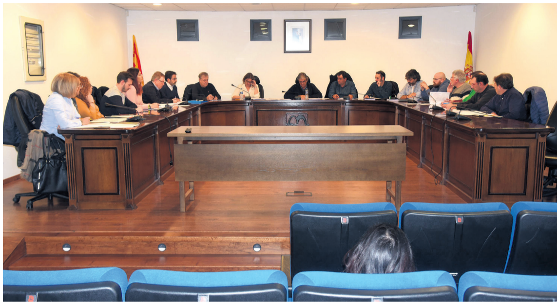
En el último pleno la Comarca del Matarranya aprobó los presupuestos para el próximo año 2020. JP

Los próximos objetivos económicos de la institución comarcal se rigen por los pocos ingresos por parte del