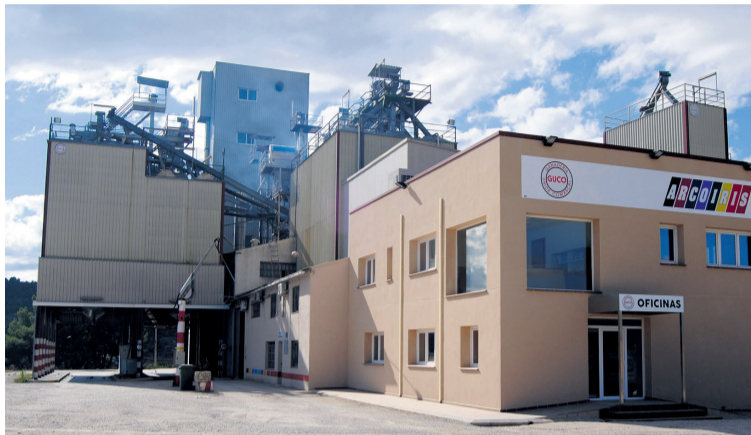
Se invertirá en una nueva línea de producción en la planta de Valderrobres.