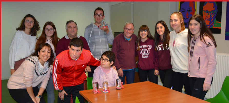
Los usuarios del Centro de ATADI en Valderrobres se lo pasaron en grande aprendiendo a elaborar diversos adornos navideños de la mano de las Antenas Informativas del Matarraña. MJG