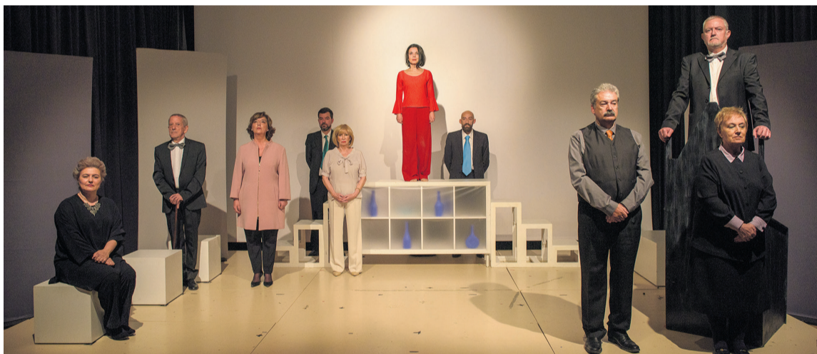
El teatro de 'La Germandat' de Calaceite se llenó de público para disfrutar de la obra '10 Negritos'. MMB

Ya el sábado, Mazaleón tomó el testigo con la presentación de dos nuevos senderos locales, unas rutas que llevan a