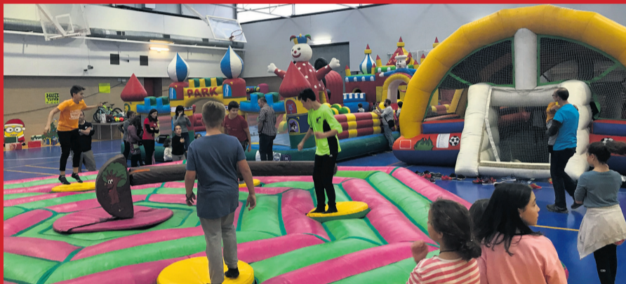
El pabellón polideportivo de Valderrobres acogió este pasado sábado 7 de diciembre una nueva edición del Chiquifestival en la que los más pequeños disfrutaron de juegos y talleres. SCO